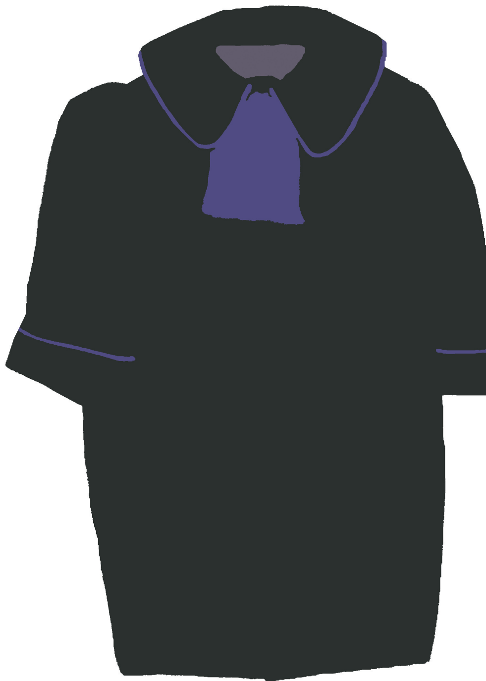
- widok z przodu