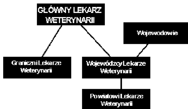
Rys. 1. Schemat organizacji Inspekcji Weterynaryjnej w Rzeczypospolitej Polskiej

Struktura oraz kompetencje organów Inspekcji Weterynaryjnej zostały określone w ustawie z dnia 29 stycznia 2004 r. o Inspekcji Weterynaryjnej (Dz. U. z 2007 r. Nr 121, poz. 842, z późn. zm.).