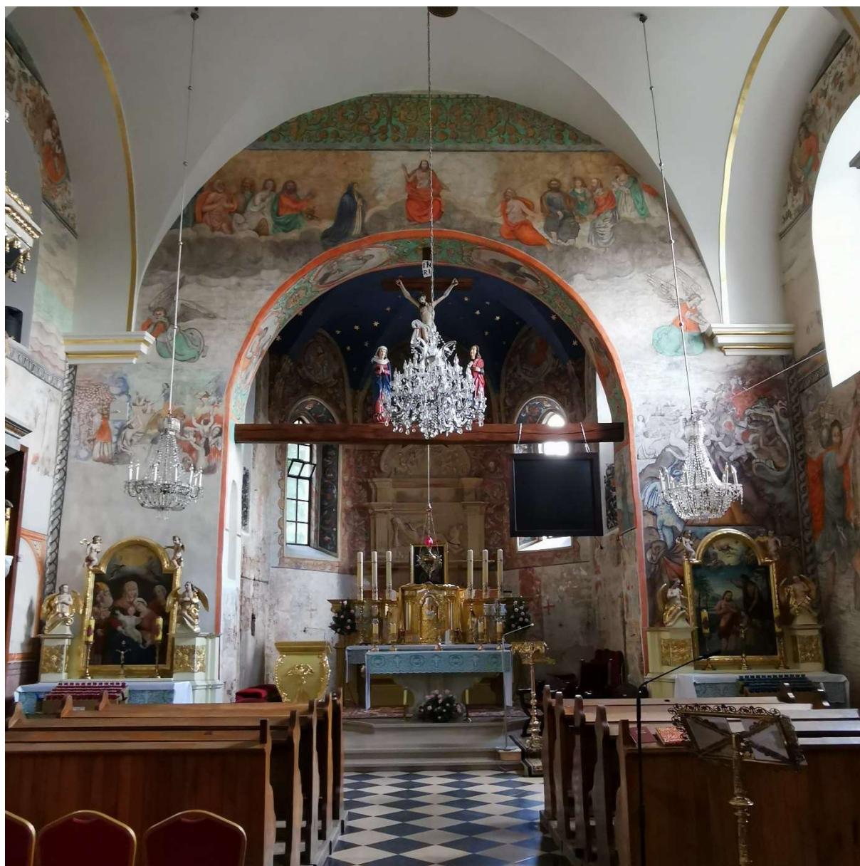
Kościół PW Wniebowzięcia Najświętszej Maryi Panny w Bestwinie

oraz na przebudowie wejścia i wyjścia na tereny wokół obiektu. Całkowity koszt inwestycji to 144 200 zł., poziom dofinansowania – 40%, beneficjentem jest Gminny Ośrodek Kultury w Bestwinie.