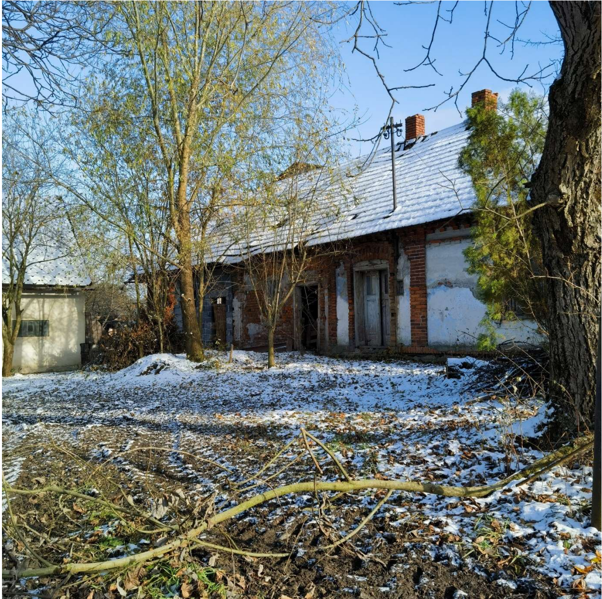
Budynek mieszkalno-gospodarczy ul. Janowicka 151 Janowice