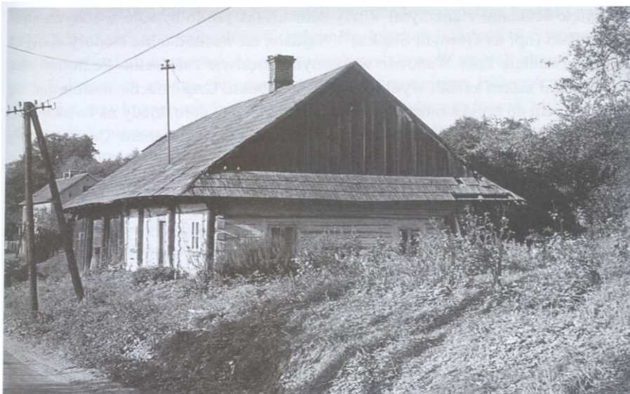
Ilustracja 3: Stara chata z ul. Kościelnej – nieistniejąca

W czasach nowożytnych, przed uwłaszczeniem chłopów i parcelacją dużych, pełnorolnych gospodarstw chłopskich, miejscowości posiadały charakter ulicówek o wyodrębnionych częściach (przysiółkach), których nazwy przetrwały w nazewnictwie lokalnym do czasów obecnych. Wioski stanowiące własność rycerską (alodialną) od XV w. ulegały bardzo często podziałom. Struktura przestrzenna poszczególnych jednostek osadniczych, istniejących na terenie obecnej gminy Bestwina – w tym średniowiecznych wsi – przetrwała aż do XIX w. Charakteryzuje się ona skupioną, zwartą zabudową, brakiem licznych rozproszonych przysiółków. Mimo rozrostu osad relikty pierwotnych układów przestrzennych są czytelne na kolejnych mapach wykonanych przed uwłaszczeniem chłopów, a następnie rozdrobnieniem gospodarstw, wskutek ich parcelacji między dzieci, głównie synów chłopów. Analiza przekazów kartograficznych z XIX w. pozwala na stwierdzenie, że ramy przestrzenne zabudowy nie wyszły poza ustalone przed wiekami obszary.