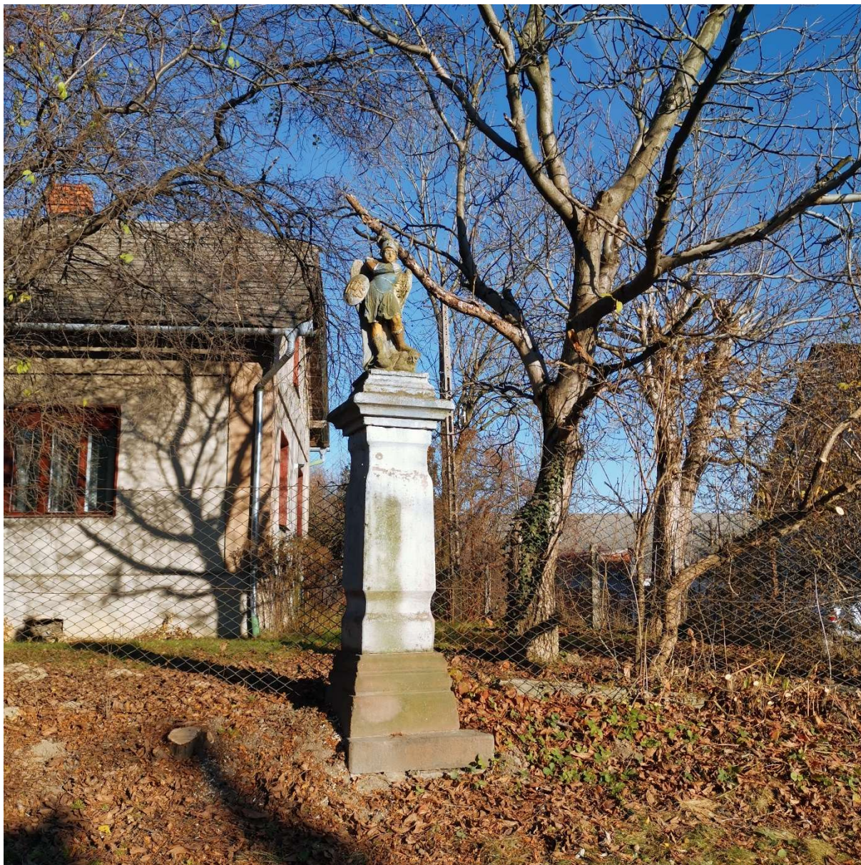
Figura św. Michała Archanioła w Bestwinie koniec XVIII w. stan na listopad 2022r. (przed rozpoczęciem prac renowacyjnych)