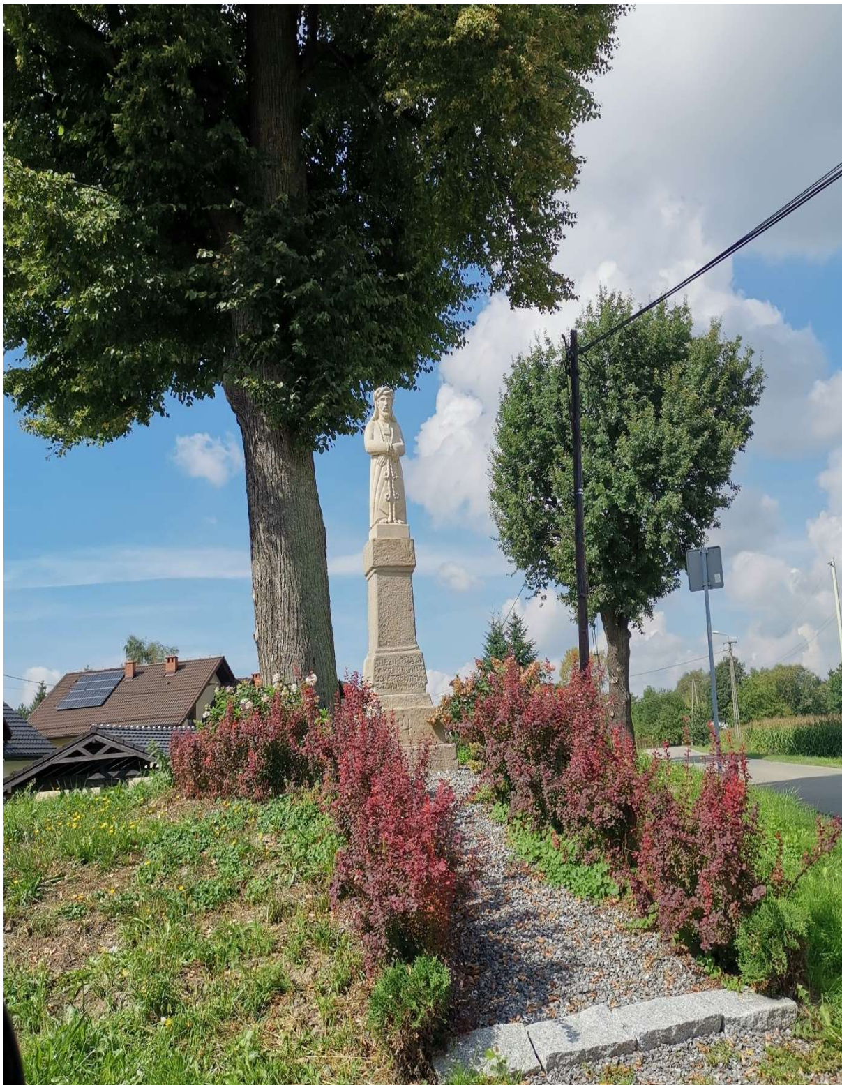
„Figura Chrystusa na postumencie” z 1814 r. Figura stoi u zbiegu ulic Stefana Kóski i Walentego Furczyka w Kaniowie, po renowacji.