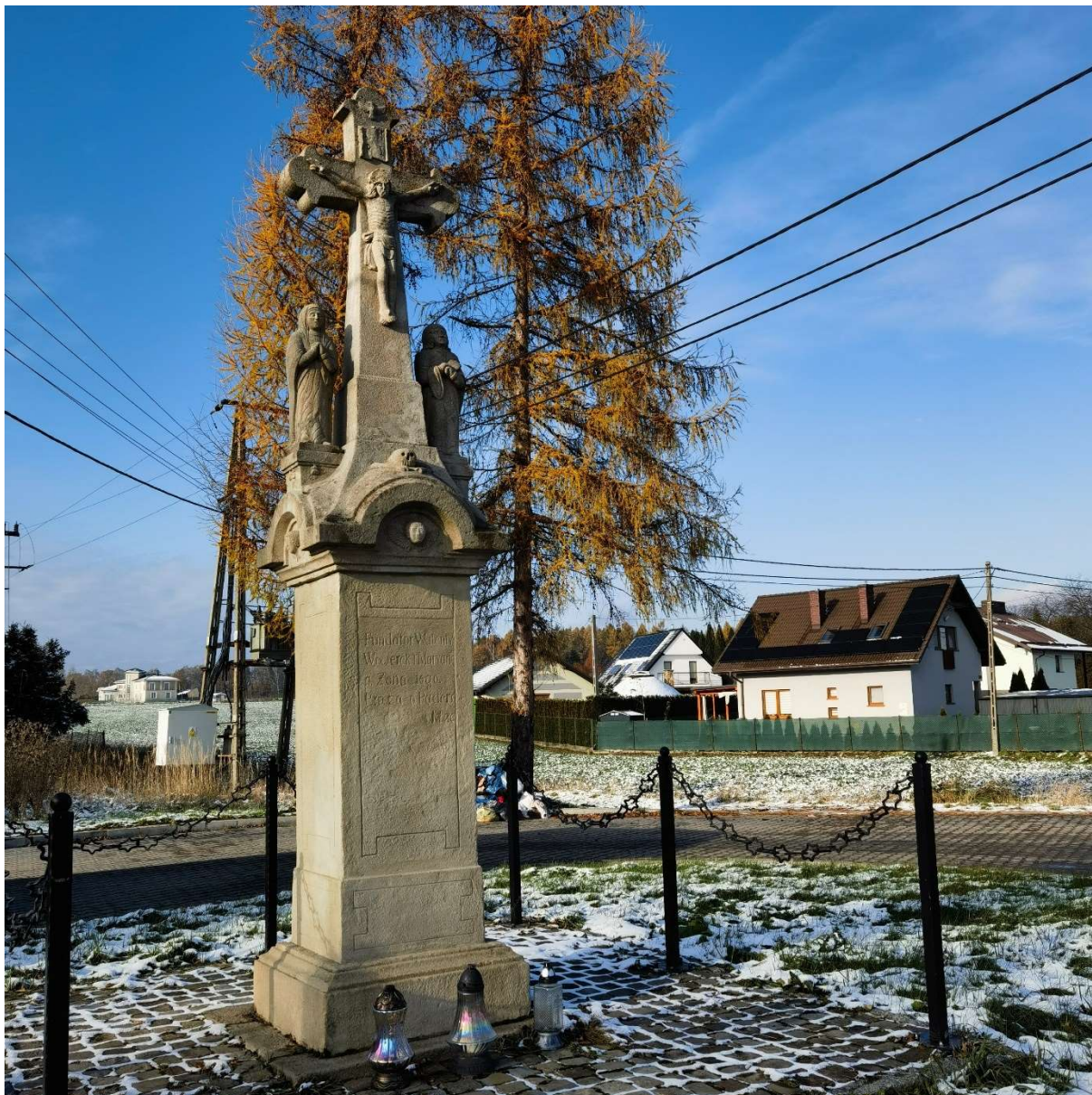
Krzyż Kamienny Przydrożny Nikłówka druga poł. XIX w. po usunięciu śladów dewastacji w 2020r.