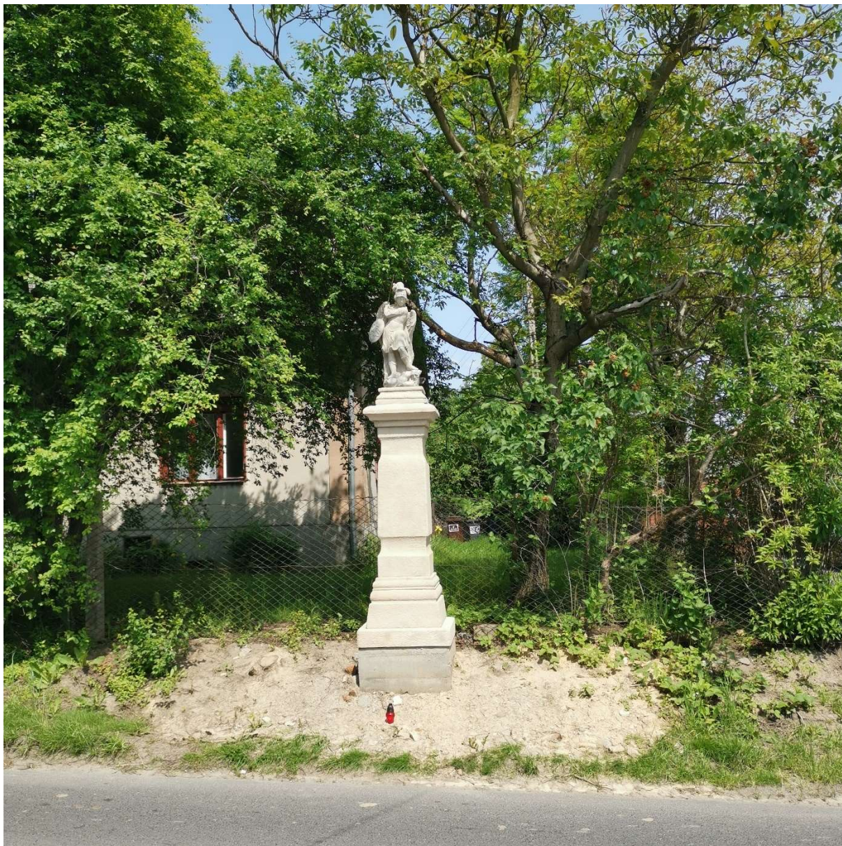
Figura św. Michała Archanioła w Bestwinie stan na maj 2023r. (po zakończeniu prac)