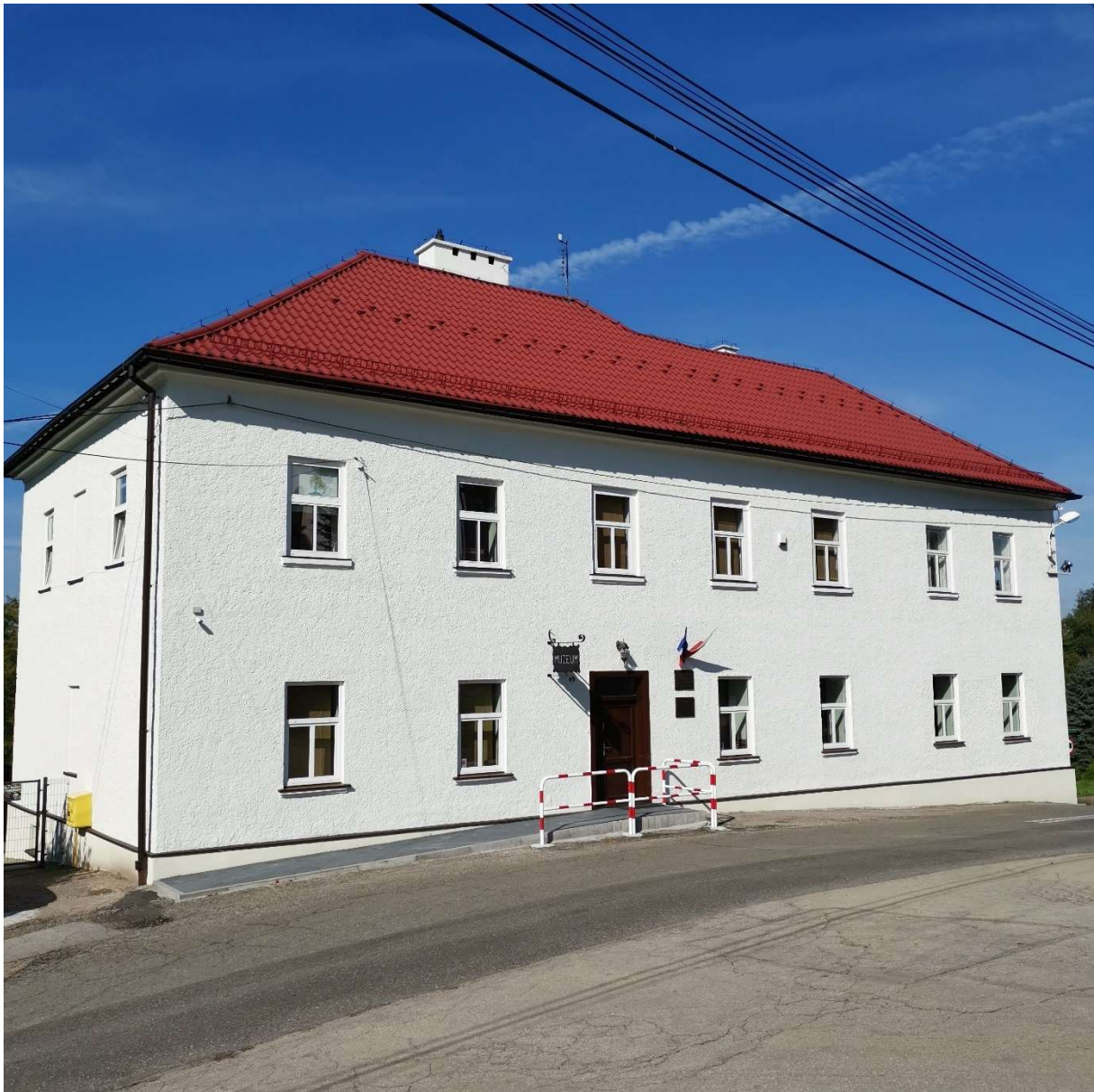
Budynek Muzeum Regionalnego im. Ks.Z.Bubaka w Bestwinie po renowacji elewacji.