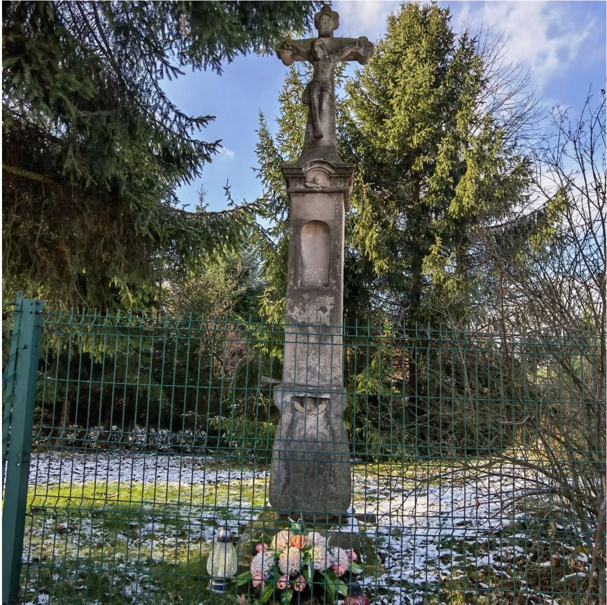
Krzyż Męki Pańskiej w Kaniowie przy ul. Malinowej 10