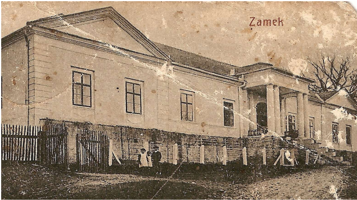
Ilustracja 1: Zdjęcie archiwalne - Pałac Habsburgów w Bestwinie