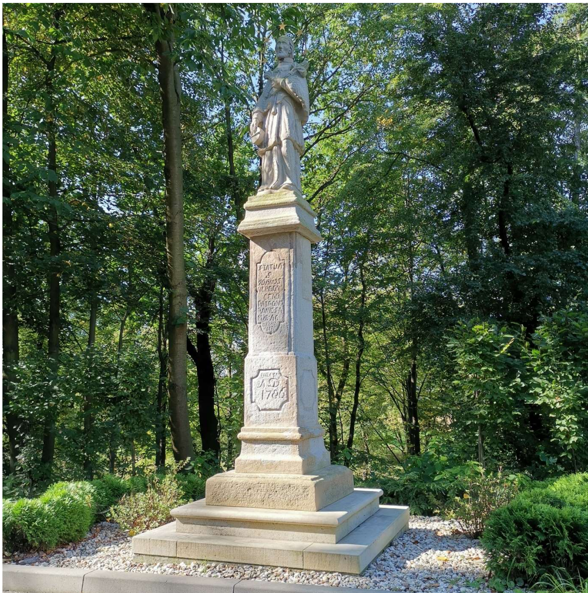
Figura św. Jana Nepomucena, na ul. Kościelnej w Bestwinie po renowacji.