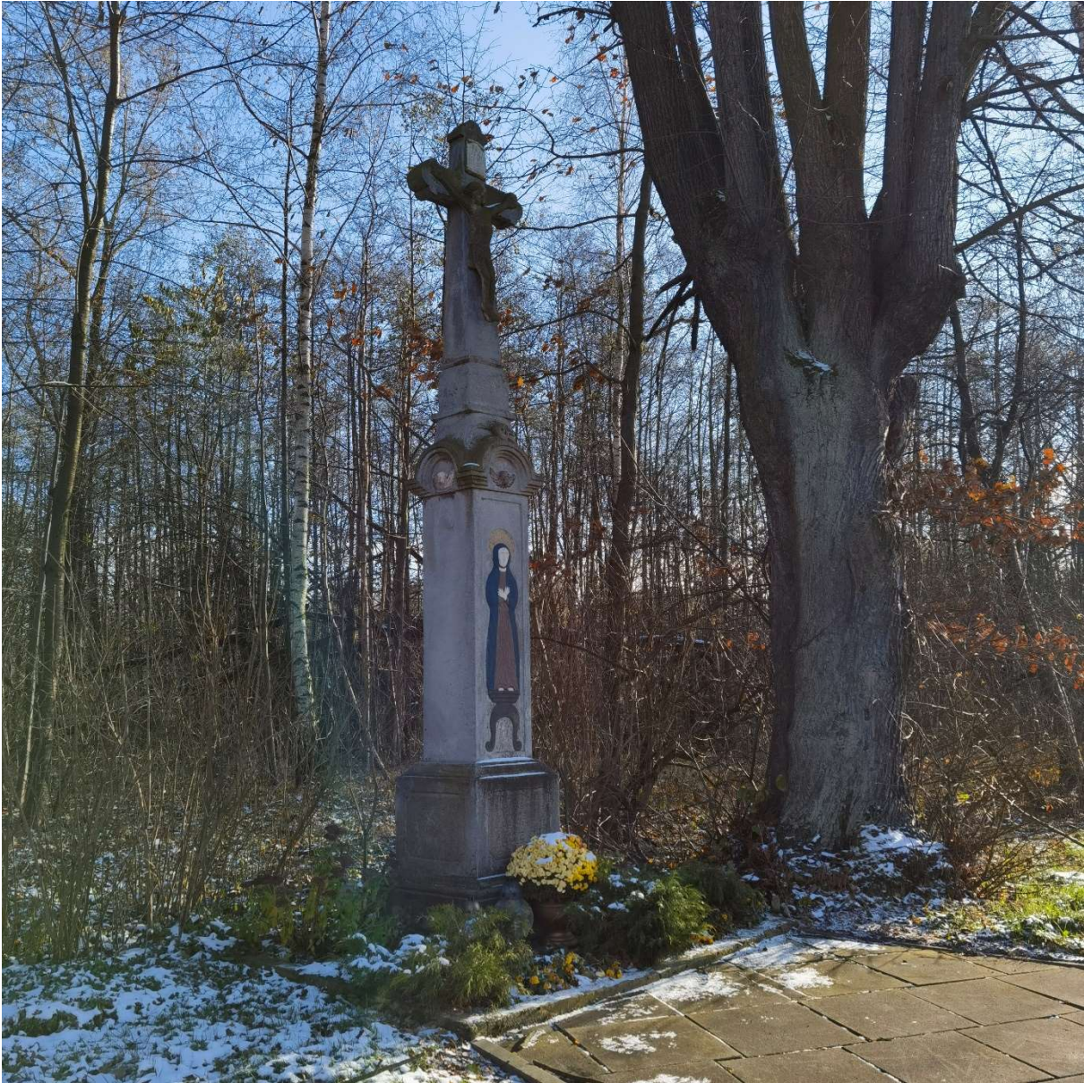
Krzyż kamienny przydrożny z płaskorzeźbą Matki Boskiej Bolesnej, skrzyżowanie ulic W.Witosa/Podpolec 1 w Kaniowie

W zakresie pozytywnych aspektów wskazać należy na następujące okoliczności i sposób wykonania dotychczasowych założeń programowych. W ramach programu opieki nad zabytkami realizowano następujące zadania.