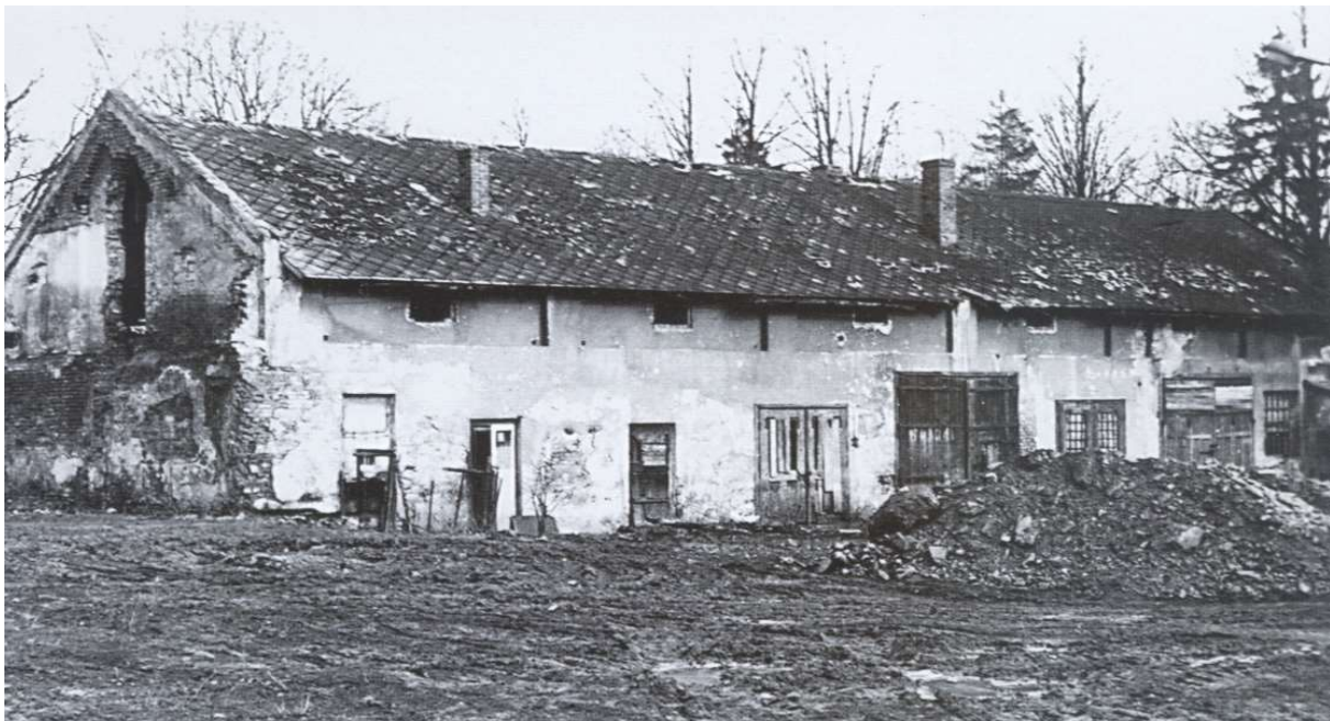
Ilustracja 2: Ruiny zabudowań gospodarczych w posiadłościach Habsburga. Obecnie teren poczty i okolice Domu Sportowca.