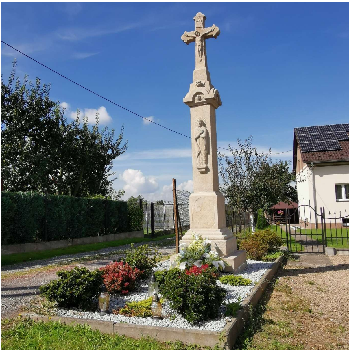
Krzyż kamienny połowa XIX w. przy ul. Witosa 173 w Bestwinie