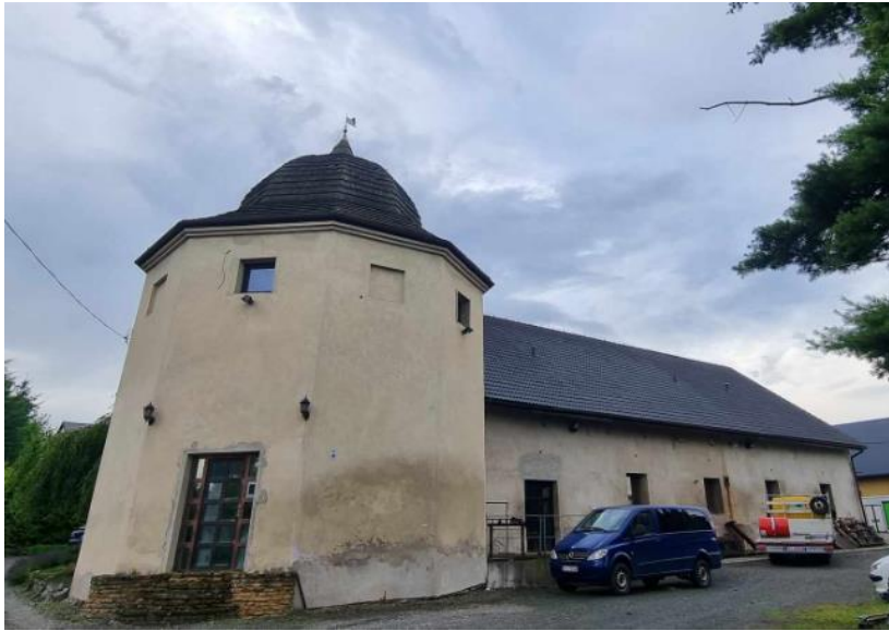
Fotografia 7. Widok na dawną spichlerz rotundę w Dębowcu.

Stan zachowania obiektu dostateczny. Widoczne zawilgocenia przyziemia.