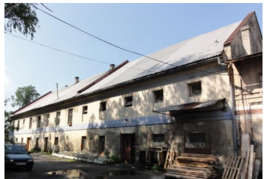
Fotografia 8. Widok na dawną gorzelnie w Simoradzu.

Dawna gorzelnia w Simoradzu to murowany obiekt w zespole folwarcznym. Stan zachowania obiektu – dostateczny. Sugerowana konserwacja elewacji.