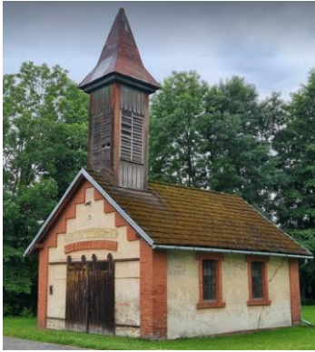
Fotografia 5. Widok na dawną strażnicę OSP w Dębowcu.

Na terenie Gminy Dębowiec przeważa zabudowa mieszkaniowa jednorodzinna i zagrodowa. Zabudowę stanowią przede wszystkim budynki jedno i dwukondygnacyjne o zróżnicowanej geometrii połąci dachowej. Zabudowa mieszkaniowa jednorodzinna występuje przeważnie wzdłuż głównych dróg publicznych oraz w centralnych częściach sołectw, natomiast zabudowa zagrodowa rozproszona jest na całym terenie gminy. Do licznej zabudowy na terenie gminy należy także zwarta zabudowa produkcji rolno – hodowlanej zlokalizowana między innymi w Simoradzu, Dębowcu, Kostkowicach i Ogrodzonej, gdzie występują funkcje usługowe i produkcyjno – usługowe.