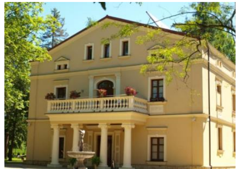
Fotografia 4. Widok na dwór w Dębowcu.

Wśród obiektów dworskich wyróżnia się dwór w Dębowcu. Przed I wojną światową należał do właścicieli dóbr dębowieckich - ostatnim z nich był książę cieszyński Fryderyk Habsburg. Jest to piękny, klasycystyczny dworek ze stylowym portykiem wspartym na kolumnach.