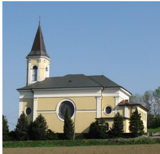
Fotografia 10. Widok na kościół pw. św. Mateusza w Ogrodzonej.

W 1996 r. za księdza proboszcza Pawła Grzędziela przystąpiono do remontu kościoła na zewnątrz (elewacja zewnętrzna i pokrycie blachą miedzianą dachu i wieży kościelnej). Prace zakończono w 1998 r.