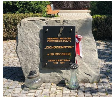
Fotografia 6. Widok na obelisk upamiętniający fakt pierwszego zrzutu „Cichociemnych”.