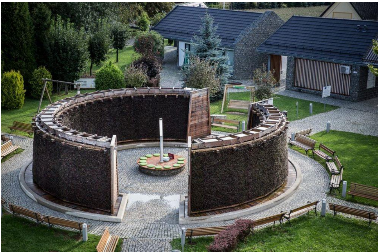
Fotografia 2. Tężnia solankowa w Dębowcu – jedna z głównych atrakcji turystycznych gminy.

Solanka z Dębowca posiada jedną z najwyższych w świecie koncentrację takich minerałów jak: jod, brom, wapń, krzem oraz selen i zaliczona jest Rozporządzeniem Rady Ministrów z lutego 2006 r. (Dz. U. nr 32/2006 poz. 220) do wód leczniczych i termalnych.