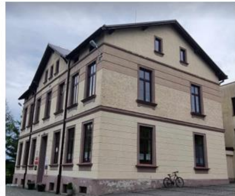
Fotografia 11. Widok na obiekty zabytkowe z Gminnej Ewidencji Zabytków stanowiące własność gminy – szkoła w Dębowcu (od lewej) i szkoła w Ogrodzonej (od prawej).

Stan techniczny wszystkich obiektów stanowiących własność gminy określić można jako dobry.