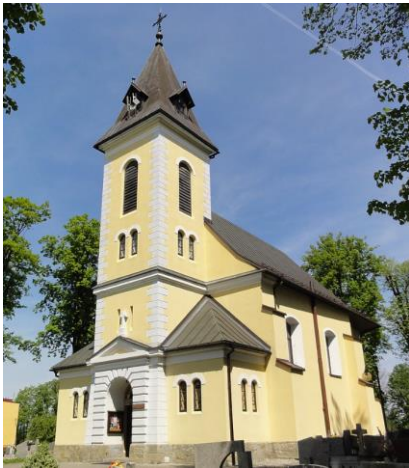
Fotografia 9. Widok na kościół pw. św. Jakuba w Simoradzu.

Według informacji dostępnych na stronie internetowej Parafii św. Jakuba Ap. w Simoradzu, pierwotna świątynia wzniesiona została prawdopodobnie w XIII wieku. Tak, jak obecnie była murowana i posiadała osobną dzwonnice. Obecna, murowana świątynia została wzniesiona ok. XV wieku. W 1842 r. została rozbudowana, a następnie kilkakrotnie remontowana w XX wieku.