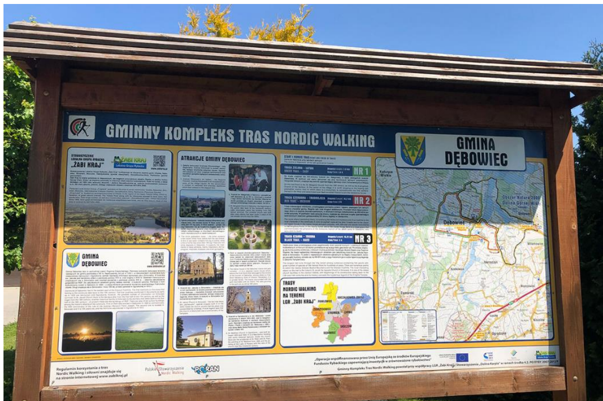
Fotografia 1. Mapa gminy Dębowiec z oznaczeniem szlaków nordic walking.

Gmina Dębowiec położona jest na trasie pieszych i rowerowych szlaków turystycznych.