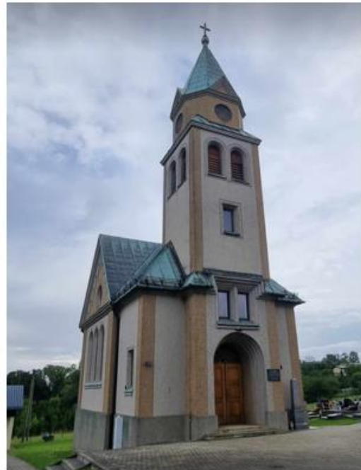
Fotografia 3. Kościoły ewangelickie w Dębowcu (od lewej) i Simoradzu (od prawej).

W krajobrazie gminy Dębowiec odnaleźć można pozostałości dawnych folwarków i zespołów dworskich (m.in. w miejscowościach Ogrodzona, Dębowiec, Simoradz, Kostkowice). Do obecnych czasów pozostały głównie obiekty gospodarcze, charakteryzujące się złym stan technicznym.