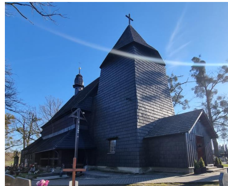
Fotografia 3. Widok na Kościół parafialny pw. Św. Katarzyny Aleksandryjskiej w Sierakowicach.