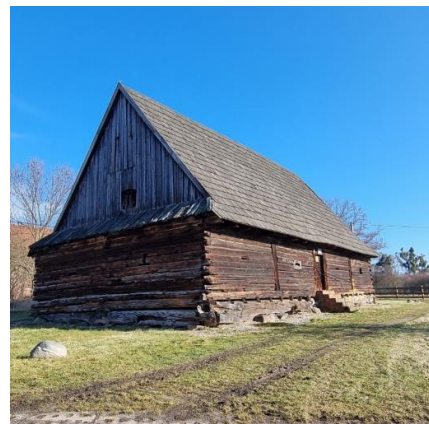
Fotografia 8. Widok na spichlerz drewniany w Rachowicach.

Jest to obiekt wolnostojący, drewniany, wzniesiony w konstrukcji mieszanej, tj. sumikowo-łątkowej w ścianach podłużnych oraz zrębowej w ścianach szczytowych, z podwaliną na peckach. Charakteryzuje się typową, prostopadłościenną, jednopiętrową bryłą zwieńczoną wysokim, krytym gontem dachem