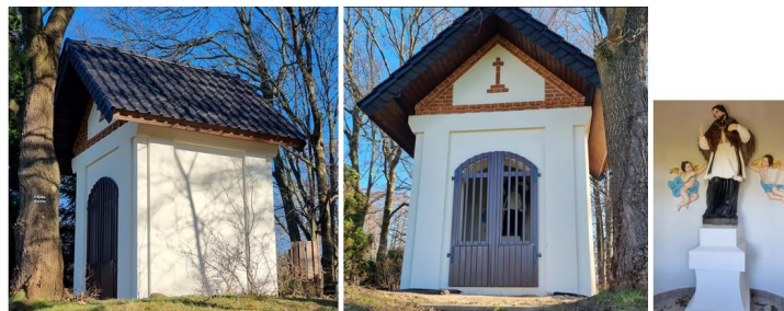
Fotografia 7. Widok na kapliczkę św. Jana Nepomucena w Łanach Wielkich.

Kapliczka jest objęta ochroną poprzez wpis do rejestru zabytków. W ostatnich latach przeprowadzono renowację kapliczki. Stan techniczny – bardzo dobry.