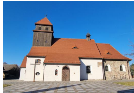
Fotografia 2. Widok na kościół pw. Św. Mikołaja w Kozłowie.