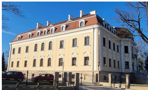
Fotografia 1. Widok na pałac w Sośnicowicach.

Budynek późnobarokowy, z dekoracją w stylu regencji i wczesnego rokoka. Wzniesiony na rzucie litery C, dwukondygnacyjny, wysoko podpiwniczony nakryty mansardowymi dachami z rzędami lukarn. Na osi elewacji frontowej korpusu prostokątny ryzalit o zaoblonych narożach, poprzedzony tarasem z dwoma przeciwległymi biegami wachlarzowych schodów - całość ujęta balustradą z mурowanych tralek. Elewacje rozczłonkowane pilastrami jońskimi w porządku wielkim, z podziałami ramowymi i płycinowymi. podziałami ramowymi. W elewacjach frontowych partia piwnic wydzielona wyładowanym gzymsem cokołowym. Otwory okienne – prostokątne i zamknięte łukiem koszowym ramowane ornamentem regencyjnym rozbudowanym w nadprożach, na parterze zwieńczonych łukowymi odcinkami gzymsu. W dekoracji motywy listew, konsoli, muszli i kampanulli. Na cokole jednego z pilastrów od strony dziedzińca kamienna tablica z nazwiskami budowniczych Andres Stephan i Andres Wagner, 1755 r. W wnętrzu: sala balowa o