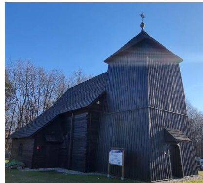
Fotografia 4. Widok na kościół pw. Św. Bartłomieja w Smolnicy.

Kościół zbudowany w latach 1776-1777, XVIII w., odnawiany w latach 1905-1906 oraz 1937-1938. Kościół jest świątynią salową, na rzucie prostokąta, z węższą od nawy, trójboczną apsydą, umiejscowioną po stronie wschodniej. Nawa nakryta jest dachem dwuspadowym, nad apsydą znajduje się dach trójspadowy. Od strony północnej usytuowana została