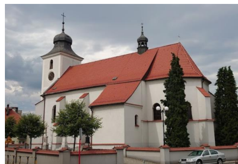
Fotografia 6. Widok na kościół pw. Św. Jakuba w Sośnicowicach.