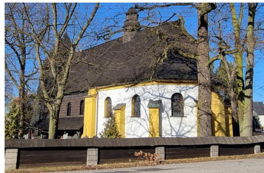
Fotografia 5. Widok na kościół pw. Trójcy Świętej w Rachowicach.

Kościół św. Jakuba Starszego w Sośnicowicach to budowla pochodząca z połowy XIV wieku, która w wyniku późniejszych przebudów uzyskała w dużym stopniu charakter barokowy. W latach 1555-1679 ten parafialny kościół przejęty został przez protestantów, sprowadzonych na te tereny i popieranym przez ówczesnych właścicieli Sośnicowic, panów Trach von Brzezine. Potem kościół św. Jakuba Starszego powrócił do rąk katolików. W 1780 roku świątynia strawiona została przez pożar. W latach 1786-94 nastąpiła odbudowa, dokonana z inicjatywy hrabiego