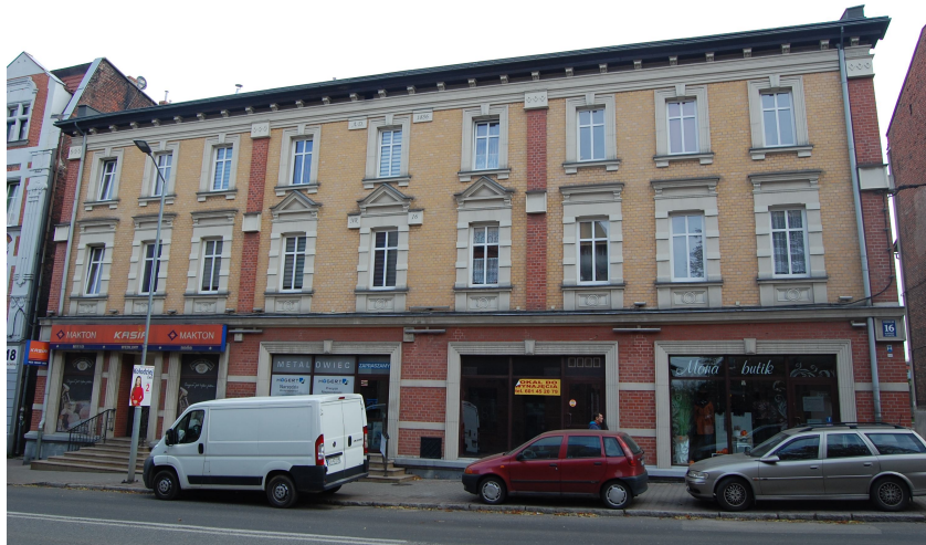
Rys. 6- Kamienica przy ul. Kościelnej 16- Źródło: zdjęcie własne