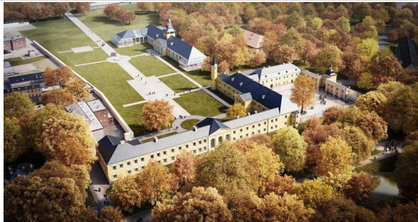
Rys. 2- Projekt rewitalizacji