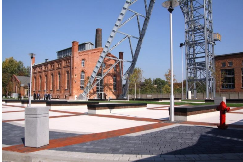
Rys. 1- Park Tradycji

Park Tradycji powstał w 2012 roku w budynku byłej maszynowni szybu Krystyn. Obiekt posiada cztery kondygnacje. W podziemiach zaaranżowano chodnik górniczy. Piętro wyżej znajduje się parowa maszyna wyciągowa z 1905 roku z nawiniętą na olbrzymi bęben stalową liną. Na tym samym poziomie wystawiono kolekcję lamp górniczych oraz makietę pieca kuziennego. Wyeksponowano tam również Obraz św. Barbary przeniesiony z Kopalni Siemianowice oraz mundury górnicze. Na dwu najwyższych piętrach znajduje się sala widowiskowa. Obok budynku dawnej maszynowni zlokalizowana jest wieża wyciągowa szybu Krystyn o wysokości 56 m.