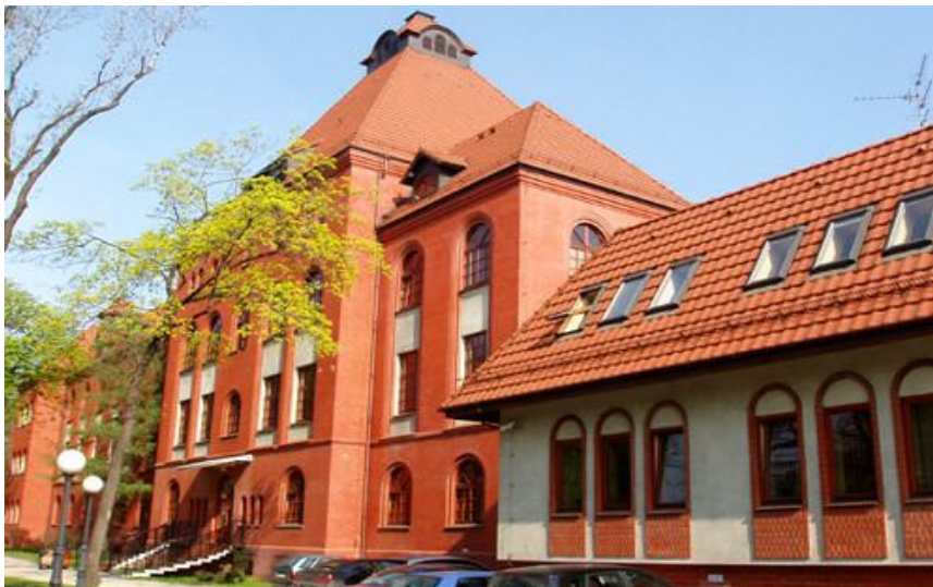
Rys. 7- Szpital Spółki Brackiej

Zamiar budowy szpitala powstał w 1866 roku- po wykonaniu planów rozpoczęto budowę pierwszego budynku szpitalnego. Szpital otworzono 1 listopada 1868 roku. Składał się z wielu pawilonów pełniących różne funkcje- początkowo były to dwa budynki, następnie dobudowano mieszkanie dla dozorczy (1874), murowany barak (1882) oraz salę operacyjną (1902). Do 1909 roku dobudowano jeszcze wiele pawilonów i budynków na terenie szpitala. W 1984 roku szpital wykwaterowano. Budynek długo stał pusty i nieużytkowany aż nie kupił go prywatny inwestor, który przez wiele lat nie interesował się obiektem, następnie część obiektów rozebrał. Pod koniec lat 80 XX wieku podjęto decyzję o umieszczeniu Centrum Leczenia Oparzeń w jednym z budynków. Został on wyremontowany, wymieniono okna, wyczyszczono elewacje, dobudowano izbę przyjęć oraz nowe wejście do budynku. Budynek został wpisany do rejestru zabytków w 1995 roku.