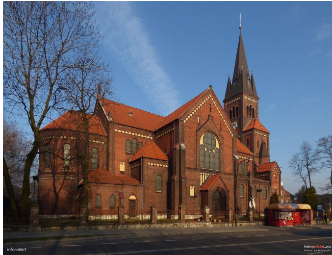
Rys. 4- Kościół p. w. św. Michała Archaniola- Źródło- fotopolska.eu