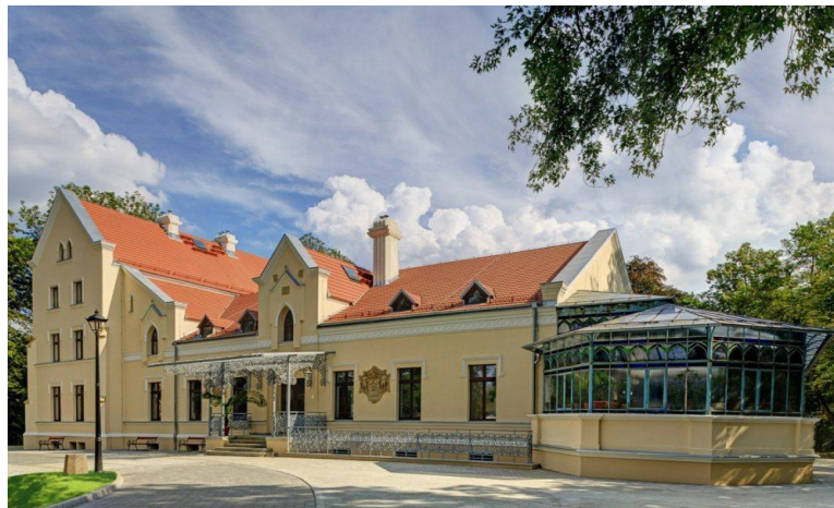
Rys. 3- Pałac Rheinbabenów

Pałac Rheinbabenów pochodzi z 1870 roku. Zaprojektowany w stylu neogotyckim. W 1907 roku obiekt przebudowano i dodano oranżerię. Po II wojnie światowej właścicielem pałacu stała się Kopalnia Węgla Kamiennego Michał, a od 2009 roku budynek należy do gminy Siemianowice Śląskie. Od 2016 roku „Zameczek” stał się oddziałem Siemianowickiego Centrum Kultury. Pałac jest otoczony przez park Górnik, w którym znajduje się również neogotycki dom leśniczego i ogrodnika. Od 2017 roku w obiekcie prowadzone są prace związane z rewitalizacją obiektu. W pierwszym etapie odnowiono elewację, wymieniono pokrycie dachowe oraz stolarkę okienną. Obecnie trwa drugi etap rewitalizacji- prace obejmują modernizację wnętrza budynku, rewitalizację oranżerii i potrwać do końca 2020 roku.