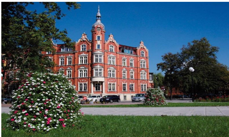
Rys. 5- Ratusz- Źródło: siemianowice.pl

Ratusz został zbudowany w 1904 roku. Budowany był od razu z przeznaczeniem na siedzibę władz gminy. Ratusz to budynek symetryczny, narożny, w stylu eklektycznym z elementami neorenesansu i neobaroku. W partii cokołu ściany pokryte są boniowaniem wykonanym w tynku. Budynek posiada cztery kondygnacje z poddaszem użytkowym, podpiwniczony. Okna prostokątne, w zwieńczeniach zamknięte łukiem odcinkowym. W narożu półkolisty wykusz, który przejął formę wieżyczki.