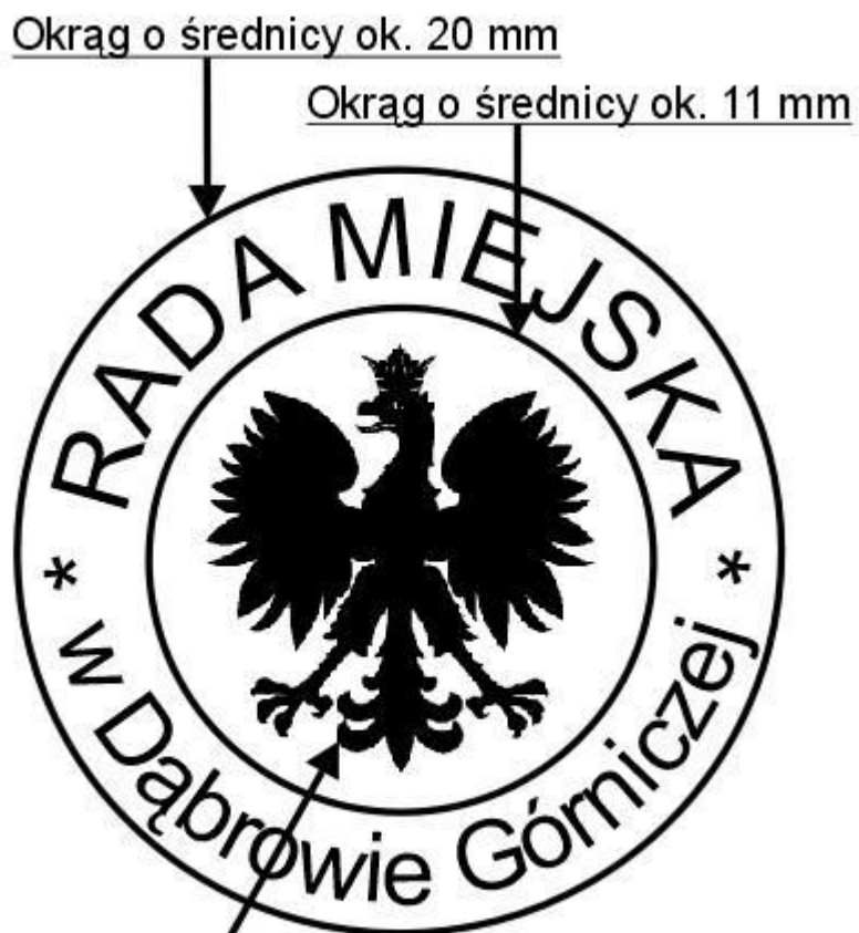
Orzeł zgodny z godłem Rzeczypospolitej Polskiej