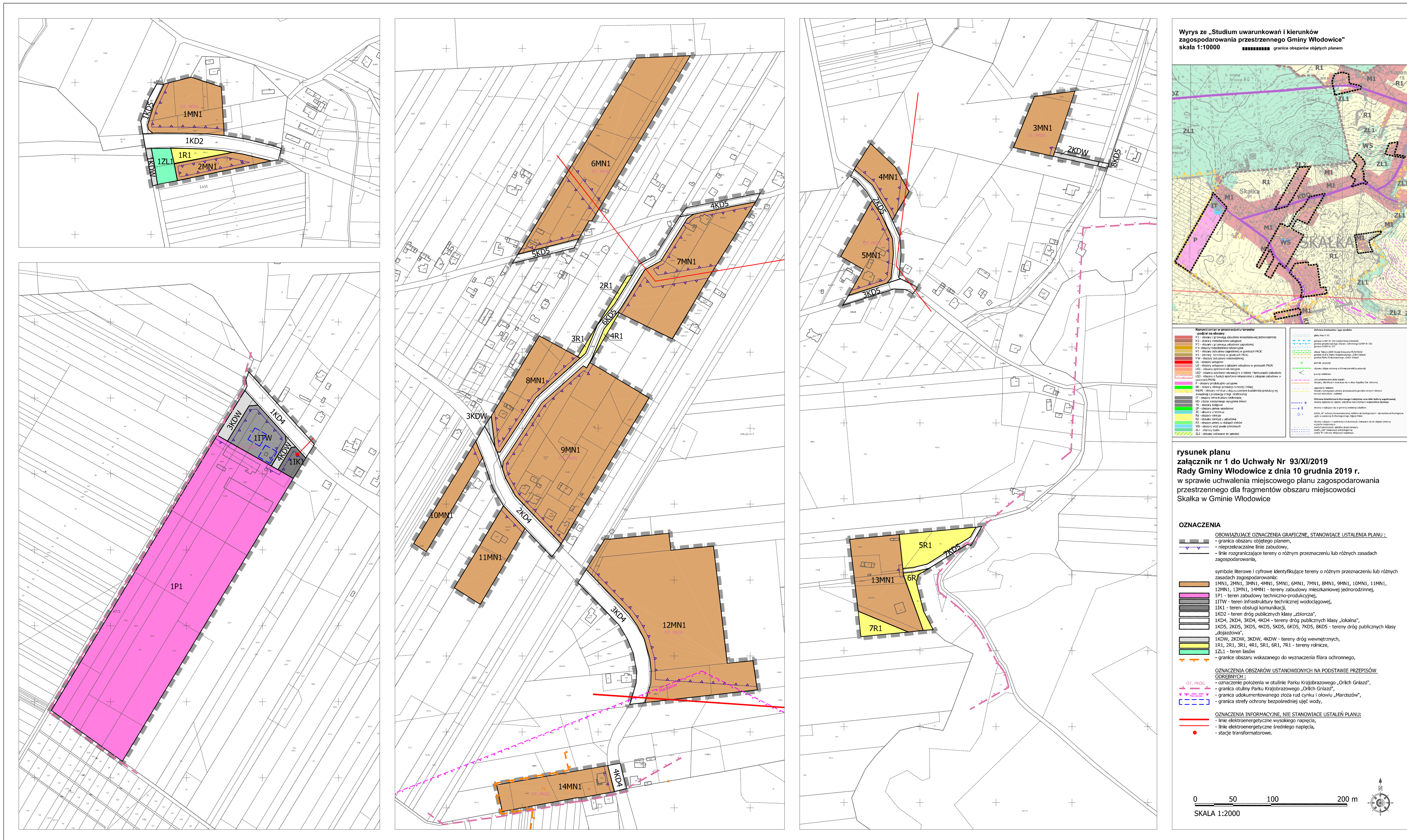
Wyrzute „Studium uwarunkowań i kierunków zagospodarowania przestrzennego Gminy Wodowice” skala 1:10000