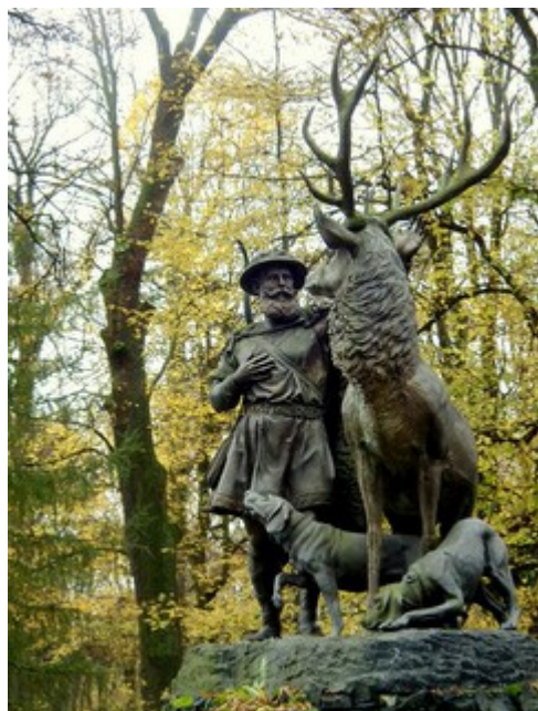
8. Rzeźba św. Huberta przed zameczkiem w Promnicach