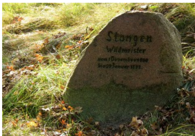
5. Pomnik leśniczego Stangena z ok. 1889 r.