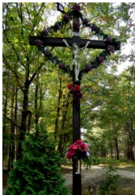
2. Krzyż przydrożny z 1887 r.