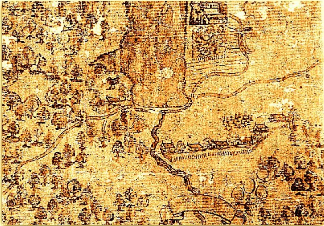
1. Fragment mapy z 1636 r. z zaznaczonym Kobiórem