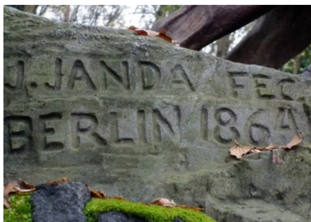
9. Sygnatura na cokole powyższej rzeźby