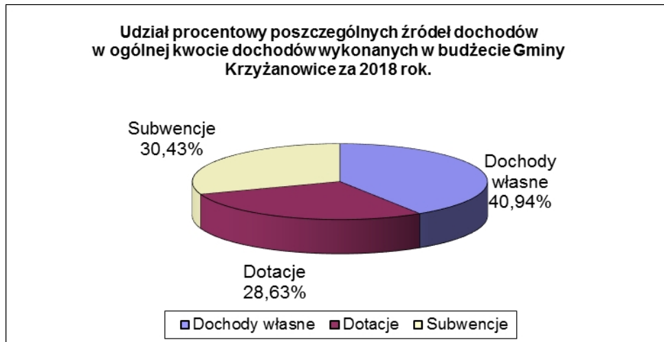
Plan i wykonanie dochodów budżetu Gminy Krzyżanowice za 2018 rok.

Procentowy udział poszczególnych źródeł dochodów przedstawia poniższy wykres