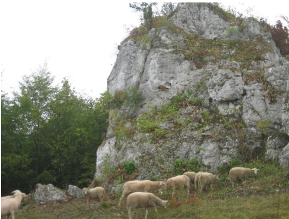
fot. Wypas na Jurze Krakowsko- Częstochowskiej.

- Koszenie ekosystemów nieleśnych – „zabieg stabilizujący i utrzymujący zbiorowiska łąkowe, traworoślowe i ziołoroślowe. Stosowane systematycznie nie dopuszcza do rozwoju drzew, krzewów, kształtuje specyficzny skład gatunkowy i obniża potencjał troficzny środowiska. Zabieg koszenia jest również stosowany w celu przywrócenia żywej postaci zbiorowiskom zdegradowanym wskutek zaniechania użytkowania przez właścicieli prywatnych.” 3