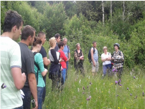
fot. Warsztaty promujące zawód bacy i juhasa (2014 r.).

W wyniku przeprowadzonych szkoleń i warsztatów w 2014 r. zakończonych egzaminem państwowym, kwalifikację w zawodzie bacy mistrz uzyskały dwie osoby, bacy czeladnik- osiemnaście osób, w tym dwie kobiety, juhas- cztery osoby, w tym dwie kobiety. Mając na uwadze fakt, że 40% uczestników projektu jest poniżej 30 roku życia, jest szansa, że zawód bacy i juhasa nie zaniknie tak szybko.