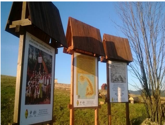
fot. Tablice informacyjne w Beskidach

Program przewiduje także budowę infrastruktury turystycznej tj. miejsc odpoczynku dla turystów, ścieżek, zagród i warsztatów edukacyjnych, punktów widokowych, itp.