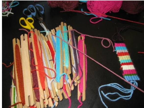
fot. Możliwości wykorzystania wełny owczej.