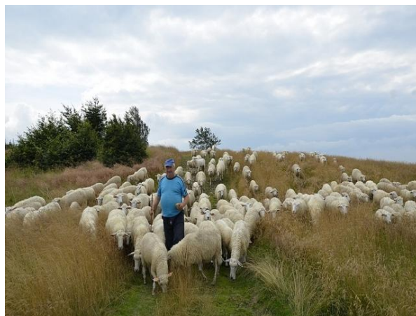
fot. Wypasające się owce.

Należy także podkreślić, że znaczący efekt społeczno- kulturowy dla kultury Jury Krakowsko-Częstochowskiej miała zainicjowana w ramach Programu i realizowana od 2009 roku impreza „Jurajskie Regionalia”. W Beskidach natomiast, do roku 2007 organizowane były: Redyk w Korbielowie i Łossod w Węgierskiej Górcie. Realizacja Programu Owca Plus stworzyła między innymi możliwość powrotu tradycji pasterskich, takich jak: „Mieszanie owiec na Stecówce”, Strzyżenie Owiec, Muzyka na Sałaszu, które na stałe wpisały się w kalendarz wydarzeń kulturalnych.