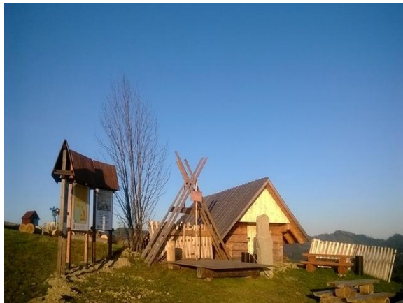
fot. Infrastruktura turystyczna w Beskidach