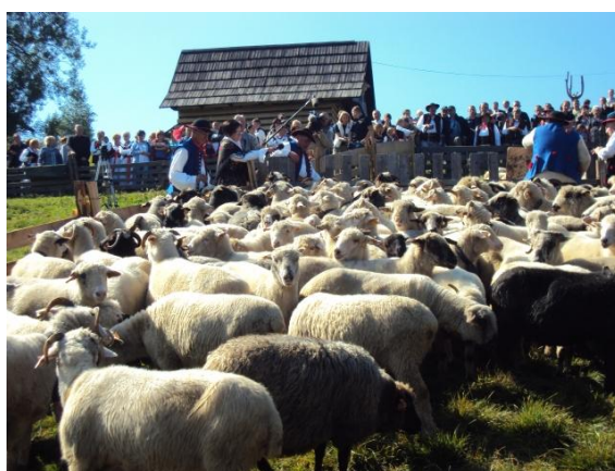
Liczenie jesienne.