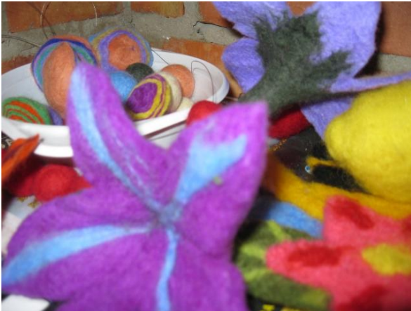
fot. Możliwości wykorzystania wełny owczej.