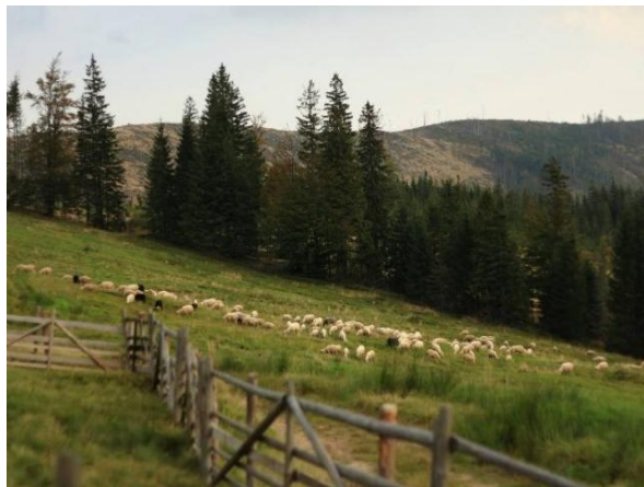
fot. Wypas w Beskidach.

- Odkrzaczanie – „intensywnie postępująca sukcesja drzew i krzewów na tereny nieleśne powoduje ich zarastanie i zmniejszanie przez to różnorodności biologicznej. (...) Zabieg odkrzaczania kształtuje strefę ekotonalną z lasem w formie przejściowych pasów o stopniowo przerzedzanym zwarcie drzew i krzewów, a także różnicuje i wzbogaca skład gatunkowy poprzez tworzenie układów mozaikowych”. 4