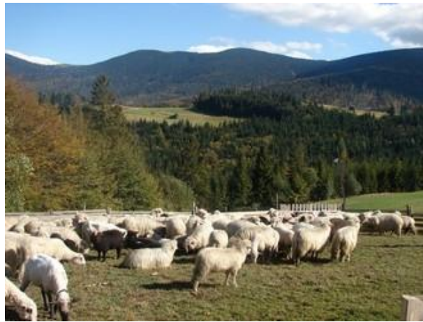
fot. Owce w koszorze.

Dynamicznie rozwijający się rynek produktów regionalnych daje dużą szansę na utrzymanie i rozwój hodowli zwierzęcej. Trzeba jednak wiedzieć, że niska opłacalność hodowli owiec oraz duże jej rozdrobnienie w województwie śląskim, wymusza na producentach szukania nowych rozwiązań poprawiających opłacalność tej hodowli. Jednym z nich jest organizowanie się hodowców w grupy producenckie. Pojedynczy producent nie ma możliwości uzyskania wysokiej ceny za swoje produkty. Natomiast grupa, zrzeszająca w swoich szeregach wielu producentów produktów pochodzenia owczego może wynegocjować z odbiorcą o wiele wyższe ceny niż pojedynczy producent. Relacja popyt- podaż w produktach pochodzenia owczego i koziego uzależniona jest między innymi od stopnia kultywowania tradycji regionalnych, jak również istniejącej mody i znajomości tych produktów przez kupujących. Ich prozdrowotne walory są nie do zakwestionowania. „Ponadto owca, jako jedno z najwcześniej udomowionych zwierząt, z bogactwem tradycji, duchowej i materialnej spuścizny jest ważnym ogniwem w budowaniu regionalizmu, który w Unii Europejskiej ma tak duże znaczenie.” 6