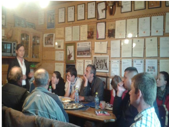
fot. Warsztaty promujące zawód bacy i juhasa (2014 r.).