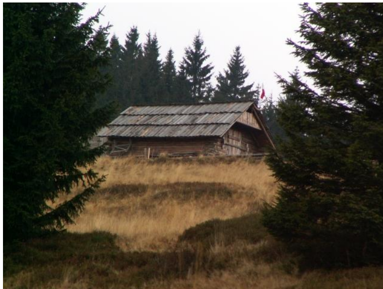
fot. Bacówka na Hali Rycerzowej.

W Beskidach, w ramach Programu, wybudowano nowe bacówki i odremontowane stare. Obiekty te usytuowane są w pobliżu szlaków turystycznych, co podnosi atrakcyjność tych terenów oraz umożliwia turystom zakup produktów owczych. Najpiękniejsze bacówki znajdują się m.in. na Hali Ochodzitej, Muńcole, Rycerzowej oraz Hali Boraczej.