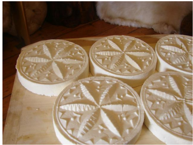
fot. Sery owcze.