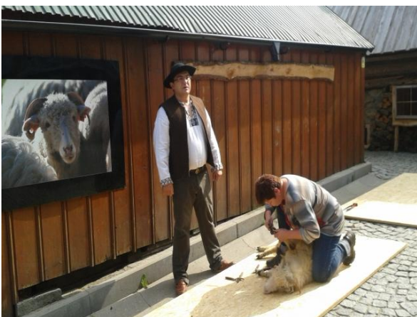
fot. warsztaty promujące zawód bacy i juhasa (2014 r.).