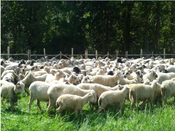
fot. Wypasające się owce.