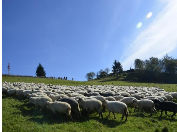
fot. Wypasające się owce.