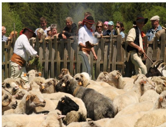
fot. Redyk. Mieszanie owiec.