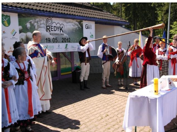
fot. Otwarcie Redyku.