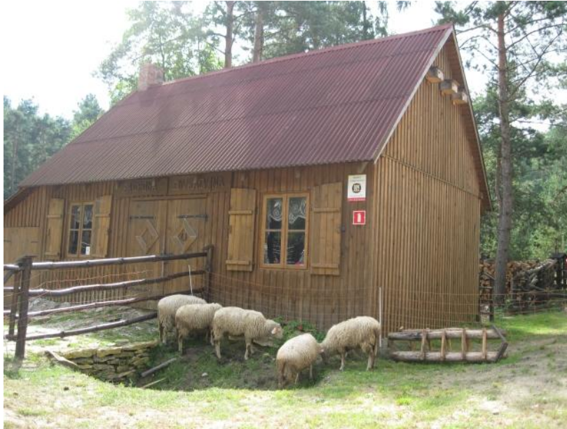
fol. Zagroda Edukacyjna na Jurze Krakowsko- Częstochowskiej.

Na większości hal, na których był prowadzony wypas postawiono koszory i rozstawiono tradycyjne wodopoje, z których korzystają nie tylko owce, ale również dzika zwierzyna.