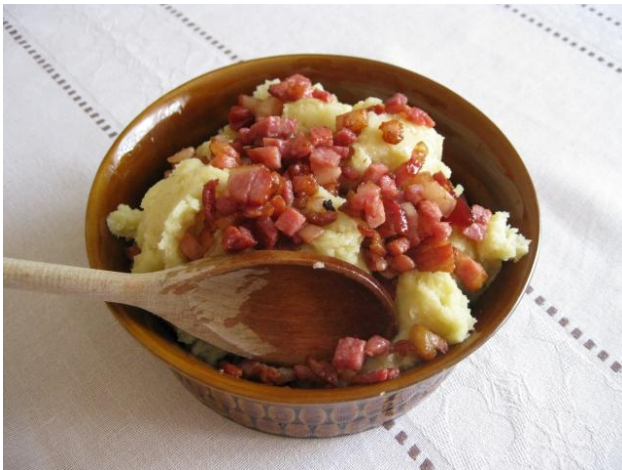
fot. Kluchy połom bite.