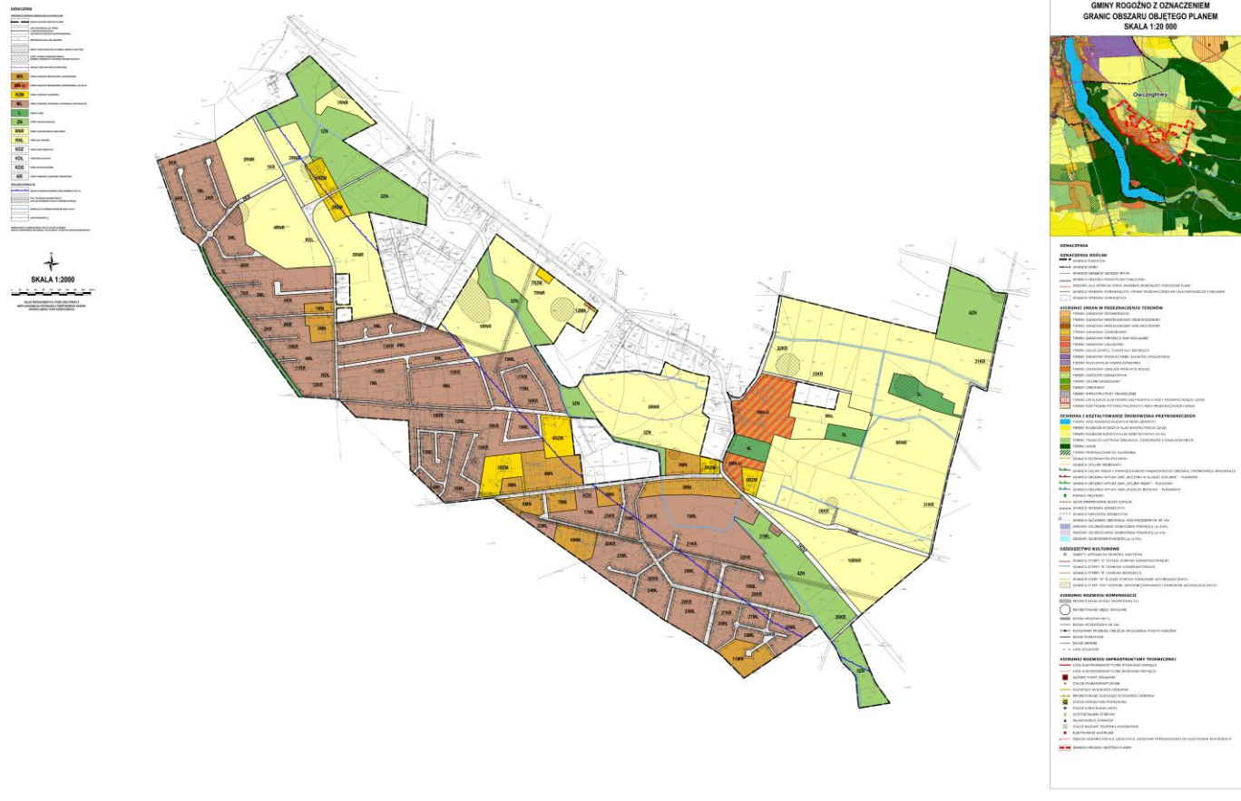
WYRYS ZE STUDIUM UWARUNKOWAŃ I KIERUNKÓW ZAGOSPODAROWANIA PRZESTRZENNEGO GMINY ROGOŹNO Z OZNACZENIEM GRANIC OBSZARU OBJĘTEGO PLANEM SKALA 1:20 000

ZALĄCZNIK NR 1 DO UCHWAŁY NR XCII/1010/2024 RADY MIEJSKIEJ W ROGOŹNIE Z DNIA 25 MARCA 2024 R.