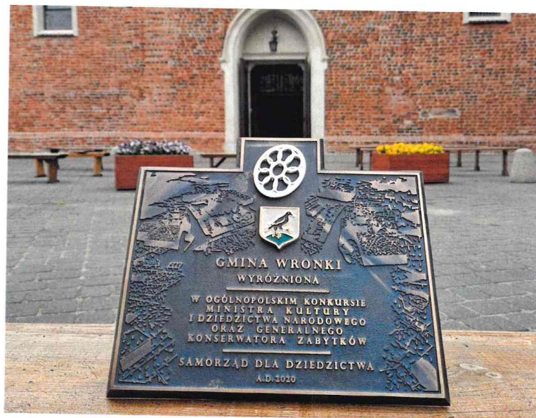
Ryc. 1 Nagroda za wyróżnienie w konkursie „Samorząd dla Dziedzictwa” autor: UMiG Wronki (2022)