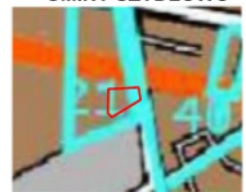
skala 1:10 000