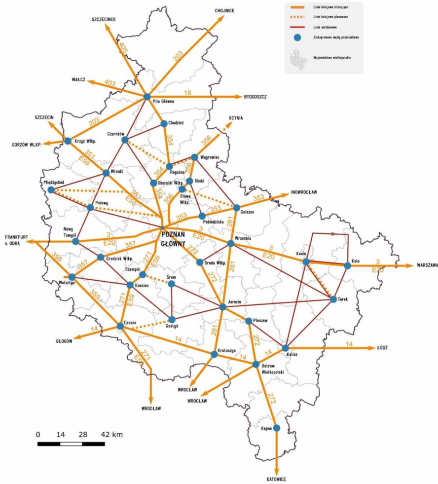
Rys. 4. Sieć komunikacyjna w województwie wielkopolskim dla przewozów o charakterze użyteczności publicznej