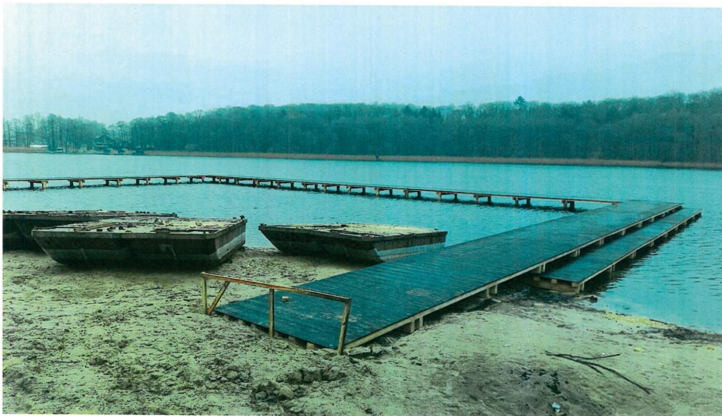
PLAZA UL. JEZIORNĄ - GRUDZIEŃ 2023