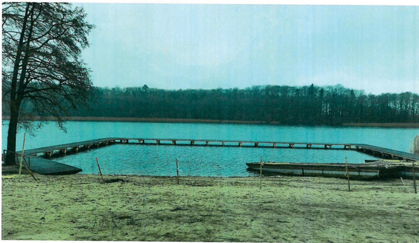
PLAZA UL. JEZIORNA - GRUDZIEŃ 2023

Załącznik Nr2 do uchwały NR LXXVI.507.2024 Rady Miejskiej w Złotowie z dnia 24 kwietnia 2024 r.