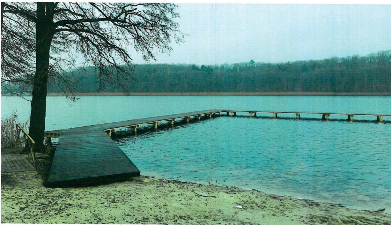
PLAZA UL. JEZIORNĄ - GRUDZIEŃ 2023