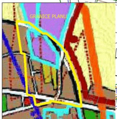
WYRYS ZE STUDIUM UWARUNKOWAŃ I KIERUNKÓW ZAGOSPODAROWANIA PRZESTRZENNEGO GMINY SZYDŁOWO

cały obszar planu znajduje się w zasięgu złoża wód podziemnych - głównego zbiornika wód podziemnych nr 125 "Pila - Wałcz" linie rozgraniczające teren 8KKK stanowią zarazem (w granicach planu) granice terenu zamkniętego (PKP)