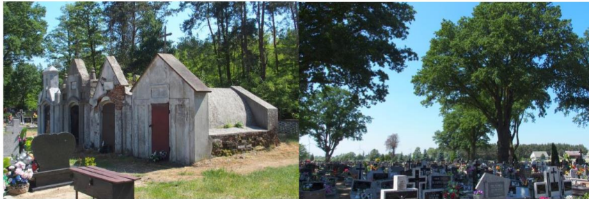
Zdjęcia nr 8, 9. Szymanowice, cmentarz parafialny

Cmentarz zlokalizowany przy drodze z Szymanowic do Leszczycy. Założony w 1 poł. XIX w. W pobliżu kostnicy: symboliczna mogiła powstańców z 1863 r., symboliczny grób ofiar II wojny światowej, cztery stare grobowce, grób Stanisława Janowskiego i dwóch nieznanymi osobom zamordowanych przez hitlerowców w 1939 r. Wśród starodrzewu – pomnikowe dęby.