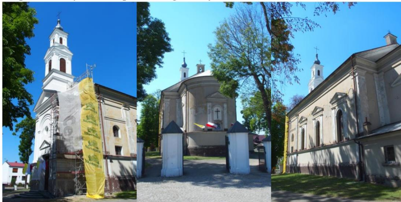
Zdjęcia nr 10, 11, 12. Szymanowice, kościół pw. Św. Jana Chrzciciela

Zespół sakralny kościoła parafialnego w Szymanowicach: kościół pw. Św. Jana Chrzciciela wraz z cmentarzem przykościelnym oraz plebania, murowana, 2 poł. XIX w. Cmentarz otoczony ogrodzeniem, od pld. przylega doń ogrodzenie plebanii. Kościół eklektyczny, wzniesiony w latach 1881-1882 na miejscu dawnego, konsekrowany w 1890 r. Polichromia nawy z 1956 r., remont i malowanie elewacji – w 1977 r., malowanie wnętrza w latach 90. XX w., po 2002 r. – wymiana podłogi drewnianej na posadzkę z płytek,