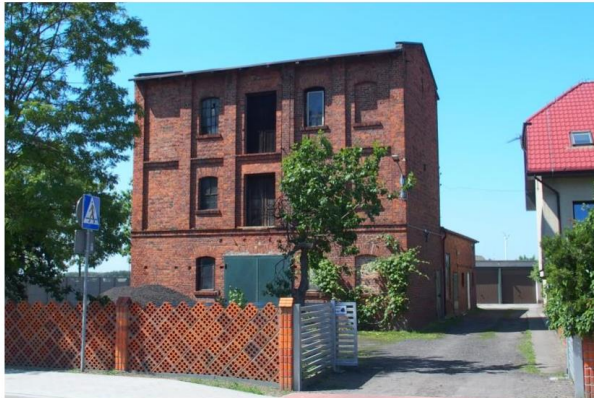
Zdjęcie nr 18. Czochochów nr 11, młyn