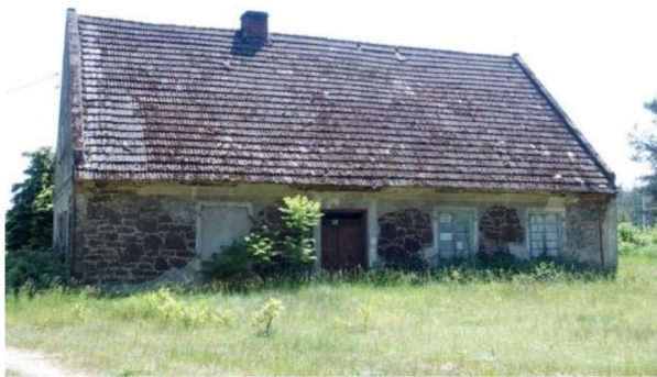
Zdjęcie nr 15. Orlina Duża nr 15

Ewangelicki dom modlitwy i szkoła w Orlinie Dużej (nr 15), wzniesiony przed 1841 r., otynkowany w latach 50. XX w. Zbudowany z rudy darniowej, na rzucie prostokąta, czteroosiowa z niesymetrycznie rozmieszczonym wejściem. Mieścił też mieszkanie pastora - obecnie prywatne. 6 Zachowana sala modlitw.