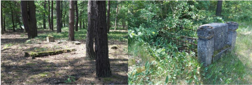
Zdjęcia nr 6, 7. Białobłoty, cmentarz ewangelicko - augsburski

Cmentarz założony ok. 1770 r., przy drodze z Grodzca do Gizalek. Zdewastowany, zachowało się sporo nagrobków – z okresu międzywojennego; najstarszy znaleziony – z 1906 r. Obok znajduje się budynek dawnej szkoły i kantoratu, obecnie przebudowany, mieszkalny. 5