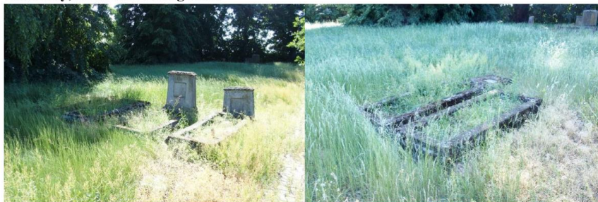
Zdjęcia nr 3, 4. Wierzchy, cmentarz ewangelicki

Cmentarz założony przed 1781 r., zlokalizowany przy głównej drodze wiejskiej. W 2004 r. uporządkowany i przekształcony w park. Nagrobki betonowe z okresu międzywojennego. Wśród starodrzewu – lipy.