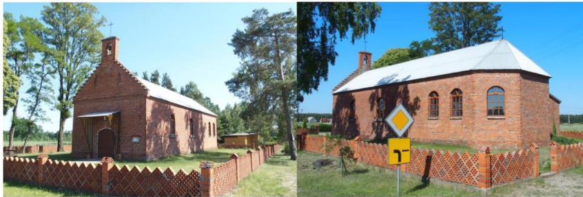
Zdjęcia nr 13, 14. Świerczyna, kościół filialny pw. św. Antoniego Padewskiego

Kościół wzniesiony w latach 1937-1939. Budynek murowany z cegły, na rzucie prostokąta, z prostokątnym aneksem zakrystii, nakryty dwuspadowym dachem, w fasadzie osłoniętym schodkowym ukształtowanym szczytem zwieńczonym ażurową sygnaturką z dzwonem z 1947 r. Remontowany w 1970 r.