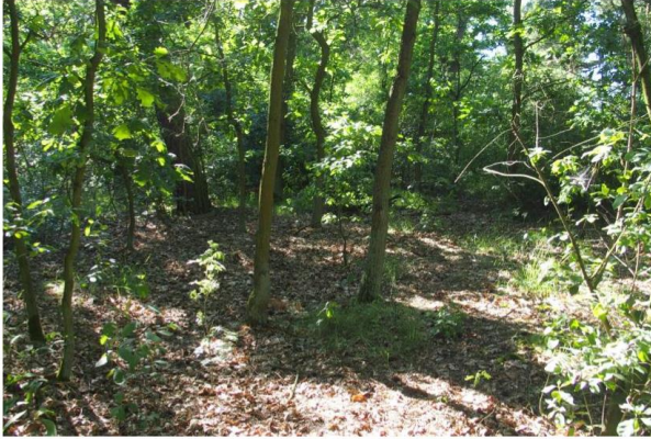
Zdjęcie nr 5. Kolonia Obory, cmentarz ewangelicki

Cmentarz założony w 1783 r. – miejsce pocmentarne. Na obecność cmentarza wskazuje nietypowa roślinność, np. konwalie. Obok znajduje się dom modlitwy, ob. przebudowany dom mieszkalny. 4