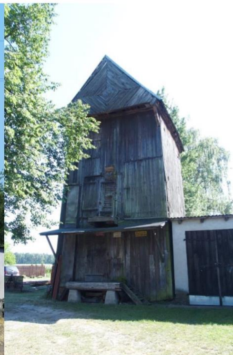
Zdjęcie nr 17. Wronów, wiatrak