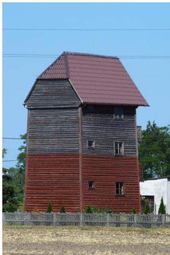
Zdjęcie nr 16. Leszczyca, ul. Wąska, wiatrak

Z zachowanych zabytków techniki wymienić należy młyny - wiatraki, choć zachowało się ich niewiele: Wronów – wiatrak z połowy XIX w., przerobiony na elektryczny, Leszczyca – wiatrak, ok. 1850 r., przebudowany w latach 90. XX w. oraz murowany młyn w Czolnochowie z końca XIX w.