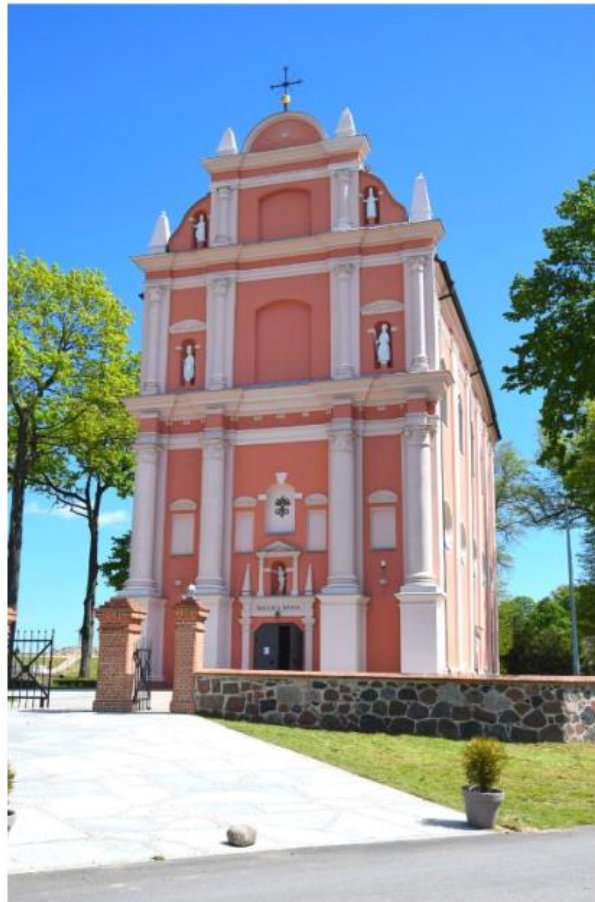
Ryc. 2 Sanktuarium Matki Boskiej w Skrzatuszu

Drugim bardzo interesującym obiektem sakralnym jest drewniany, zrębowy, niewielki kościół fil. pw. św. Jana Chrzciciela w Zawadzie wzniesiony w XVII wieku z fundacji Piotra Naramowskiego starosty ujsko – pilskiego, obiekt posiada zachowane z czasu budowy barokowy ołtarz i ambonę.