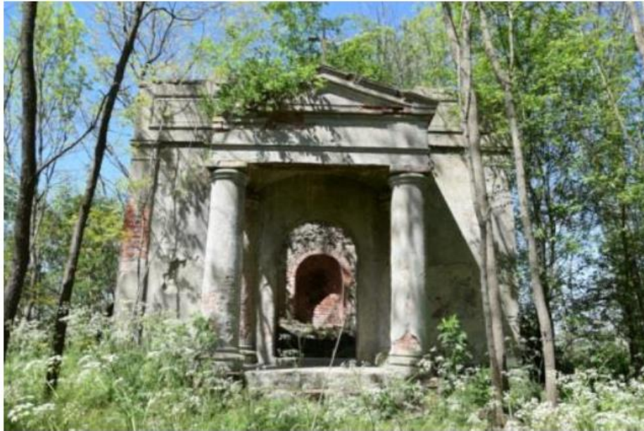
Ryc. 4 Kaplica grobowa rodu Żychlińskich w Klęniku

Zespół dworsko-parkowy w Starej Lubiance znajduje się w coraz lepszym stanie technicznym, w 2014 roku zakończono remont kapitalny dworu. Dwór w Nowym Dworze utrzymywany jest w dostatecznym stanie. Dwory w Kotuniu, Jaraczewie i Skrzatuszu wymagają podjęcia prac remontowych. Uzupełnieniem historycznej architektury są zachowane wokół nich parki.