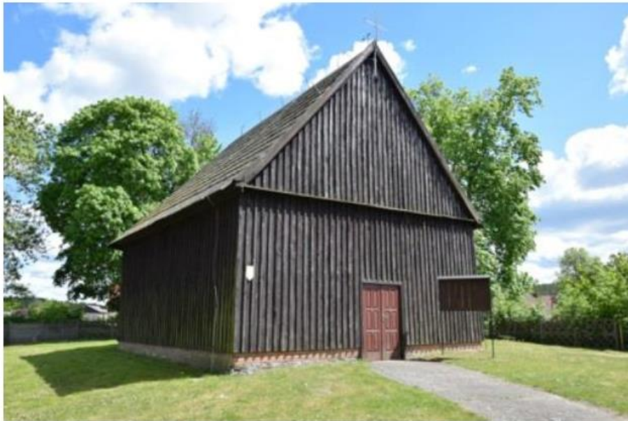
Ryc. 3 Kościół pw. św. Jana Chrzciciela w Zawadzie

katolicki pw. Matki Boskiej Nieustającej Pomocy w Szydłowie oraz kościół par. pw. Podwyższenia Krzyża Św. w Starej Łubiance. Są to świątynie murowane, w większości o ceglanych elewacjach, ich architektura zainspirowana jest popularnymi w tym czasie formami neogotyku i neoromanizmu.