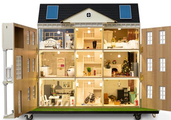
Zdj. Nr 3. Mobilny symulator zagrożeń.

Ważnym elementem jest ściana z naklejkami obrazującymi objawy zatrucia czadem.