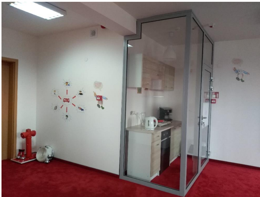
Zdj. Nr 2. Kącik tematyczny w Sali Edukacyjnej „Ognik”.

W pomieszczeniu ukryte są elementy stanowiące potencjalne zagrożenie – jest więc wyrwany ze ściany kontakt, niesprawny czajnik elektryczny, deska do prasowania z wypaloną dziurą, przykryta lampka nocna, zakryta kratka wentylacyjna, źle odłożone zapałki, kominiek przy którym znajduje się zbyt blisko usytuowany kosz na śmieci oraz spalane są plastikowe butelki, świeczka znajdująca się zbyt blisko firanki itp. Dzieci mają możliwość odszukania zagrożeń i doprowadzenia do stanu poprawnego.