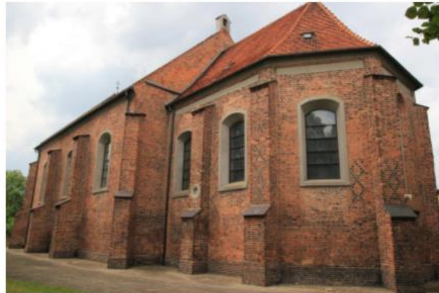
Fot. 1 Kościół pw. Św. Apostołów Piotra i Pawła w Kostrzynie