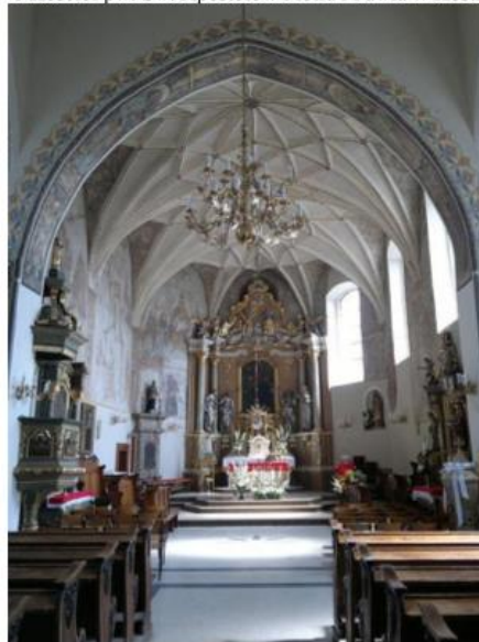
Fot. 2 Wnętrze kościoła farnego w Kostrzynie