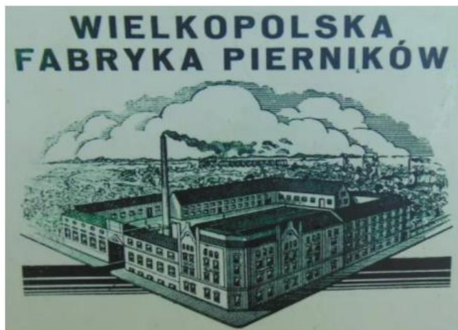
Fot. 3 Rysunek przedstawiający fabrykę pierników i makaronu, I połowa XX w.

W krzewieniu kultury i walki o polskość znaczną rolę odegrały Koło Śpiewackie, Towarzystwo Gimnastyczne „Sokół” oraz Towarzystwo Czytelni Ludowych. W 1906 r. dzieci szkolne strajkowały w obronie języka polskiego. Podczas powstania wielkopolskiego 1918/1919 Kostrzyn zorganizował kompanię oraz pluton powstańczy, które wzięły udział w walkach pod Zbąszynem i Kcynią. W okresie międzywojennym miasto rozwijało się wolno. W czasie okupacji niemieckiej miały tu miejsce liczne aresztowania i egzekucje. 20 października 1939 r. żandarmeria rozstrzelała 28 obywateli Kostrzyna i okolic. Ponad 40 kostrzynian zginęło w więzieniach i obozach, ok. 300 wysiedlono do Generalnej Guberni. Od 1941 r. działała tu komórka tajnej organizacji, która później podporządkowała się Armii Krajowej. W obawie przed nadciągającą ofensywą wojsk radzieckich, które wkroczyły do Kostrzyna 22 stycznia 1945 r. prawie wszyscy Niemcy uciekli z miasta.