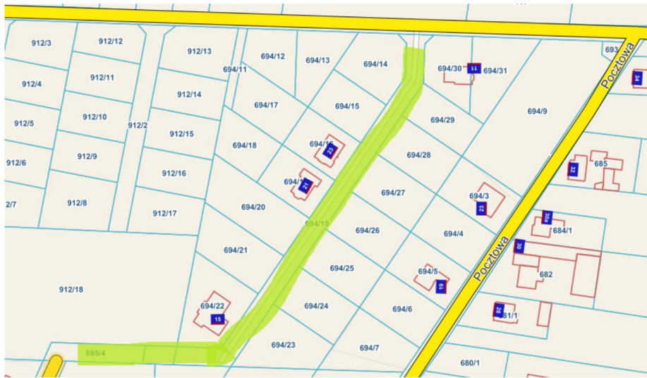
Przedłużenie ul. Spokojnej