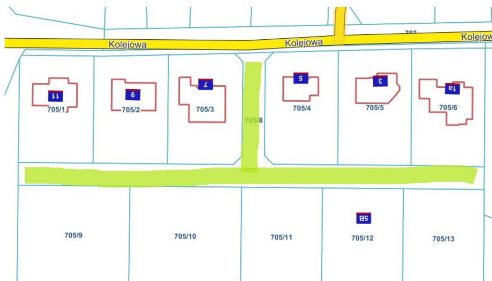
Odnoga ul. Kolejowej