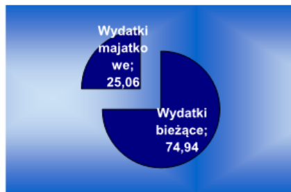
Struktura wydatków Plan