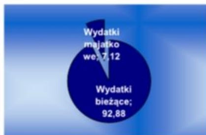
Struktura wydatków Plan