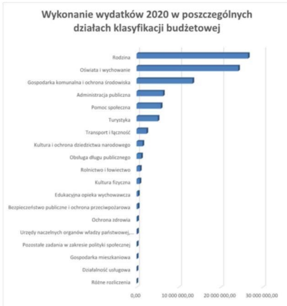
Wykres 4: Wykonanie wydatków w poszczególnych działach klasyfikacji budżetowej

jest poniesienie niższych niż zaplanowane wydatków na działania profilaktyczne w ochronie zdrowia, mniej usług zakupionych w związku z wydawaniem decyzji o warunkach zabudowy, decyzji lokalizacyjnych. Najwięcej wydatków przeznaczono na „Rodzinę” 26.491.332,47 zł, tj. 29,87% wszystkich wydatkowanych środków, „Oświatę i wychowanie” 24.152.593,46 zł, tj. 27,24% wydatków ogółem, „Gospodarkę komunalną i ochronę środowiska” 13.297.362,11 zł, tj. 15,00% wydatków ogółem. Na obsługę długu publicznego, tj. odsetki od zobowiązań z tytułu kredytów, pożyczek i obligacji 1.100.326,67 zł, tj. 1,24% wydatków ogółem.