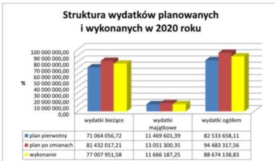
Wykres 3: Struktura planowanych i wykonanych wydatków

Budżet gminy po stronie wydatków został zrealizowany na poziomie 93,85%.