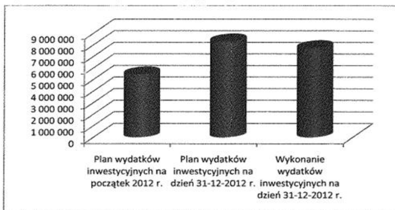
Wykres nr 1. Plan i wydatki inwestycyjne wykonane na dzień 31-12-2012 roku

Szczegółowy podział wydatków inwestycyjnych w ramach działów klasyfikacji budżetowej zawarto w Tabeli nr 1.