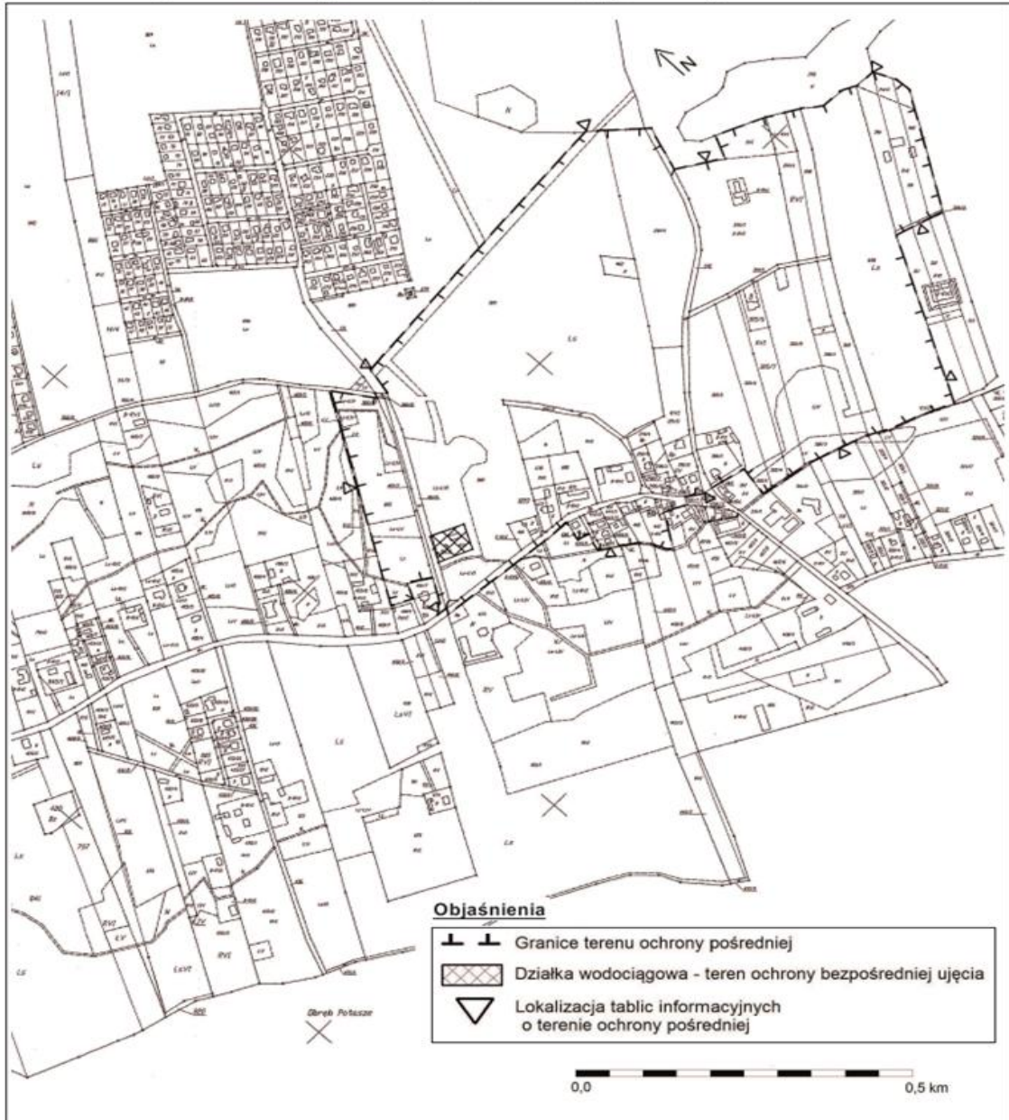
Mapa terenu ochrony pośredniej strefy ochronnej ujęcia w miejscowości Kamińsko