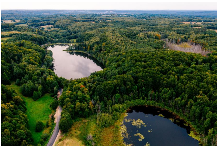
Fotografia 1. Widok na krajobraz gminy Połczyn – Zdrój – tzw. „Szwajcaria Połczyńska”.

Gmina Połczyn-Zdrój wyróżnia się spośród innych Gmin zróżnicowanym krajobrazem, który określany jest „Szwajcarią Połczyńską”. „Szwajcaria Połczyńska” - unikalny przyrodniczo mikroregion rozciągający się na obszarze gmin Połczyn-Zdrój, Złocieniec, Barwice, Czaplunek i gminy wiejskiej Świdwin. Sercem Szwajcarii Połczyńskiej jest Dolina Pięciu Jezior, czyli obszar rezerwatu krajobrazowego pomiędzy Połczynem-Zdrojem a Czaplankiem, który jest jednym z najbardziej malowniczych miejsc na terenie całego Województwa Zachodniopomorskiego. Okolica zawdzięcza nazwę malowniczo otoczeniu wysokich (ponad 200 m) wzgórz morenowych pokrytych pastwiskami i lasami. Znajduje się tam jedno z najwyższych wzniesień zachodniego pomorza – Wola Góra (219,2 m n.p.m.), na której szczycie wzniesiono wieżę obserwacyjną. To również miejsce, gdzie źródło ma rzeka Drawa. Rzeka ma długość 185,9 km. Jej koryto wytycza szlak wodny im. Ks. Kardynała Karola Wojtyły, bowiem przyszły Papież kilkakrotnie spływał Drawą na kajaku. „Szwajcaria” to także szlaki turystyczne, piesze i rowerowe, które wiodąc przez zbocza i doliny z rwącymi strumieniami i jeziorami, tworzą niemalże górski krajobraz. To naturalne otoczenie tworzy wyjątkowy, łagodny mikroklimat, sprzyjający leczeniu wielu chorób.