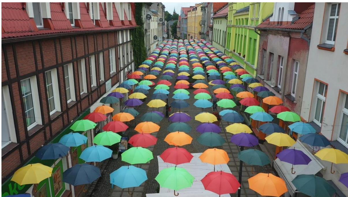
Fotografia 2. Widok na połczyńskie parasolki.

Połczyński deptak, czyli mieszcząca się pod parasolkami urokliwa ulica Grunwaldzka to kolejna atrakcja gminy. To w rzeczywistości jeden z głównych historycznych szlaków handlowych – szlak Solny. Usytuowany jest niemal idealnie na osi północ-południe. Spacerując po niej, można przyjemnie spędzić czas robiąc zakupy, zaopatrując się w pamiątki, czy korzystając z punktów gastronomicznych. Deptak zabudowany jest zabytkowymi kamieniczkami. Urodę ulicy nadaje brukowana nawierzchnia i „londyńskie” latarnie, które przywołują klimat przełomu XIX i XX wieku. Pod ulicą znajduje się jedno z najciekawszych znalezisk historycznych. Podczas prac ziemnych w 1997 roku na głębokości ok. 1,5 m odnaleziona została warstwa okrągłych belek drewnianych ułożonych równolegle w poprzek ulicy. To dawna nawierzchnia z okresu XIII-XIV wieku. Tędy prowadził ówczesny tranzyt karawan kupieckich wiozących sól z kołobrzeskich warzelnii w kierunku południowym, na trakt do zamku Draheim i dalej w stronę Wielkopolski.