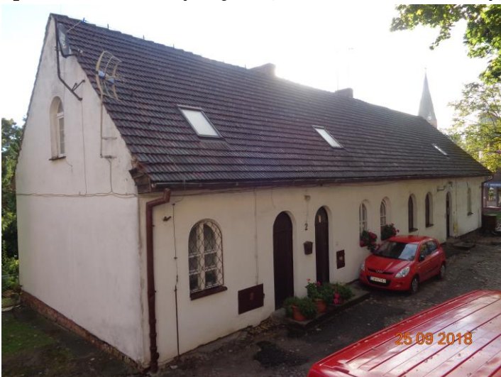
Zdjęcie nr 10. Spichlerz (nazwa zwyczajowa), obecnie dom mieszkalny, ul. Kilińszczaków 57

Budynek wzniesiony w 1860 r., jako mieszkanie szkolnego woźnego kolegium jezuickiego i stajnia. W końcu XIX w. przebudowany: powiększono część mieszkalną, a stajnię w północno-zachodniej części – przekształcono w pomieszczenie gospodarcze; remontowany na przełomie lat 60. i 70. XX w.