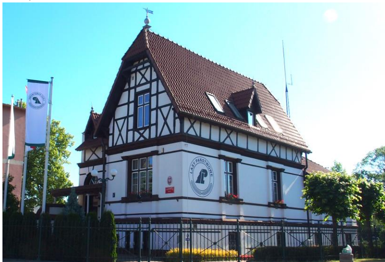
Zdjęcie nr 25. Budynek Nadleśnictwa, ul. Kołobrzaska 1a

Budynek o znacznie rozcłonkowanej bryle, wysoko podpiwniczony, jednokondygnacyjny, w części podwyższony o kondygnację wysokiego poddasza, nakryty dachami naczółkowymi, rozcłonkowanymi lukarnami pod daszkami dwuspadowymi. Ściany murowane, tynkowane, poddasze w konstrukcji ryglowej z tynkowanym wypełnieniem. W elewacji frontowej – taras konturowany balustradą tralkową, osłonięty dachem wspartym na kolumnkach.