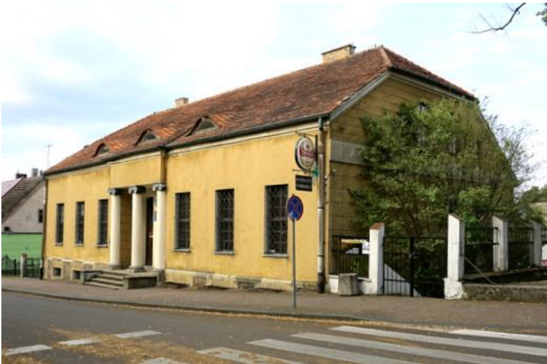
Zdjęcie nr 6. Dwór, obecnie Muzeum Ziemi Wałeckiej, ul. Pocztowa 14

Budynek pochodzi z końca XVIII w., klasycyzm. Podpiwniczony, parterowy budynek nakryty naczółkowym dachem, rozcłonkowanym oknami powiekowymi. Na osi fasady prostokątna wnęka, osłonięta prostokątnym portykiem kolumnowym – kolumny jońskie.