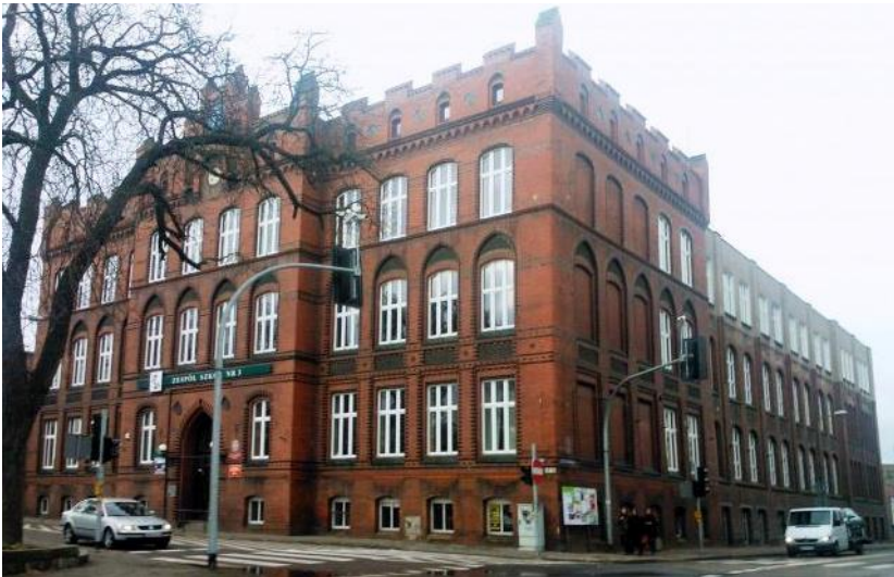
Zdjęcie nr 14. Szkoła Budowlana, obecnie Zespół Szkół nr 3 - „Zawodówka”, ul Bankowa 13, źródło: http://wikimapia.org/22076040/pl/Zesp%C3%B3lC5%82-Szk%C3%B3lC5%82-nr-3

Neogotycki parterowy budynek, wzniesiony jako ujeżdżalnia koni pułku ułanów w 1870 r., adaptowany do funkcji szkoły w 1885 r. (obecnie główne skrzydło od ul. Bankowej) i rozbudowany w 1904 r. (skrzydło od ul. gen. Leopolda Okulickiego) – wówczas budynek uzyskał obecną formę. Otwarcie szkoły miało miejsce we wrześniu 1877 r. W 1998 r. na skwerze przed szkołą, w 80-tą rocznicę niepodległości, ustawiono pomnik Marszałka Józefa Piłsudskiego.