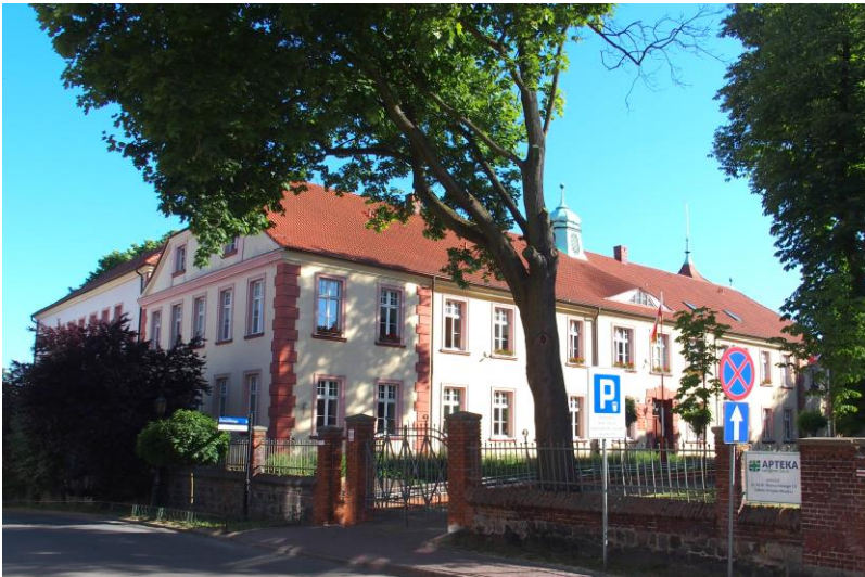
Zdjęcie nr 9. Kolegium Jezuickie („Ateny Waleckie”), obecnie Zespół Szkół Nr 1, ul. Kilińszczaków 59

Budynek wzniesiony na miejscu starszego w latach 1798-1805 w skromnym stylu klasycystycznym, przebudowany w 2 poł. XIX w., przez kolejne remonty częściowo pozbawiony pierwotnego wystroju architektonicznego. Okres największej świetności instytucji przypada na przełom XVII/XVIII w., kiedy uczyło się tutaj około 200 uczniów, a ze względu na wysoki poziom nauczania kolegium wybierała nawet protestancka młodzież z ościennej Brandenburgii. W 1781 r. przekształcone w gimnazjum królewskie. W lipcu 1945 r. w budynku otworzono gimnazjum i liceum polskie. Od 1977 r. mieści się tutaj również Szkoła Mistrzostwa Sportowego.