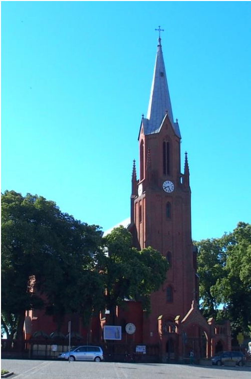
Zdjęcie nr 1. Kościół parafialny pw. św. Mikołaja, Plac Wolności

Kościół wzniesiony w latach 1863-1865, neogotycki. Parafia erygowana w 1303 r. i ponownie w 1602 r. Pierwszy kościół spłonął w 1378 r. Jak wyglądał kolejny budynek nie wiadomo.