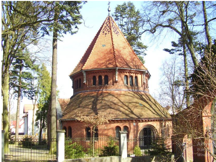
Zdjęcie nr 4. Ewangelicka kaplica cmentarna, obecnie cerkiew prawosławna pw. Świętej Trójcy, ul. Kujawska, źródło: https://pl.wikipedia.org/wiki/Cerkiew_%C5%9Awi%C4%99tej_Tr%C3%B3jcy_w_Wa%C5%82czu

Ekлекtyczna kaplica wzniesiona w 1876 r., z fundacji Marii von Helke. W 1947 r. przystosowana do funkcji cerkwi.