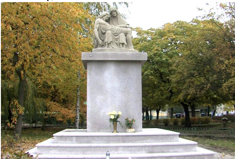
Zdjęcie nr 32. Pomnik Piety, ul. Kościuszki

Początkowo zlokalizowany na skrzyżowaniu ulic Bydgoskiej, Kilińszczaków, Wojska Polskiego i Kościuszki. W 1976 r. z powodu modernizacji dróg przeniesiony między bloki mieszkalne, na początku ul. Kościuszki. Rzeźba z kamienia, umieszczona na prostokątnym cokole. Ufundowana przez katolików niemieckich przed I wojną światową, jako wotum za ocalenie od epidemii, która zagrażała mieszkańcom