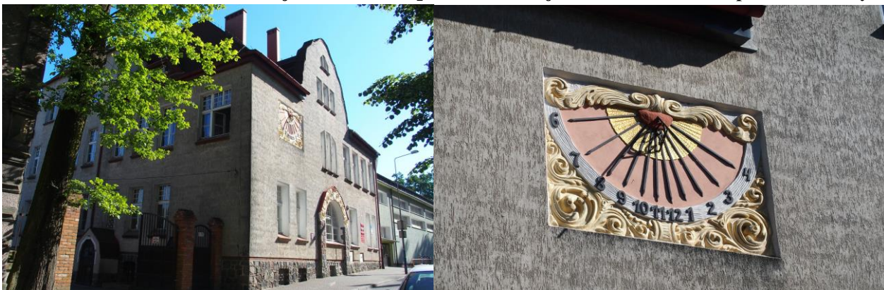
Zdjęcia nr 17, 18. Szkoła Żeńska, dawniej Gimnazjum nr 3, a obecnie w budynku mieszczą się pomieszczenia różnych stowarzyszeń działających na rzecz mieszkańców Wałcza m.in.: Ośrodek Rehabilitacyjno-Edukacyjno-Wychowawczy czy Spółdzielnia Socjalna „Ważka”.

Budynek wzniesiony w ok. 1910 r. Budynek podpiwniczony, dwukondygnacyjny, nakryty czterospadowym dachem z naczółkiem, rozczłonkowanym szczytem o falistym wykroju – w fasadzie i czteroosiową facjatą w połaci bocznej. Murowany, tynkowany, z cokołem licowanym kamieniem i detalem wypracowanym w tynku. Szczyt w fasadzie akcentuje oś pierwotnego wejścia: szeroki, arkadowy otwór, ramowany portalem o faliście wykrojonej archiwolcie ramowanej sztukatorską dekoracją z herbem Wałcza. Nad portalem triforium zamknięte odcinkiem łuku. Otwory okienne prostokątne, osadzone na parapetach. W drugiej kondygnacji zachodniej części fasady – zegar słoneczny z dekoracją z motywami roślinnymi.