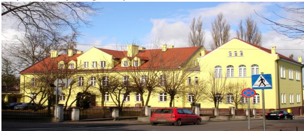
Zdjęcie nr 28. Budynek Sądu Rejonowego, ul. Sądowa 2

Datowany na lata 20. XX w. Budynek murowany, o trzech kondygnacjach naziemnych. Dach budynku wielospadowy kryty dachówką ceramiczną. Otwory okienne zakończone są prostymi i eliptycznymi nadprożami. Stolarka okienna wymieniona na nową z PCV z zachowaniem podziałów. Wejście główne do budynku, usytuowany jest od strony ul. Sądowej, zakończone eliptycznym nadprożem i wstawione w ozdobny portal. Do wejścia głównego prowadzą murowane schody. Budynek zakończony jest szerokimi gzymsami wieńczącymi przy okapach.