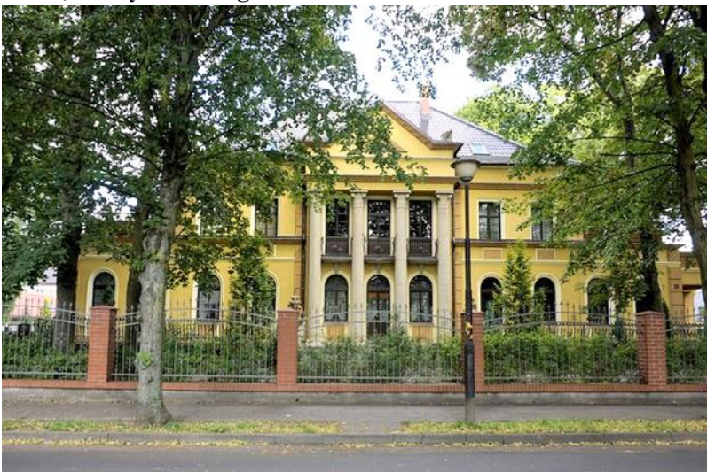
Zdjęcie nr 7. Willa, ul Dąbrowskiego 18