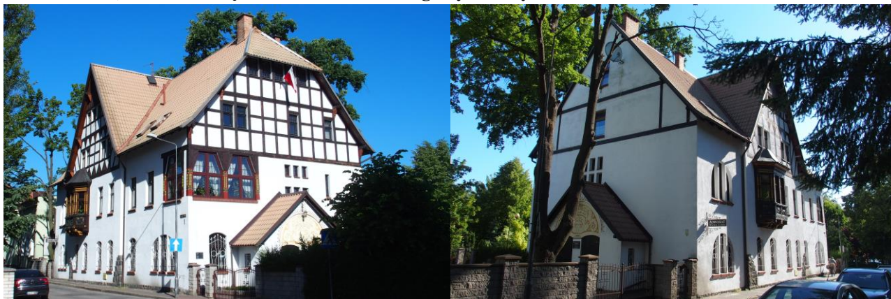
Zdjęcia nr 26, 27. Willa Stelzer, obecnie budynek mieszkalno-usługowy, ul. Sądowa 1

Budynek powstał na przełomie XIX i XX w. Jest to dwukondygnacyjny budynek z użytkowym poddaszem, nakryty naczółkowym dachem, z płytkim ryzalitem zwieńczonym wydatnym trójkątnym szczytem nakrytym dwuspadowo – w elewacji frontowej. Ściany murowane, tynkowane, szczyty – w konstrukcji ryglowej z tynkowanym wypełnieniem. W górnej kondygnacji ryzalitu rozmieszczony niesymetrycznie trójboczny, drewniany wykusz, z rozbudowaną dekoracją snycerską.