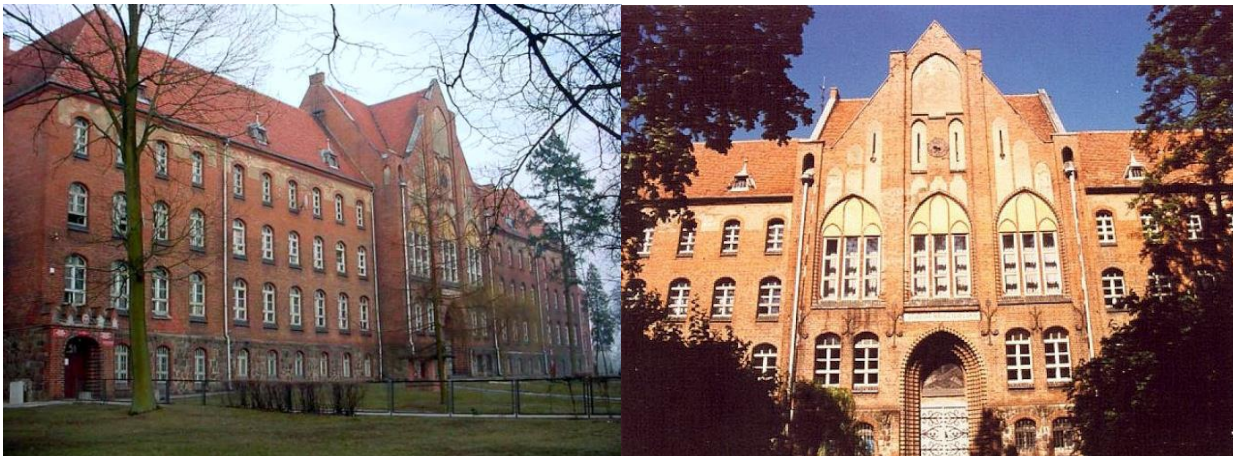
Zdjęcie nr 15, 16. Królewskie seminarium nauczycielskie, obecnie Budynek Oświaty w Zasobie Starostwa Powiatowego, ul. Bydgoska 50-52

Budynek wzniesiony w latach 1902-1905, w stylu eklektycznym z przewagą elementów neogotyckich. Gmach założony na rzucie zbliżonym do litery E, ze skrzydłami bocznymi, o rozczłonkowanej bryle zróżnicowanej wysokościowo, urozmaiconej kształtami dachów. Murowany z cegły na cokole licowanym kamieniem. Otwory okienne rozmieszczone rytmicznie, zamknięte łukiem odcinkowym. We frontowym ryzalicie ostrołuczny, schodkowo profilowany portal, w drugiej kondygnacji – prostokątne triforia osadzone w ostrołucznych blendach o tynkowanych podłuczach, rozdzielone nadwieszonymi lizenami. W budynku występują również ostrołuczne biforia osadzone w ostrołucznych blendach dopełnionych kolistym tondem w podłuczcu oraz zróżnicowane podziały blendowe. We wnętrzu zabytkowa klatka schodowa przykryta sklepieniami krzyżowo-żebrowymi gwiazdzistymi, wspartymi na kolumnach.