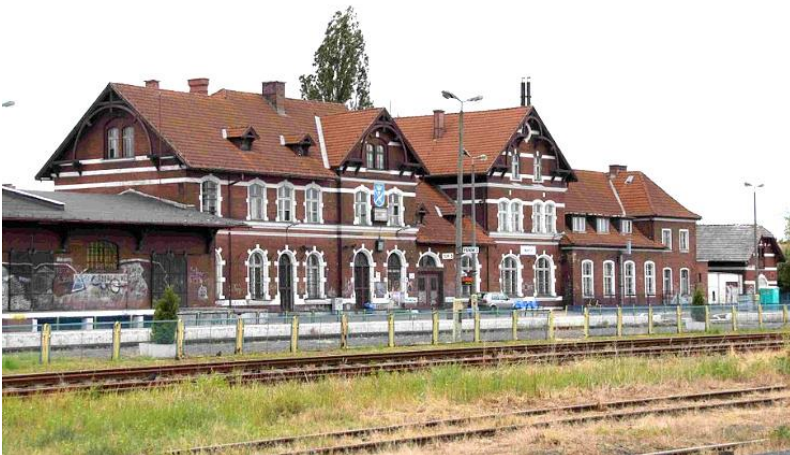
Zdjęcie nr 20. Dworzec PKP, ul. Kolejowa

Budynek oddany do użytku w 1881 r., typowy przykład budownictwa kolejowego z przełomu XIX/XX w.: murowany z cegły, z tynkowanym detalem (gzymsy, fryzy, opaski okien okarągłolucznych i zamkniętych odcinkiem łuku). Malowniczości rozczłonkowanej bryły dodają krążynowe wsporniki podtrzymujące okapy dachów szczytów budynku.