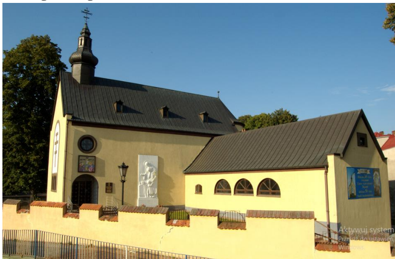
Zdjęcie nr 5. Ewangelicka kaplica szpitalna, obecnie kościół grekokatolicki pw. Podwyższenia Krzyża Pańskiego, ul. 12-go Lutego

Wzniesiony w latach 1923-1924, ekлекtyczny z przewagą elementów neoromańskich. Na ścianie wschodniej kościoła wmurowano płaskorzeźbę z lat 20. XX w. – dla upamiętnienia poległych w czasie I wojny światowej (Chrystus pocieszający młodą kobietę z dzieckiem – wdowę po żołnierzu). Pierwotnie na ścianie budynku umieszczone były też nazwiska poległych na frontach I wojny światowej. Po II wojnie światowej