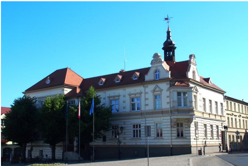
Zdjęcie nr 11. Ratusz, Plac Wolności 1

Zbudowany w latach 1888-1890, według projektu Alberta Schura. W 1937 r. rozbudowano budynek dodając nowe skrzydło. Eklektyczny z elementami neorenesansu i neoklasycyzmu.