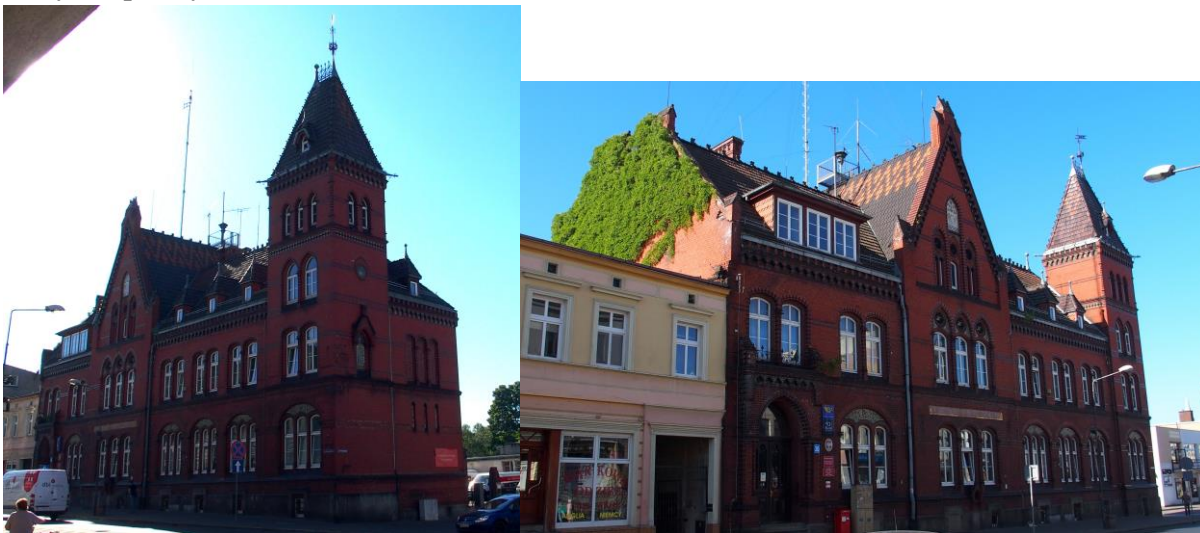
Zdjęcia nr 11, 12. Budynek poczty, ul. Kilińszczaków 30

Budynek wzniesiony w 1895 r., neogotycki. Wysoko podpiwniczony budynek dwukondygnacyjny na rzucie prostokąta, nakryty czterospadowym dachem, o znacznie rozczłonkowanej bryle. W narożu