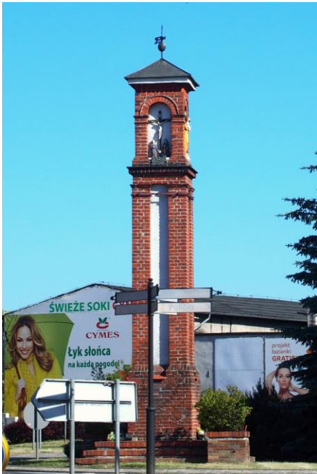
Zdjęcie nr 31. Kapliczka słupowa przy Rondzie Solidarności

Kapliczka pochodzi z XVII/XVIII w., wzmiankowana w 1712 r. Wysoka na rzucie kwadratu, murowana z cegły z białą fugą. W górnej cztery nisze z figurami: a. grupa Ukrzyżowania – Jezus na krzyżu, Matka Boska i Św. Jan, pod nimi mosiężna tablica o renowacji kapliczki: renowacja 1842, z własnych środków Doroty Zubdarg, z domu Tesce, wdowa., b. figurka MB z Dzieciątkiem z XIX/XX w., c. i d. współczesne rzeźby autorstwa Z. Polakowa – Św. Wojciech i św. Maksymilian Kolbe. W zwieńczeniu czterospadowy blaszany daszek z krzyżem i chorągiewką z ażurowym napisem „IHS”.