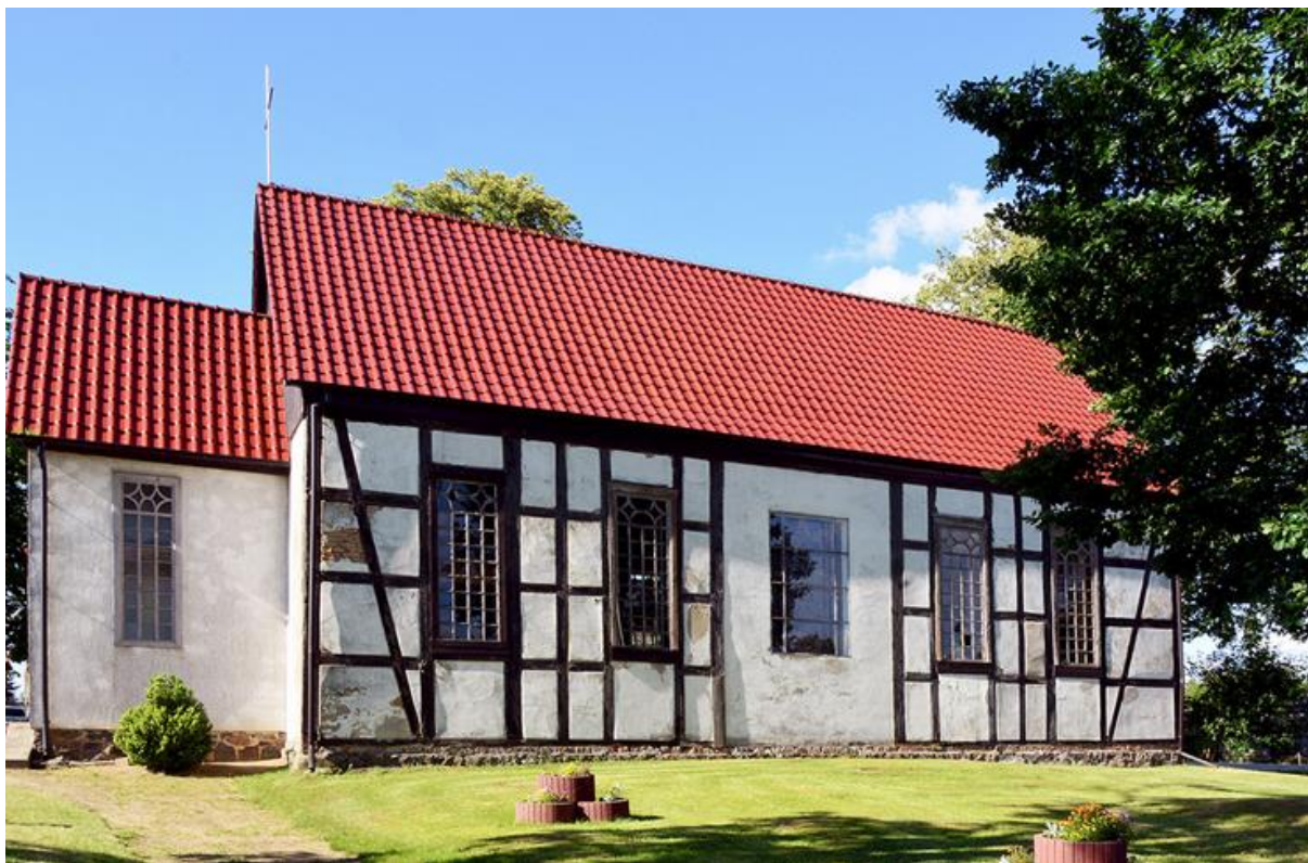
Rysunek 22. Kościół ewangelicki, ob. rzymskokatolicki filialny pw. Matki Boskiej Częstochowskiej z dzwonnicy i przykościelnym cmentarzem w Żółtnicy