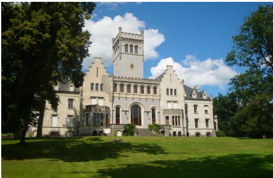
Rysunek 17. Pałac w Trzebiechowie oraz park z aleją dojazdową

Park powstał również w II połowie XIX w. z części lasów dębowo-bukowych, a do drzewostanu wprowadzono wiąz, lipy, kasztanowce, brzozy i świerki. Wytyczona została promenada nad jeziorem i reprezentacyjna aleja dojazdowa wiązowo-bukowa. Utworzone zostały także duże i regularne przestrzenie trawiaste 37 .