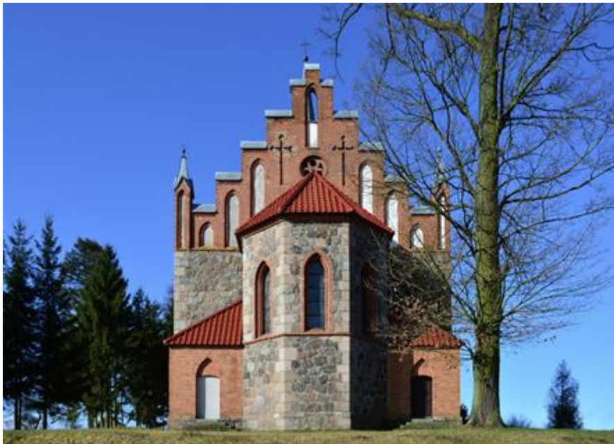
Rysunek 10. Kościół ewangelicki, ob. rzymskokatolicki pw. św. Stanisława Biskupa wraz z otoczeniem w Gwdzie Wielkiej