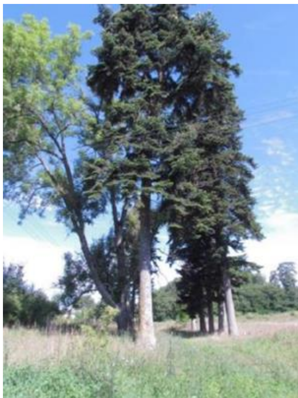
Rysunek 9. Park pałacowy w Grąbczynie (fragment zachowanej alei świerkowej)

Park pałacowy w Grąbczynie powstał w XIX w. na wschodnim krańcu wsi Grąbczyn przy drodze Porost-Wierzchowo. Początkowo teren ten został zaprojektowany w stylu krajobrazowym, jednak w II połowie XIX w. został przekształcony naturalistycznie, o czym świadczą niewielkie ilości zachowanych egzemplarzy drzew obcego pochodzenia oraz pnie pozostałe po wyciętych drzewach 29 .