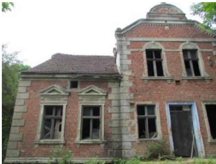
Rysunek 11. Budynek rządcówki w zespole folwarcznym Jadwiżyn

Na zespół folwarczny w miejscowości Jadwiżyn składa się dwór rządcówka oraz park z podwórzem folwarcznym z początku XX w. W 1939 r. Jadwiżyn był miejscowością Oskara Lofflera, obejmującą wtedy obszar 51 ha. Podczas II wojny światowej budynki gospodarcze położone na północnej i południowo-zachodniej stronie folwarku uległy znacznym zniszczeniom. W wyniku tego rozebrano budynki, zachowane zostały jedynie budynek rządcówki oraz ruiny ceglanego budynku gospodarczego położonego na południowej stronie dziedzica folwarcznego. Dawna rządcówka nadal zachowuje swoją pierwotną formę architektoniczną 31 .