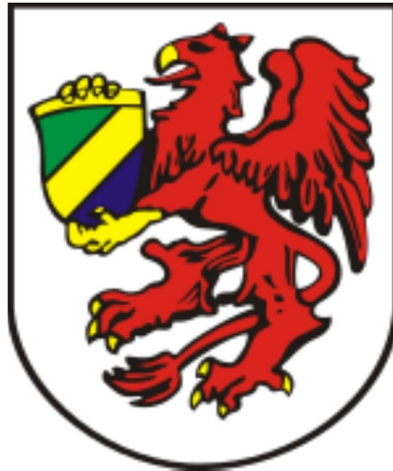
Rysunek 2. Herb Gminy Szczecinek

Zasady używania herbu określa Rada Gminy Szczecinek. Użytkowanie herbu oraz barw Gminy zastrzega się również do wyłącznej dyspozycji Rady, a wykorzystanie ich przez inne podmioty jest możliwe po uzyskaniu zgody Rady Gminy.