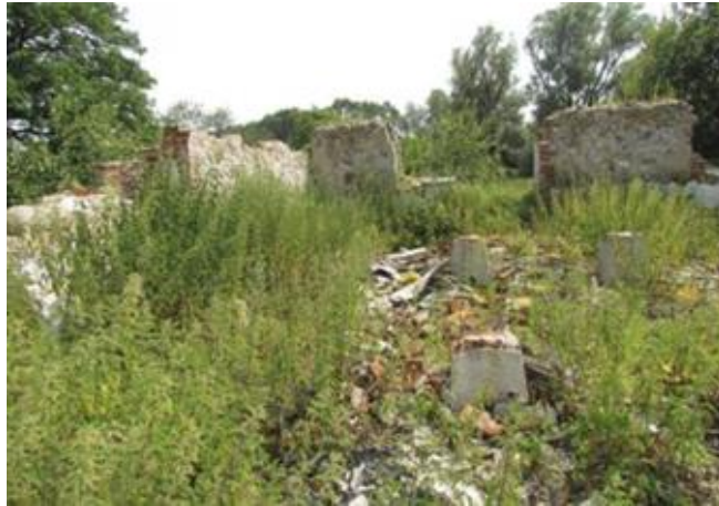
Rysunek 13. Pozostałości zabudowy dworskiej i parku w Parsęcku

zmianami i przekształceniami wewnątrz. Po wojnie budynek był wykorzystywany jako mieszkania służbowe dla pracowników Państwowego Gospodarstwa Rolnego (PGR). Z ówczesnej zabudowy zachowały się ruina, resztki dworu. Tak samo mają się budynki gospodarcze, zostały z nich jedynie pozostałości. Na terenie parku można dostrzec wyraźne ślady dawnego ogrodu użytkowego – sadu. W obrębie tego obszaru zachował się mały owalny staw, a także rosą dwa starodrzewne dęby.