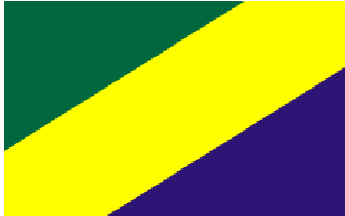
Rysunek 3. Flaga Gminy Szczecinek