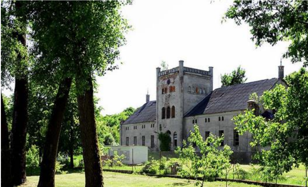
Rysunek 21. Pałac w Wilczych Laskach