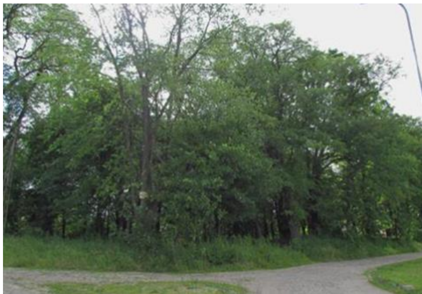
Rysunek 23. Park dworski w Żółtnicy

Park dworski w Żółtnicy to park naturalistyczny z II poł. XIX w. o powierzchni 1,0 ha zlokalizowany we wschodniej części wsi 44 .