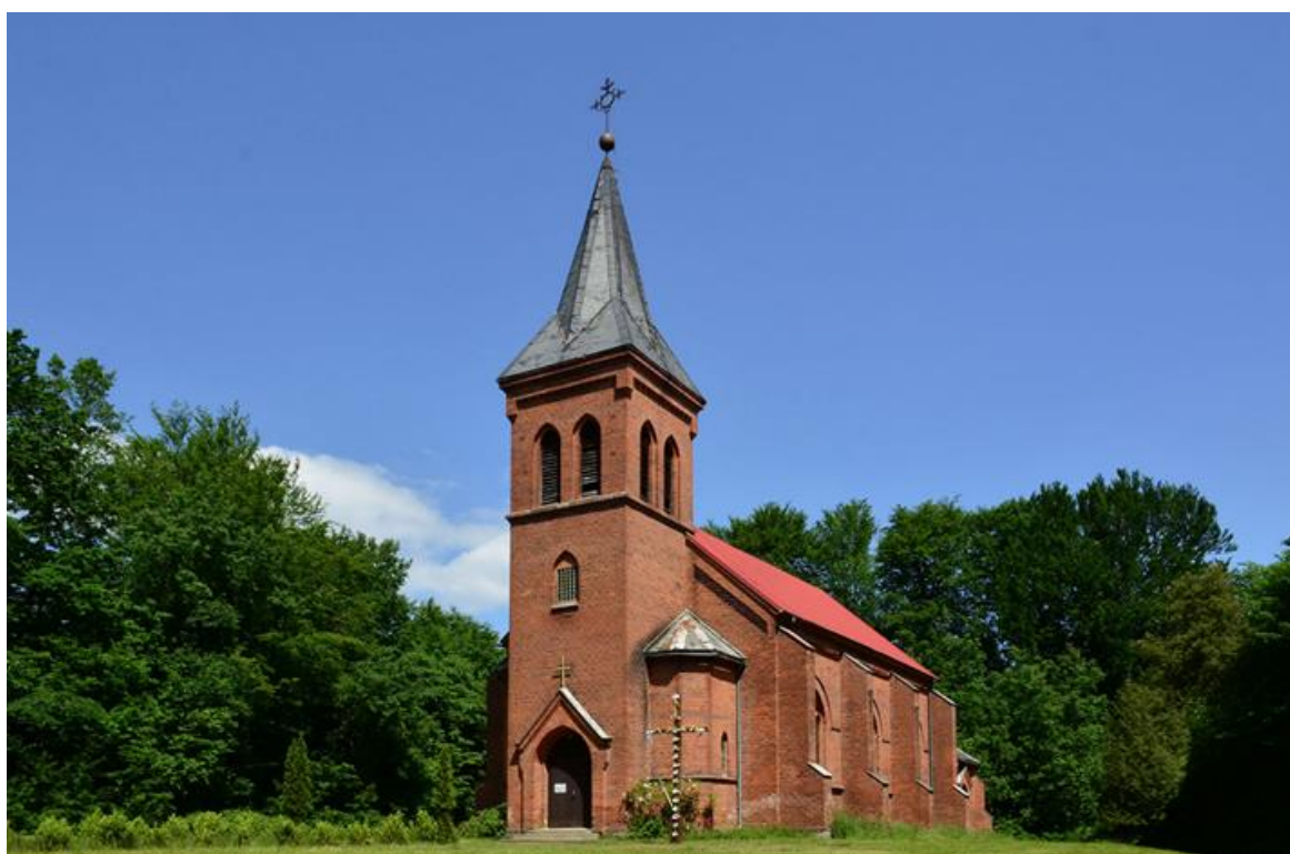
Rysunek 16. Kościół ewangelicki, ob. rzymskokatolicki parafialny pw. Matki Boskiej Częstochowskiej w Trzebiechowie