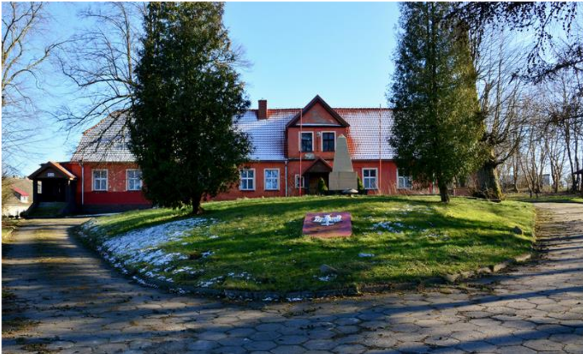
Rysunek 19. Park dworski w Wierzchowie (widok na podjazd do dworu)