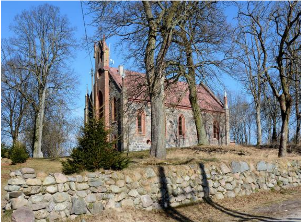
Rysunek 15. Kościół ewangelicki, ob. rzymskokatolicki filialny pw. Najświętszej Rodziny z przykościelnym cmentarzem ewangelickim w miejscowości Spore