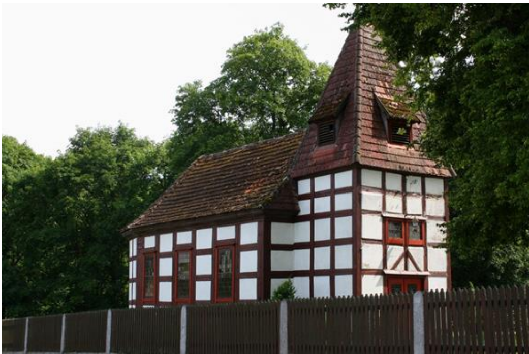
Rysunek 6. Kościół ewangelicki, ob. rzymskokatolicki filialny pw. Matki Boskiej Różańcowej w Drawieniu (przed i w trakcie remontu)

Jest to kościół szachulcowy o konstrukcji słupowo-ramowej. Szachulec to bardzo charakterystyczny typ ściany szkieletowej, w którym zastosowana jest drewniana rama wypełniona gliną. Posiada on jedną nawę bez wyodrębnionego prezbiterium i jest zamknięty pięciobocznie. Wieża ma kształt kwadratu od frontu z kruchtą w przyziemiu. Zakończona jest czworobocznym, ostrosłupowym dachem o jednej krawędzi, który pokryty jest dachówką. Wewnątrz kościoła znajduje się strop belkowy z polichromią 26 .