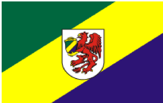
Rysunek 4. Flaga herbowa gminy Szczecinek