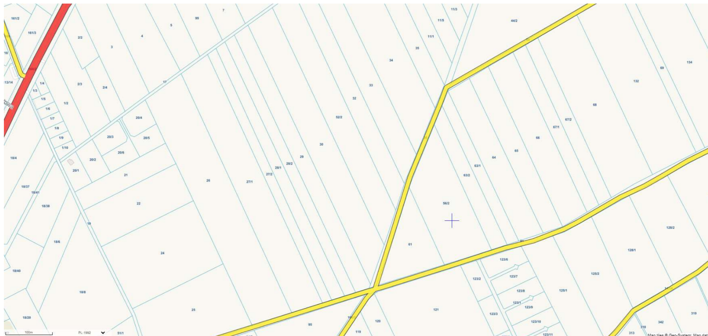
Ryc. Położenie Głazu Jarosikowego 53°59'00"N 14°48'48"E (działka nr 56/2 obręb Grabowo)

Załącznik nr 2 do UCHWAŁA NR III/43/24 RADY MIEJSKIEJ W KAMIENIU POMORSKIM z dnia 25 czerwca 2024 r. w sprawie ustanowienia pomnika przyrody nieożywionej oraz w sprawie pomnika przyrody nieożywionej