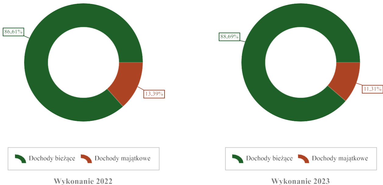
Wykres 2: Struktura dochodów ogółem Gminy Krzęcin w 2023 roku w porównaniu do roku 2022