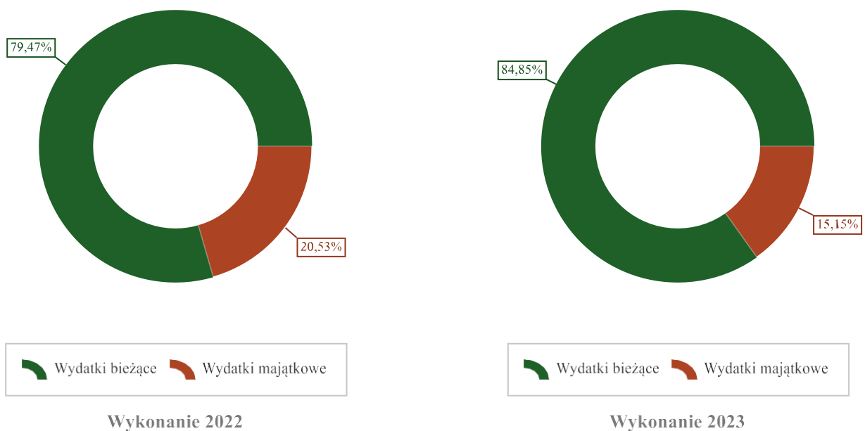
Wykres 3: Struktura wydatków ogółem Gminy Krzęcin w 2023 roku w porównaniu do roku 2022