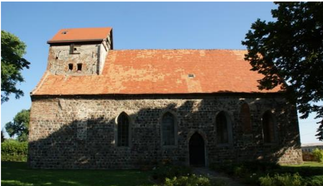
Fot.12. Kościół w Buku.

10) Kościół w Buku p.w. św. Antoniego wraz z cmentarzem (nr rej A-498). Zbudowany został z ciosów granitowych w 2 poł. XIII w., przebudowywany z użyciem cegły w XVI w. i ponownie w 1869 r.,