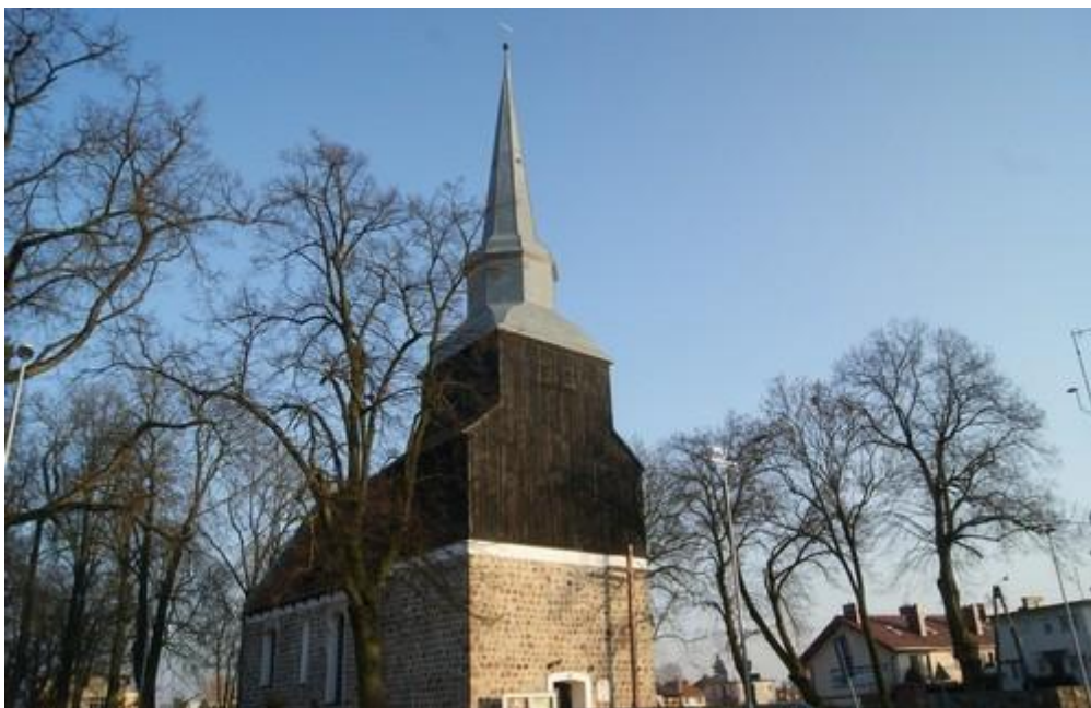
Fot.14. Kościół w Mierzynie.

12) Kościół w Mierzynie p.w. Matki Boskiej Bolesnej wraz z cmentarzem przykościelnym (nr rej A-477). Jest murowany z ciosów granitowych. Powstał w 2 poł. XIII w., po pożarze wieży w 1637 r., odbudowany w 1644 r.