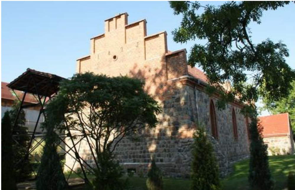
Fot.13. Kościół w Dobrej.

11) Kościół w Dobrej p.w. Matki Boskiej Królowej Świata (nr rej A-497). Kościół wzniesiono w 2 poł. XIII w. z ciosów granitowych, został przebudowany z użyciem cegły w 1879 r. z nadaniem mu form neogotyckich,