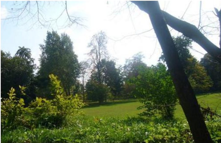
Fot.3. Park pałacowy w Kościnie.

3) Park pałacowy w Kościnie (nr rej A-577). Obecnie słabo czytelny dawny układ kompozycyjny parku, pochodzącego z 2 poł. XVIII w.,