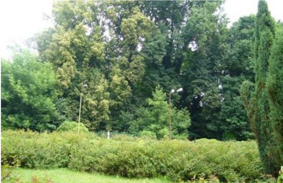
Fot. 7. Park w Stolcu.

7) Pałac i park w Stolcu (nr rej. A-536). Pałac zbudowany został w stylu klasycyzującego baroku. Budowa pałacu rozpoczęta została przez Jürgena Bernharda von Ramin w 1721r. i zakończona w 1727 r. Powstało założenie w typie „entrecour et jardin” wraz z parkiem założonym w stylu francuskim.