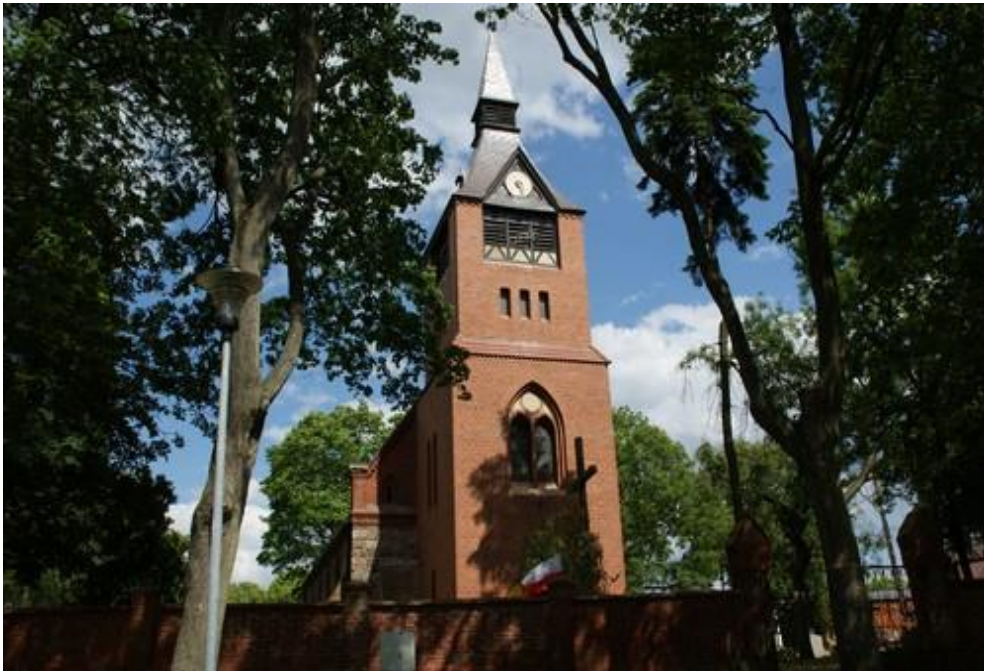
Fot.17. Kościół w Wołczkowie.

15) Kościół w Wołczkowie p. w. Matki Boskiej Szkaplerznej wraz z cmentarzem przykościelnym (nr rej. A-509). Kościół jest murowany z ciosów kamiennych i cegły. Powstał w końcu XIII w., częściowo przebudowany w XVI w.