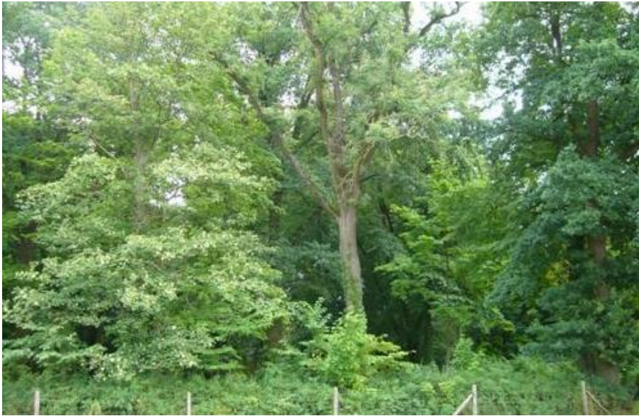
Fot.5. Park dworski w Skarbimierzycach.

5) Park dworski w Skarbimierzycach (nr rej A-531). Obecnie z trudem czytelny, zachowany dawny układ kompozycyjny parku, pochodzącego z końca XVIII w.,