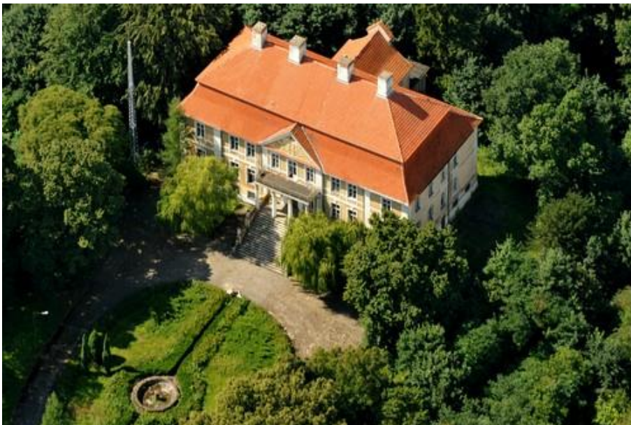
Fot. 8. Pałac w Stolcu.