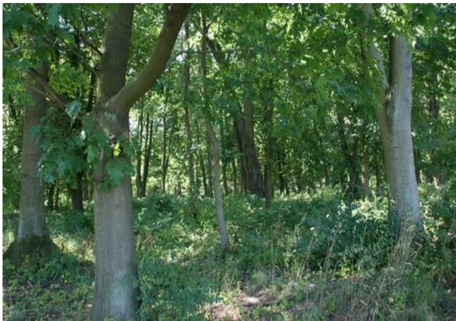
Fot. 1. Park pałacowy w Bezzreczu.

1) Park pałacowy w Bezzreczu (nr rej A-864). Obecnie z trudem czytelny, zachowany dawny układ kompozycyjny parku, pochodzącego z końca XVIII w.,