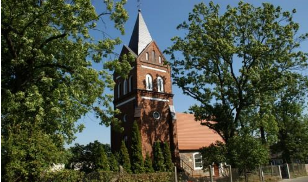
Fot.11. Kościół w Bezzeczu.

9) Kościół w Bezzeczu p.w. Matki Boskiej Różańcowej wraz z cmentarzem przykościelnym (nr rej. A-503). Kościół jest murowany z kamienia polnego w XV w., został przebudowany w 2 poł. XIX w., otrzymał wówczas ceglana neogotycką wieżę. Na terenie cmentarza ochroną prawną objęto też fragment kamiennego muru cmentarnego.