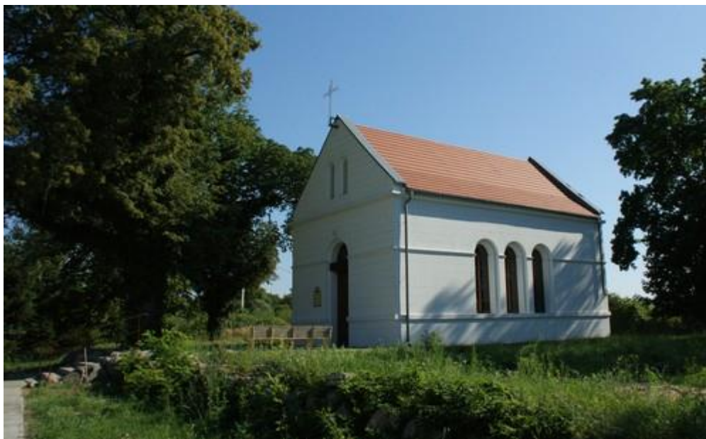
Fot.16. Kaplica w Kościnie.

14) Kościół filialny p.w. MB Fatimskiej (odbudowany) wraz z terenem cmentarza przykościelnego i kamiennym murem ogrodzeniowym położony w miejscowości Kościno (rej. nr A-1136). Kaplica powstała w pierwszej ćwierci XIX w.