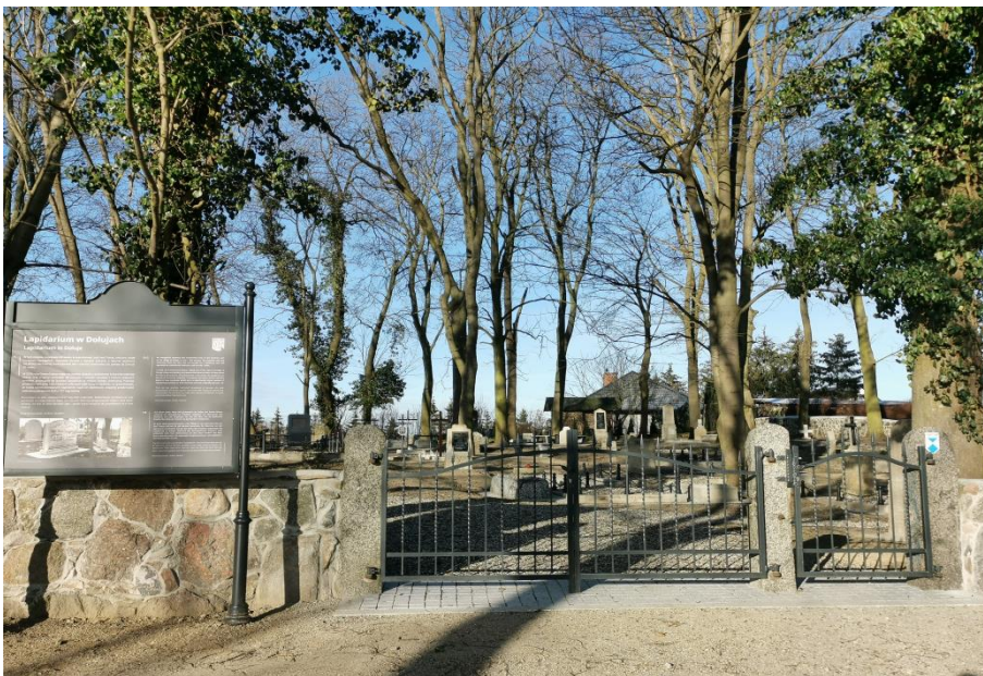
Fot.6. Lapidarium w Dołujach.

6) Lapidarium w Dołujach powstałe na terenie dawnego cmentarza ewangelickiego z połowy XIX w. położonego przy ul. Daniela w miejscowości Dołuje na działce nr 164 (nr rej. A-1566). Cmentarz został zamknięty Uchwałą Nr XL/527/2023 Rady Gminy Dobra z dnia 9 lutego 2023r. w sprawie zamknięcia cmentarza na terenie Gminy Dobra.