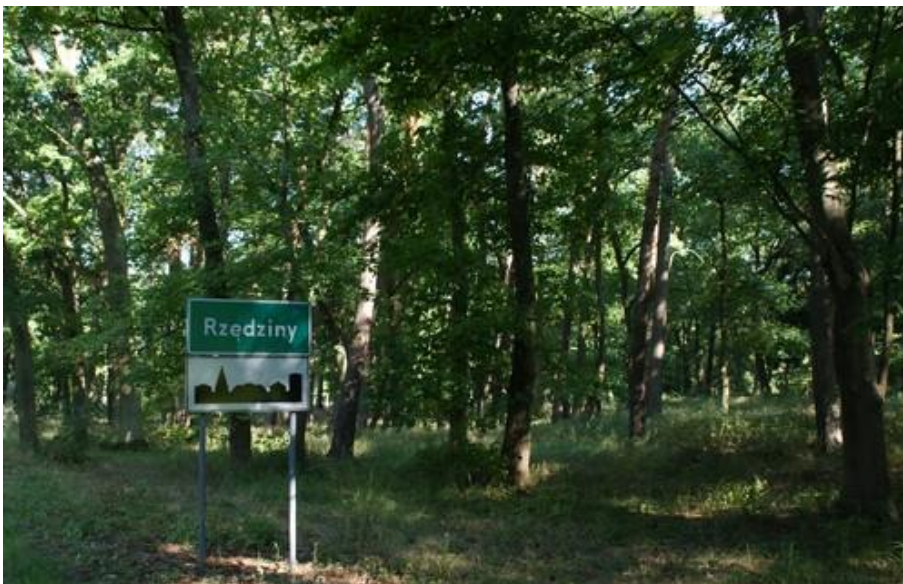
Fot. 4. Park dworski w Rzędzinach.

4) Park dworski w Rzędzinach (nr rej A-532). Obecnie z trudem czytelny, zachowany dawny układ kompozycyjny parku, pochodzącego z końca XVIII w.,