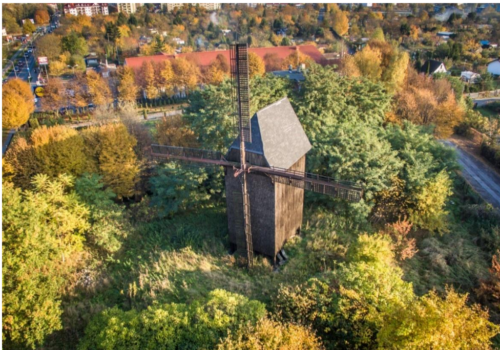
Fot.18. Wiatrak w Mierzynie.

16) Wiatrak koźlak w Mierzynie (nr rej. A-523). Wiatrak w konstrukcji drewnianej zbudowany został w 1830 r.