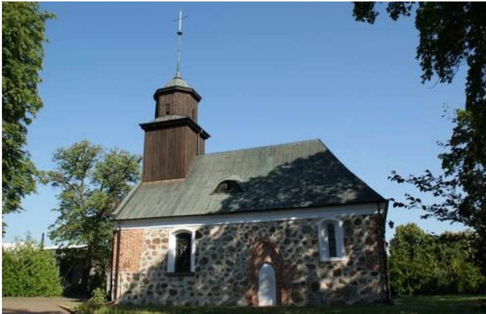
Fot.15. Kościół w Wąwelnicy.

13) Kościół p.w. Matki Boskiej Częstochowskiej w Wąwelnicy (nr rej. A-508). Jest murowany z kamienia polnego, powstał w 2 poł. XIII w., został rozbudowany w XV w., a następnie przebudowany w XVIII w.