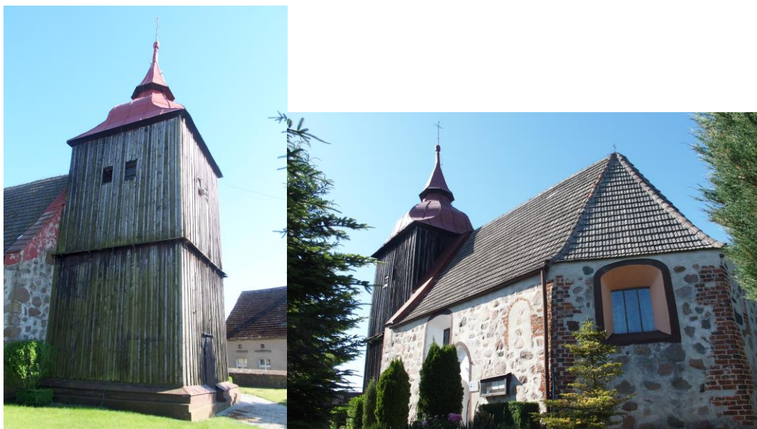
Zdjęcia nr 9, 10. Kościół filialny pw. MB Szkaplerznej, Stodkówko

Kościół pochodzi z ok. 1470 r., przebudowany w XVIII i XIX w., z dzwonnica z pocz. XVIII w.