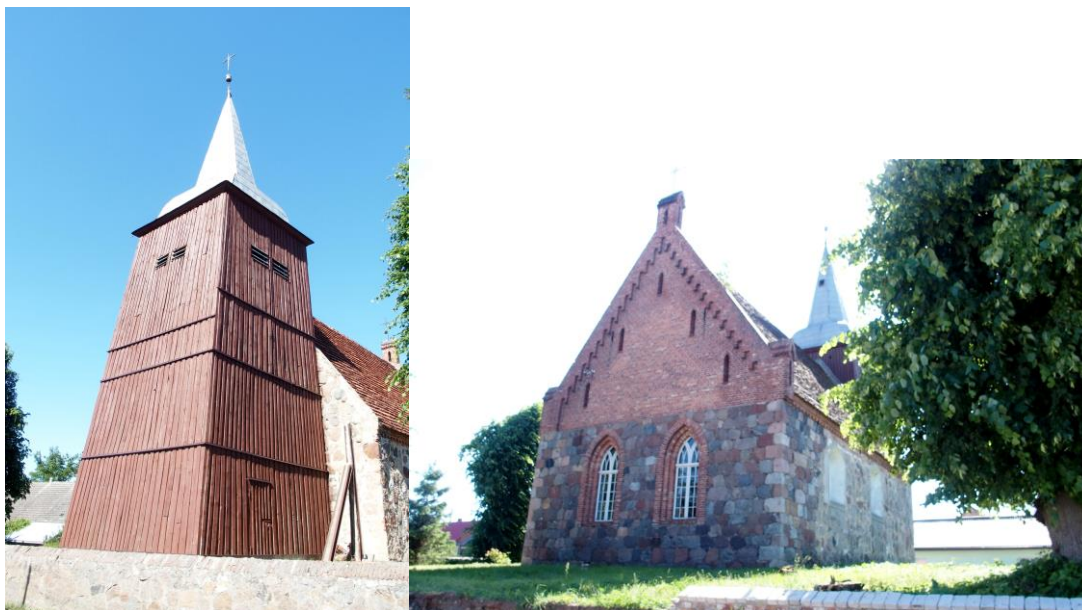
Zdjęcia nr 7, 8. Kościół filialny pw. św. Józefa, Słodkowo