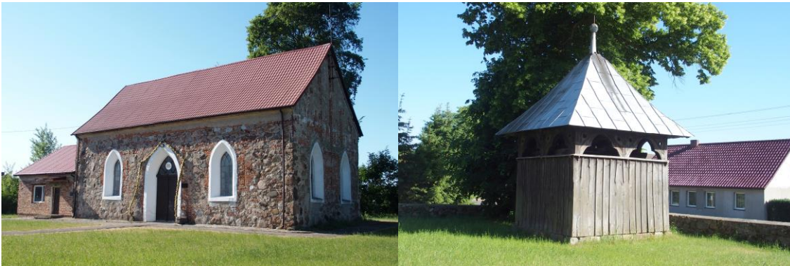
Zdjęcie nr 1, 2. Kościół filialny pw. Chrystusa Króla, dzwonnica przy kościele Brudzewice

Późnogotycki, wzniesiony w XV w., w 1807 r. gruntownie przebudowany i na nowo wyposażony. Przy kościele drewniana dzwonnica kozłowa z XIX w.