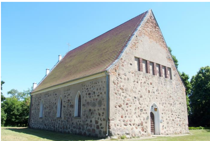
Zdjęcie nr 4. Kościół filialny pw. św. Franciszka z Asyżu, Nosowo