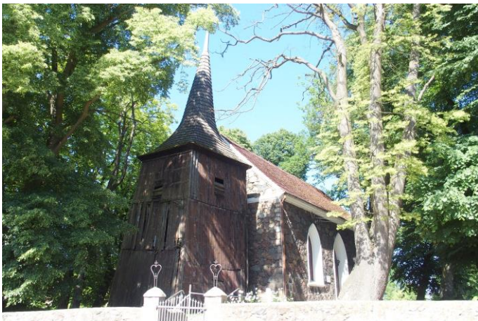
Zdjęcie nr 3. Kościół filialny pw. MB Różańcowej, Modrzewo

Data budowy pierwszej świątyni pozostaje nieznana. Obecny pochodzi z 1825 r. Wolnostojąca, drewniana dzwonnica przy zach. ścianie szczytowej kościoła pochodzi z 1720 r.