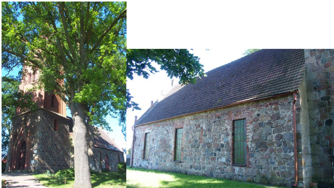
Zdjęcia nr 5, 6. Kościół filialny pw. Najświętszego Serca Pana Jezusa, Sadłowo

Późnogotycki z 2 poł. XVI w., wieża neogotycka 1860 - 1885, przebudowana w pocz. XX w.