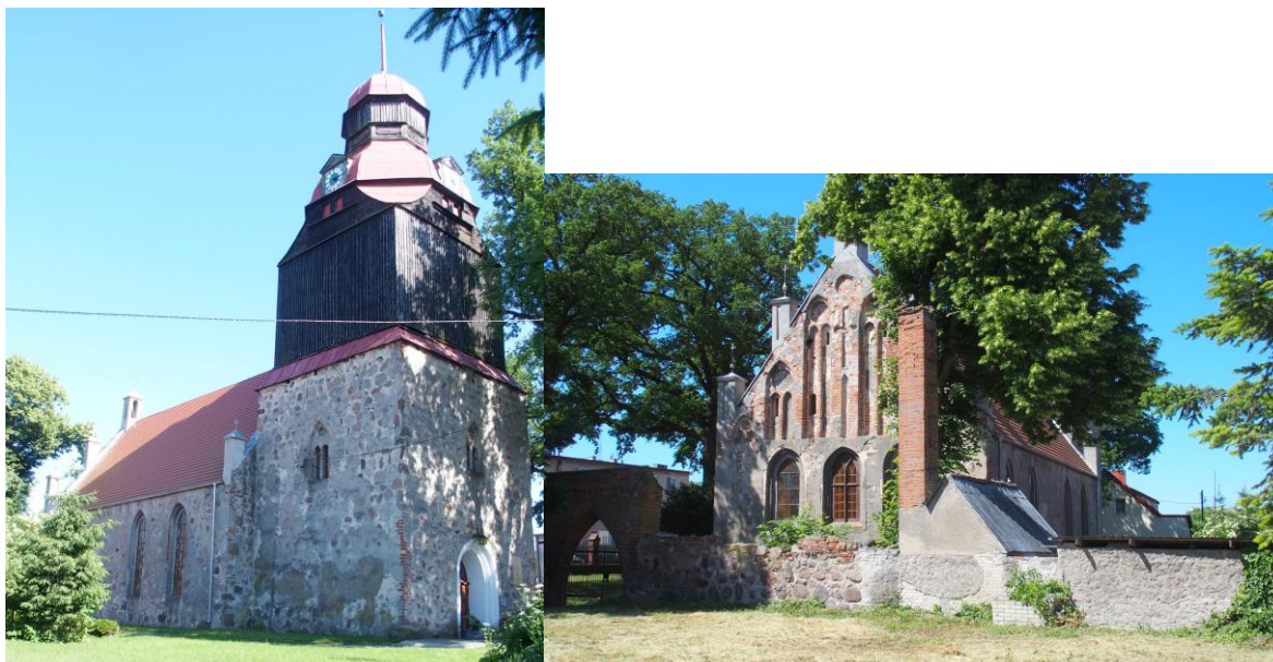
Zdjęcia nr 13, 14. Kościół parafialny pw. MB Nieustającej Pomocy, ul. Kard. A. Hłonda 12A, Suchań

Wzniesiony w latach 1491 - 1492, z wieżą dobudowaną w XV w., przebudowaną w formie barokowej w 1696 r. W 1 ćw. XX w. wzniesiono nowa plebanię.