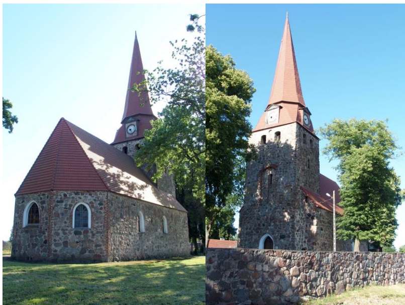
Zdjęcia nr 17, 18. Kościół filialny pw. św. Antoniego, Żukowo