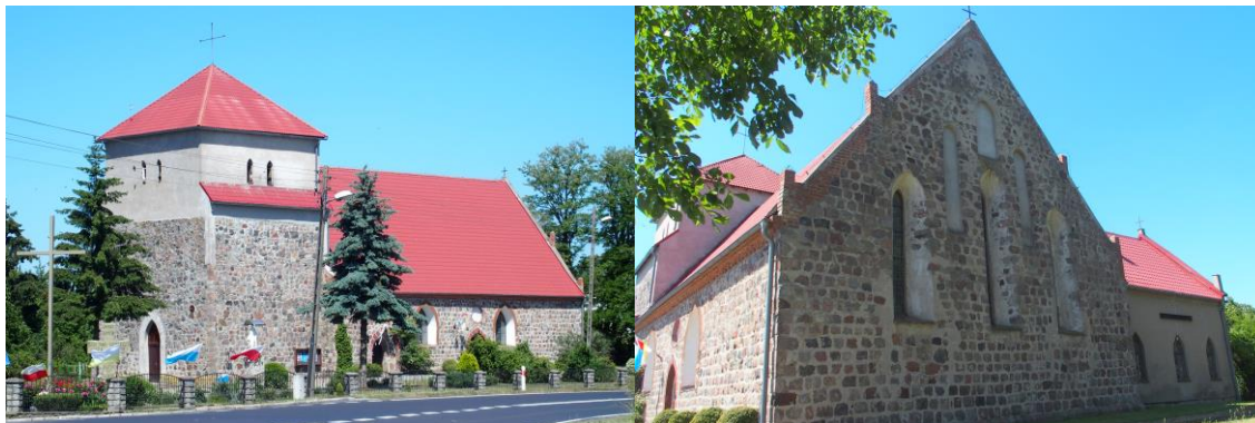
Zdjęcie nr 15, 16. Kościół pw. św. Jana Kantego, Wapnica

Wzniesiony w końcu XIII w., wczesnogotycki, wzmiankowany w 1492 r. jako parafialny. Wieża z XVI w., w XVII - XVIII w. otrzymała barokowy hełm. Uszkodzony w czasie działań wojennych, długo nieużytkowany. Odbudowany w latach 1980 - 1983 z podwyższeniem wieży, która uzyskała obecny kształt.