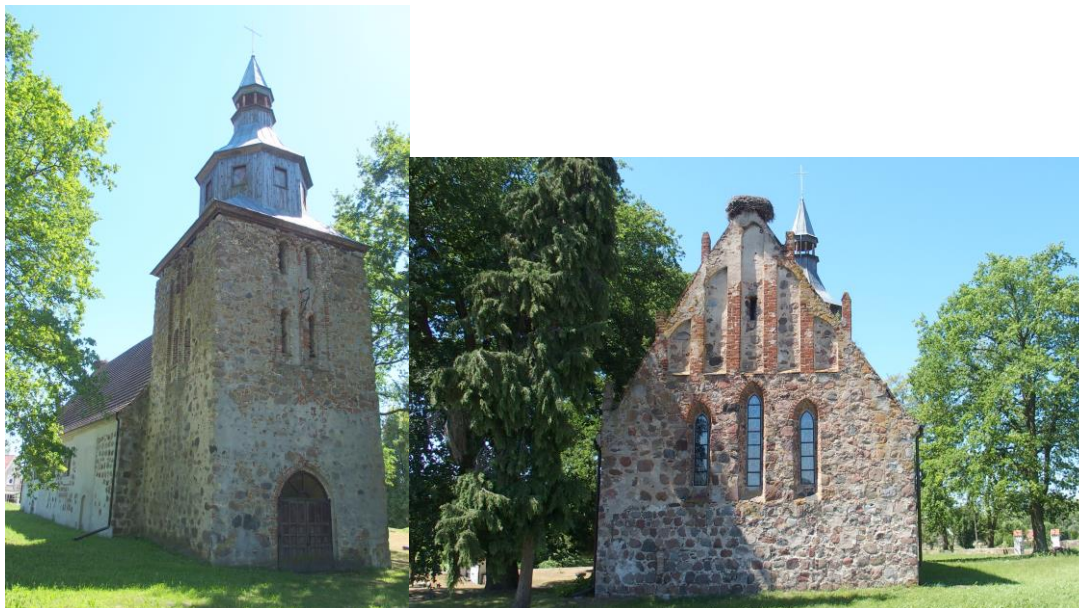
Zdjęcia nr 11, 12. Kościół pw. Chrystusa Króla, Suchanówko

Kościół pochodzi z końca XIII w., z wieżą z XV - XVI w., zwieńczoną barokowym hełmem z XVII - XVIII w. W 1881 r. remontowany. Po 1945 r. opuszczony i stał w ruinie do 1989 r. kiedy rozpoczęto odbudowę.