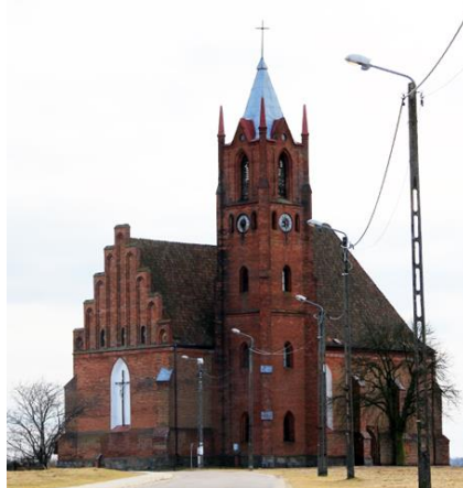
Fotografia 1. Widok na Kościół p.w. Matki Boskiej Królowej Świata w Kisielicach.