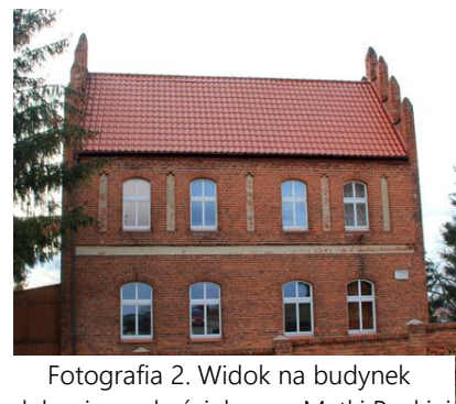
Fotografia 2. Widok na budynek plebani przy kościele p.w. Matki Boskiej Królowej Świata w Kisielicach.