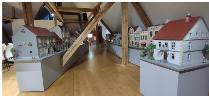
Fotografia 17. Widok na izbę pamięci w Kisielicach.

W Kisielicach na wyremontowanym poddaszu budynku szkoły utworzono Izbę Pamięci, która prezentuje dokumenty dotyczące historii ziemi kisielickiej, ważnych dla Kisielic osobistości, pełniąc też rolę mini-muzeum dokumenty dotyczące historii ziemi kisielickiej, ważnych dla Kisielic osobistości, pełniąc też rolę mini-muzeum. Głównym eksponatem w Izbie Pamięci jest wykonana przez artystę plastyka makietą nieistniejącego Rynku Starego Miasta Kisielice, która została odtworzona w skali 1:20 zabudowy Rynku Starego Miasta Kisielice z początku XX wieku oddający tym samym klimat tamtego czasu. Atrakcją Izby Pamięci jest sterowiec „Hindenburg” odtworzony w skali 1:40.”.