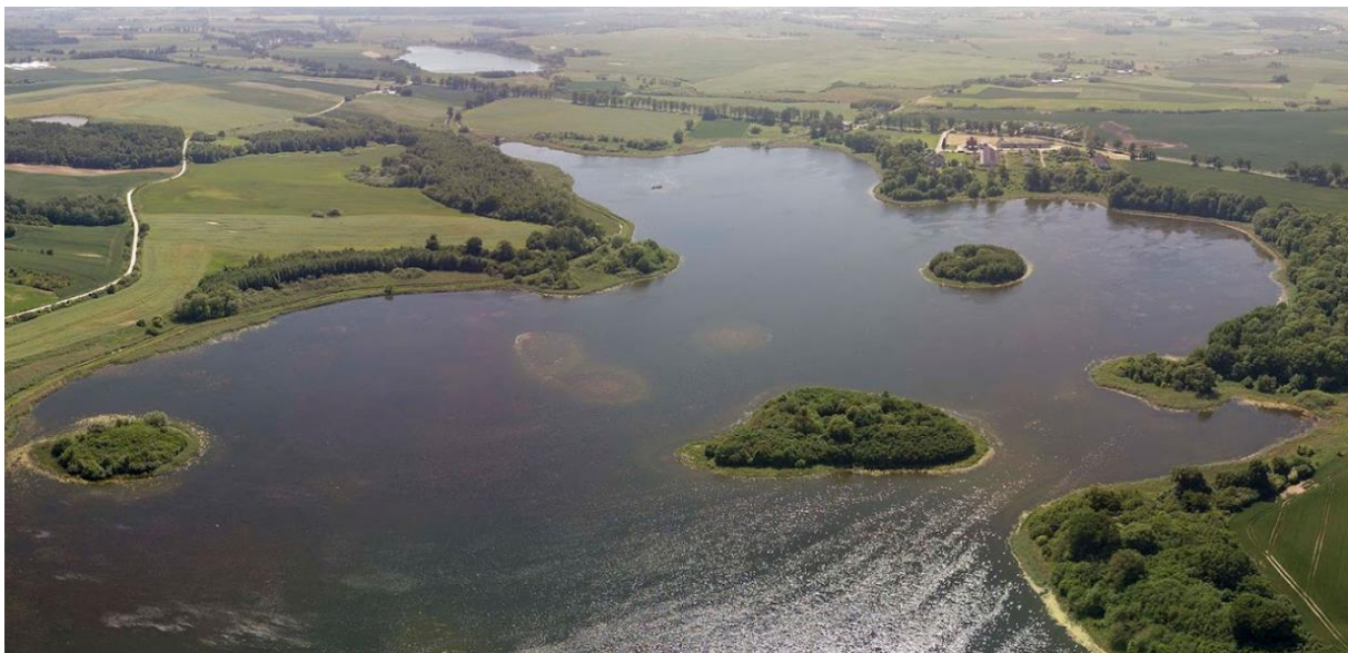
Fotografia 16. Widok na wyspki na stawie Łodygowo – wpisane do rejestru zabytków.