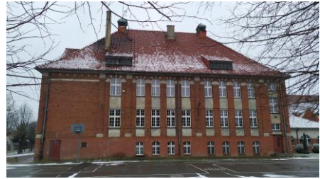
Fotografia 14. Widok na Budynek Szkoły Zespołu Szkół w Kisielicach.

Budynek został wybudowany w 1913 r. Usytuowany jest w pół-wsch. części miasta, na parceli pomiędzy ul. Daszyńskiego a Wojska Polskiego, sąsiadującej od wschodu z terenem Urzędu Miasta i Gminy a od zachodu z terenem dawnej mleczarni. Budynek bez wyraźnie określonych cech stylowych z elementami antykizującymi secesji oraz neobaroku (portal, sygnaturki, pilastrowanie). Dokonano poprawy stanu zabytkowego budynku szkoły w Kisielicach wraz z budową windy zewnętrznej przystosowanej dla osób niepełnosprawnych wraz z infrastrukturą towarzyszącą za kwotę ponad 2 mln złotych. Planowane są kolejne prace remontowe zabytkowej szkoły, które mają na celu powstrzymanie zachodzących procesów destrukcji substancji zabytkowej, wyeliminowanie przyczyn zniszczeń, ochronę substancji zabytkowej oraz przywrócenie obiektowi odpowiednich wartości funkcjonalnych i estetycznych.