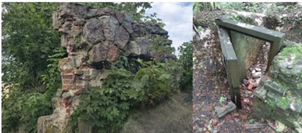
Fotografia 9. Widok na ruiny bramy wjazdowej i pałacu w Ogródzieńcu.

W chwili obecnej widoczne są tylko fragmenty bramy wjazdowej prowadzącej na teren pałacu, zarys bryły fundamentowej i porozrzucane fragmenty murów.