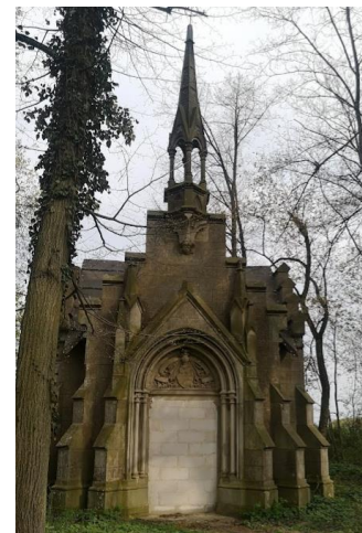
Fotografia 5. Widok na Kaplicę grobową Albertsów w Truplu.

Obiekt jest objęty ochroną poprzez wpis do rejestru zabytków.