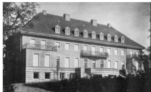
Fotografia 8. Archiwalne zdjęcie pałacu w Ogrodzieńcu.

Była to budowla murowana z cegły i otynkowana, dwukondygnacyjna z użytkowym poddaszem, podpiwniczona. Wzniesiono ją na planie prostokąta i przykryto dachem ceramicznym czterospadowym, z umieszczonymi od strony ogrodu lukarnami. W fasadzie frontowej usytuowano ryzalit zwieńczony trójkątnym szczytem i z reprezentacyjnym wejściem w przyziemiu. W elewacji ogrodowej, dwa skrajne ryzality stanowiły podstawy do wyodrębnienia na poziomie drugiej kondygnacji tarasów otoczonych balustradami. Trzeci taras znajdował się na parterze budynku, a po obu jego stronach znajdowały się schody wiodące do ogrodu (powyżej znajdował się również balkon). W elewacjach umieszczone były prostokątne okna w ozdobnych obwódkach gzymsowych.