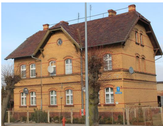
Fotografia 12. Widok na dom pracowników kolei przy ul. Kolejowej 7.

Fizyczne przecięcie linii w kierunku Jabłonowa nastąpiło w 1925 roku, kiedy wybudowano nową 14 kilometrową trasę Kisielice – Biskupiec Pomorski. Po klęsce Polski w Kampanii Wrześniowej w 1939 Niemcy odbudowali torowisko i przywrócili ruch pociągów w kierunku Jabłonowa. Taki stan utrzymywał się do 1945 roku, kiedy po przegranej przez Niemcy II wojny światowej i zajęciu tych terenów przez wojska radzieckie nastąpiła rozbiórka linii kolejowej na odcinku Kisielice – Kwidzyn. Polskie władze prawdopodobnie planowały jej odbudowę, ponieważ na zachowanym rozkładzie jazdy z 1946 roku widnieje dopisek: „Na odcinku Kisielice – Kwidzyn pociągi na razie nie kursują”. Do odbudowy jednak nigdy nie doszło. Linia Kisielice – Biskupiec Pomorski Miasto funkcjonowała do 1969 roku, a jej rozbiórka nastąpiła w 1974. W tym momencie Kisielice przestały być węzłem kolejowym.