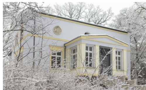
Fotografia 6. Widok na dwór w Krzywce po renowacji.

Znajdujący się tu majątek został utworzony jeszcze w czasach krzyżackich. Pierwotnie pełnił funkcję folwarku pomocniczego dóbr z siedzibą w miejscowości Święte [obecnie w powiecie grudziądzkim]. Majątek ten otrzymali na mocy przywileju bracia Arnold i Berthold. W XVI wieku dobra te stanowiły własność rodziny von Szembek. W XVII wieku nabył je starosta