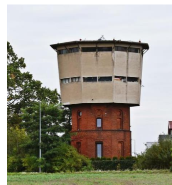
Fotografia 10. Widok na wieżę wodną.

Projekt budowy linii Prabuty – Jabłonowo Pomorskie datowany jest na ok. 1896 rok i miał połączyć istniejącą już linię Malbork – Iława z linią Toruń – Iława. Prace budowlane nie trwały długo, bo już 1 października 1899 roku na 48,6 kilometrową trasę wyjechały pierwsze składy. Linia Prabuty – Jabłonowo nigdy nie miała dużego znaczenia, gdyż służyła przede wszystkim do przewozu ludzi i produktów rolnych. Wszystkie stacje na