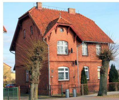
Fotografia 11. Widok na dom pracowników kolei przy ul. Kolejowej 13.