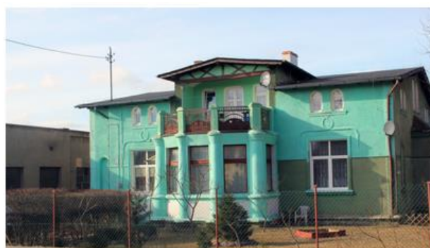
Fotografia 13. Przykład budynków mieszkalnych przy ul. Daszyńskiego 18 (od lewej) i 22.