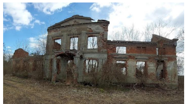
Fotografia 7. Widok na ruiny pałacu w Limży.

Prawdopodobnie pod koniec XV wieku Limża wraz z jeziorem zostały sprzedane Hansowi von Kospoth. Po 1700 roku wieś stała się własnością państwa pruskiego. Za zasługi w wojnach śląskich przeciwko Austrii pułkownik Otto