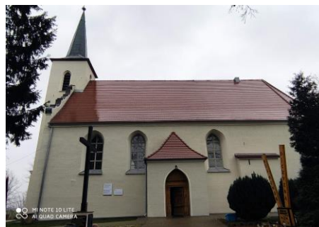
Fotografia 4. Widok na Kościół p.w. Niepokalanego Poczęcia Maryi Panny w Łęgowie.

Stan zachowania dobry, prowadzono prace konserwacyjne: