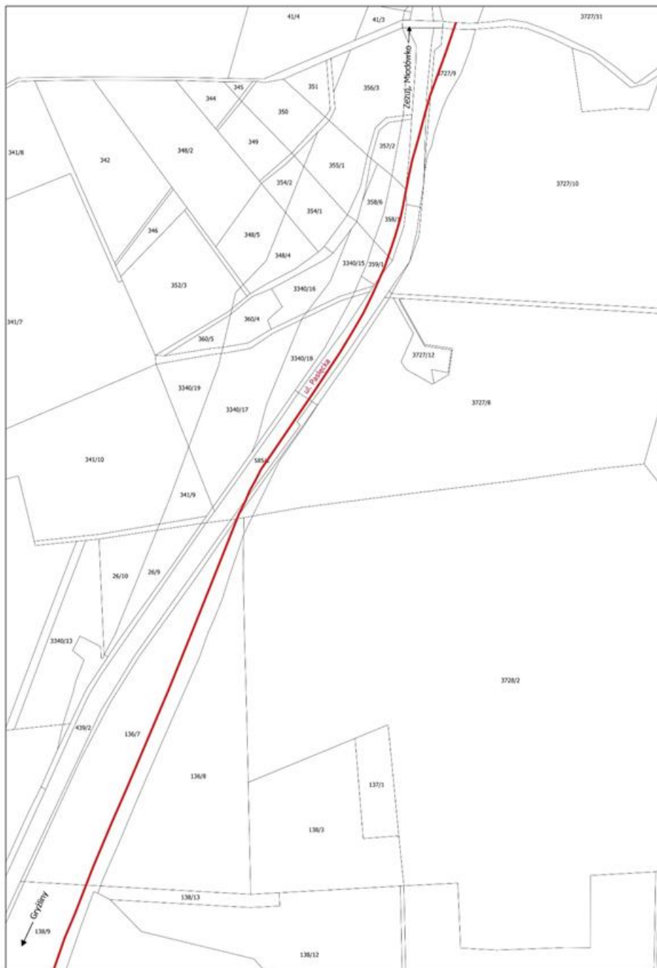
— obręb Gryżliny, ul. Pastęcka