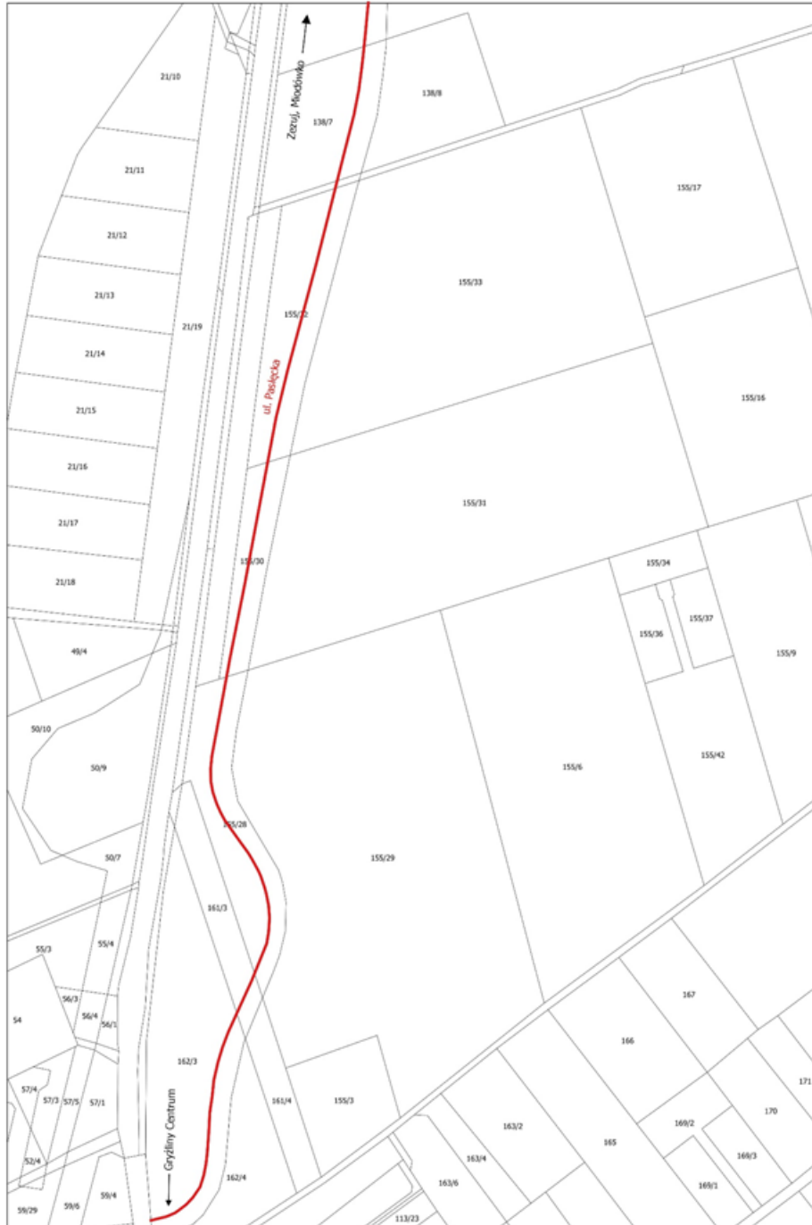
— obręb Gryźliny, ul. Paścicka