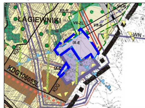
WYRYS ZE ZMIANY STUDIUM UWARUNKOWAŃ I KIERUNKÓW ZAGOSPODAROWANIA PRZESTRZENNEGO GMINY NIEMCE

Obszar objęty planem w całości zlokalizowany jest w granicach udokumentowanego Głównego Zbiornika Wód Podziemnych nr 406 Niecka Lubelska