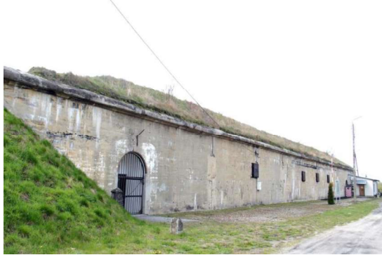
Zdjęcie nr 6. Prochownia Terespol w zespole fortów Twierdzy Brzeskiej, ul. Topolowa 6g

Prochownia została zbudowana na pocz. XX w. i pełniła rolę magazynu amunicyjnego dającego zaopatrzenie obiektom rozlokowanym na terenie Przedmościa Terespolskiego. Prochownia była głęboko cofnięta poza główną linię obrony. Umiejscowiona w bezpośrednim sąsiedztwie zabudowań miasteczka posiadała własną bocznicę kolejową łączącą ją z drogą kolejową Warszawa-Brześć.