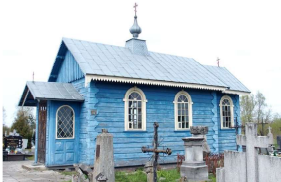
Zdjęcie nr 7. Kaplica cmentarna pw. Zmartwychwstania Pańskiego, ul. Wojska Polskiego

Kaplica wzniesiona w 1903 r., remontowana w 1930 r. i po 1970 r. Drewniana, konstrukcji zrębowej, oszalowana. Orientowana, jednonawowa, na planie prostokąta z węższym prostokątnym prezbiterium i małym prostokątnym przedsionkiem od frontu. Na narożach aplikacje z faliście wyciętych desek. Okna zamknięte półkolistie, w deskowych obramieniach. Dachy dwuspadowe, kryte blachą, nad nawą ostrosłupowa wieżyczka z żelaznym krzyżem prawosławnym na kuli. Nad przedsionkiem i prezbiterium na kalenicy krzyże. Ikonostas eklektyczny XIX/XX w.