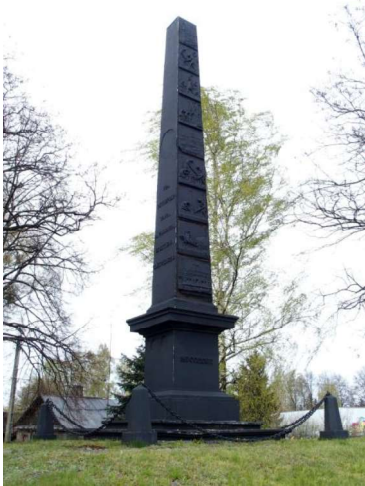
Zdjęcie nr 5. Pomnik upamiętniający zakończenie budowy Traktu Brzeskiego, ul. Wojska Polskiego

Pomnik usytuowany jest w centrum miasta, na skrzyżowaniu z drogą do Kodnia i Sławatycz. Jest to żelazny obelisk, wzniesiony na pamiątkę ukończenia pierwszej w Królestwie Polskim drogi bitej Warszawa-Siedlce-Terespol-Brześć, tzw. traktu warszawsko-brzeskiego (budowanego w 1820-1823, z inicjatywy Stanisława Staszica i Dyrekcji Generalnej Dróg i Mostów Królestwa Polskiego; zwanego też po prostu „traktem brzeskim”).