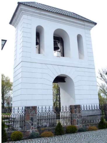
Zdjęcie nr 2. Dzwonnica w zespole cerkwi prawosławnej pw. św. Jana Teologa

Klasycystyczna dzwonnica usytuowana jest obok cerkwi, w płn.-wsch. narożniku dawnego cmentarza cerkiewnego. Jest typu bramowego z końca XVIII w. Murowana z cegły, otynkowana. W formie dwukondygnacyjnej bramy, z boniowanym przyziemiem i pilastrami opinającymi naroża drugiej kondygnacji, zwieńczona belkowaniem, z zamkniętymi półkolistymi otworami: przelotu na osi przyziemia i trzema przezroczami, z których środkowe szersze. Dach czterospadowy, kryty dachówką.