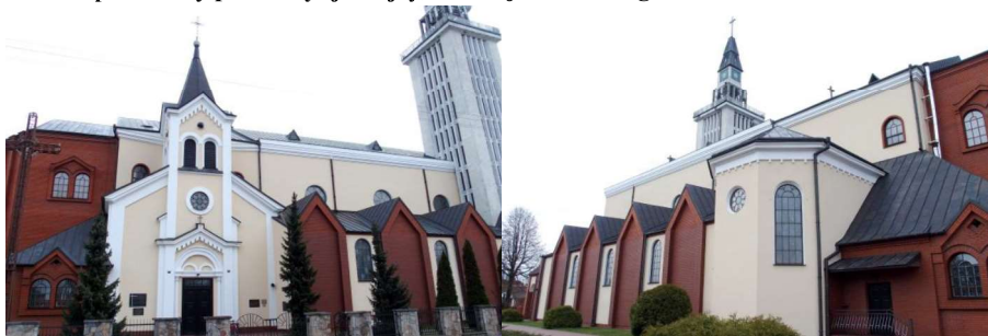
Zdjęcia nr. 3, 4. Kościół parafialny pw. Świętej Trójcy, ul. Wojska Polskiego

Kościół usytuowany jest na terenie nowego miasta. Pochodzi z 1863 r., murowany, z wysoką wieżą (kilkakrotnie przebudowywany, ze współczesną dobudową). Parafia erygowana w 1697 r., wówczas wzniesiony drewniany kościół z fundacji Józefa Bogusława Słuszki i jego żony Teresy z Gosiewskich, do 1797 r. administrowany przez dominikanów, usytuowany naprzeciwko rezydencji, po płd. stronie traktu brzeskiego. Całkowicie spłonął w 1827 r. Nowy kościół wraz z murowanym klasztorem odbudowany został przed 1834 r. Klasztor skasowany w 1864 r. Kolejny, obecny kościół parafialny w nowym miejscu, ukończony w 1863 r., wg proj. budowniczego powiatu siedleckiego arch. Pawła Jabłońskiego. W 1888 r. zamknięty oraz została skasowana parafia, wznowiona w 1905 r. W latach 1981-1985, wg proj. arch. Tadeusza Witkowskiego, do zach. elewacji dobudowana została prostokątna nawa, z wieżą przy narożniku płn. zach. W latach 2000-2002 miała miejsce dalsza rozbudowa, wg proj. arch. Jerzego Filipowskiego: dobudowano od. wsch. nowego