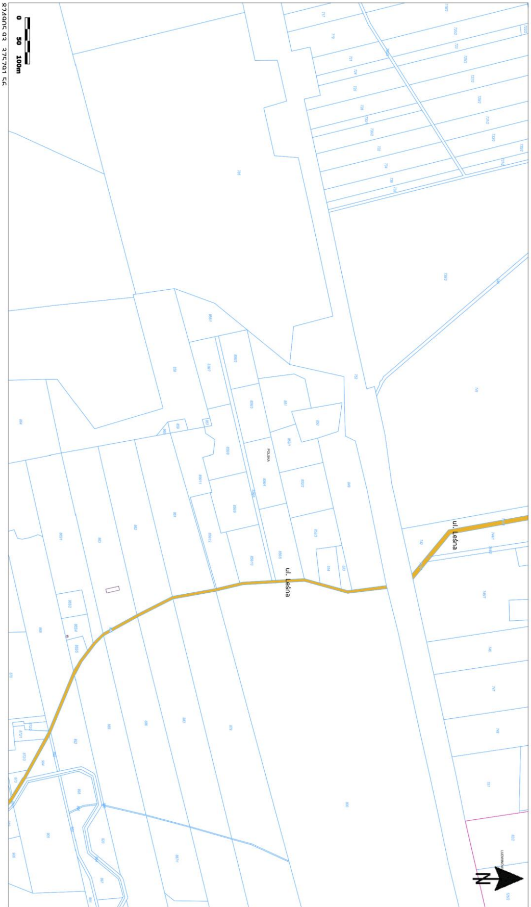
Załącznik nr 3 do uchwały nr XXXI/175/2021 z dnia 26 sierpnia 2021r.