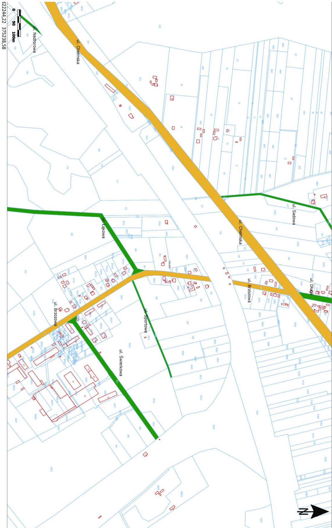
Załącznik nr 2 do uchwały nr XXXI/175/2021 z dnia 26 sierpnia 2021r. 824202.14 376363.06