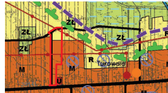
WYRYS ZE STUDYUM UWARUNKOWAŃ I KIERUNKÓW ZAGOSPODAROWANIA PRZESTRZENNEGO GMINY ZATWIERDZONEGO UCHWAŁĄ RADY GMINY PUCHACZÓW NR XLIV/286/18 Z DNIA 28 CZERWCA 2018 ROKU Skala 1:10 000