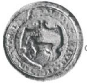
Pieczęć Parczewa z poł. XVI w.