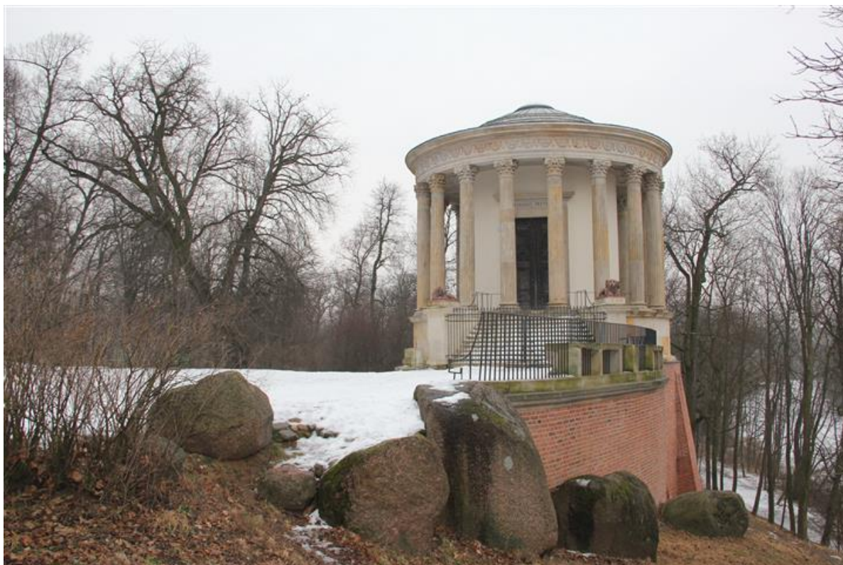
Rysunek 4. Zespół Pałacu Czartoryskich – Świątynia Sybilii