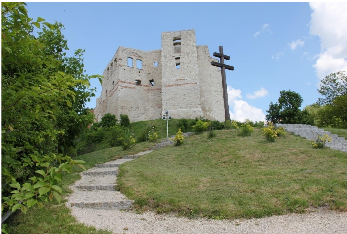
Rysunek 2. Zamek w Kazimierzu Dolnym