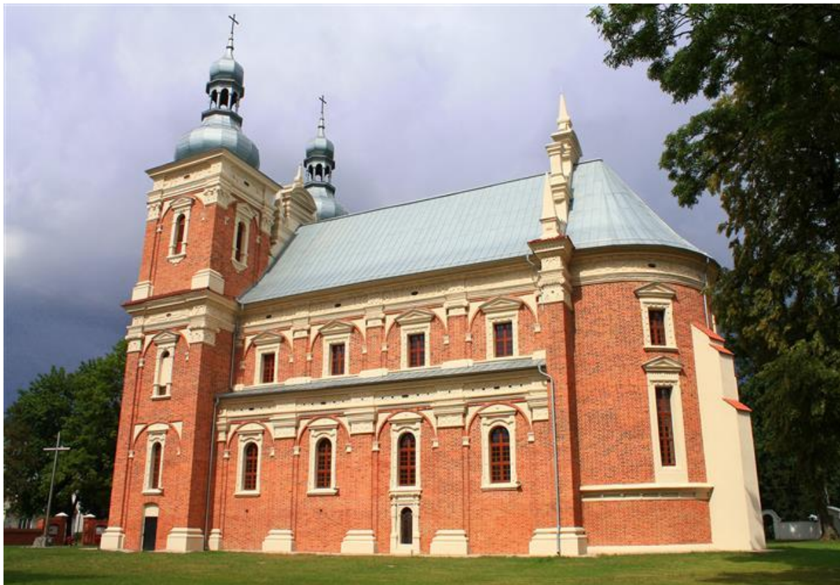
Rysunek 6. Kościół pw. Św. Floriana w Gołębiu

W kościele znajduje się figura Matki Bożej Loretańskiej wykonana z drewna kokosowego. Domek Loretański z pierwszej poł. XVII w. to połączenie dwóch mniejszych budowli: wewnętrznej kaplicy oraz zewnętrznej obudowy wykonanej z kamienia wapiennego.