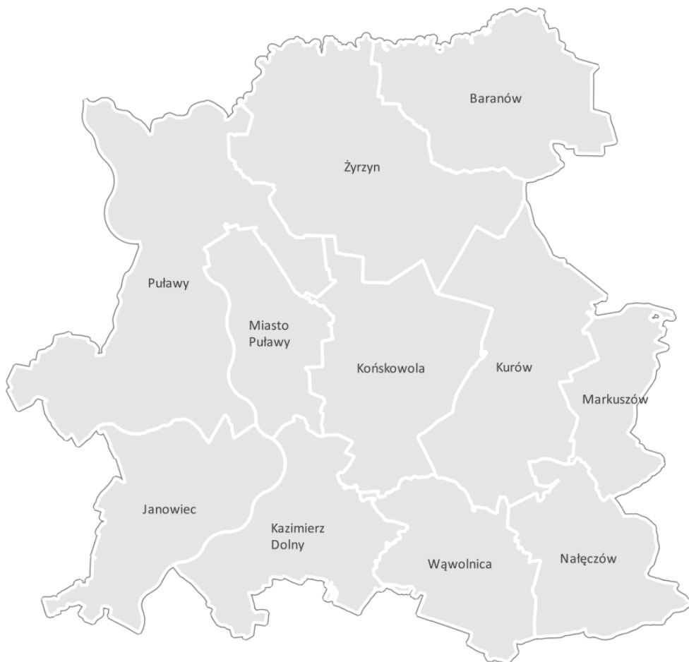
Rysunek 1. Gminy powiatu puławskiego