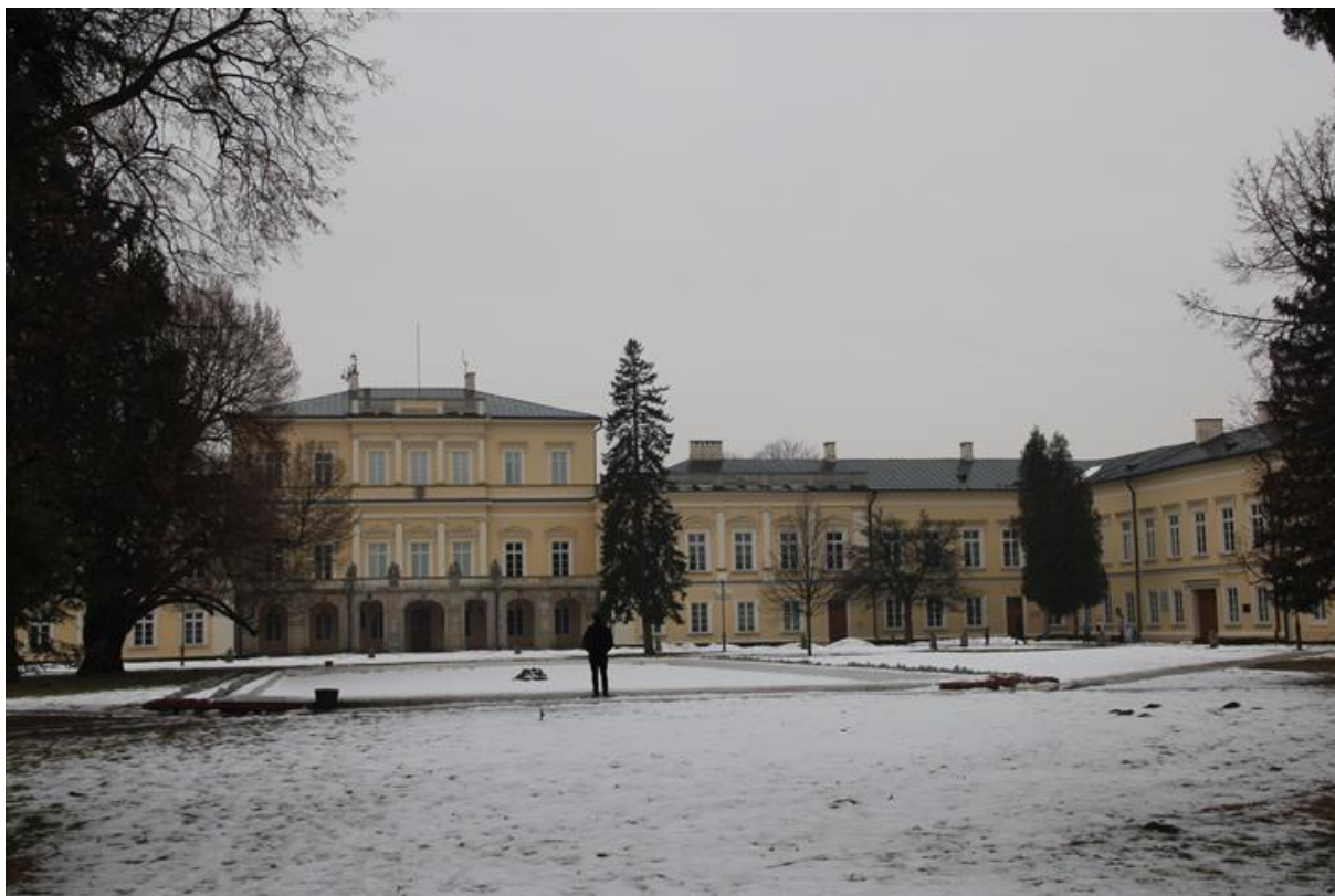
Rysunek 3. Pałac Czartoryskich