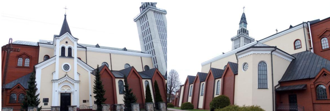
Zdjęcie nr. 3, 4. Kościół parafialny pw. Świętej Trójcy, ul. Wojska Polskiego

Kościół usytuowany jest na terenie nowego miasta. Pochodzi z 1863 r., murowany, z wysoką wieżą (kilkakrotnie przebudowywany, ze współczesną dobudową). Parafia erygowana w 1697 r., wówczas wzniesiony drewniany kościół z fundacji Józefa Bogusława Słuszki i jego żony Teresy z Gosiewskich, do 1797 r. administrowany przez dominikanów, usytuowany naprzeciwko rezydencji, po pld. stronie traktu brzeskiego. Całkowicie spłonął w 1827 r. Nowy kościół wraz z murowanym klasztorem odbudowany został przed 1834 r.