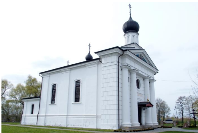
Zdjęcie nr 1. Cerkiew prawosławna pw. św. Jana Teologa