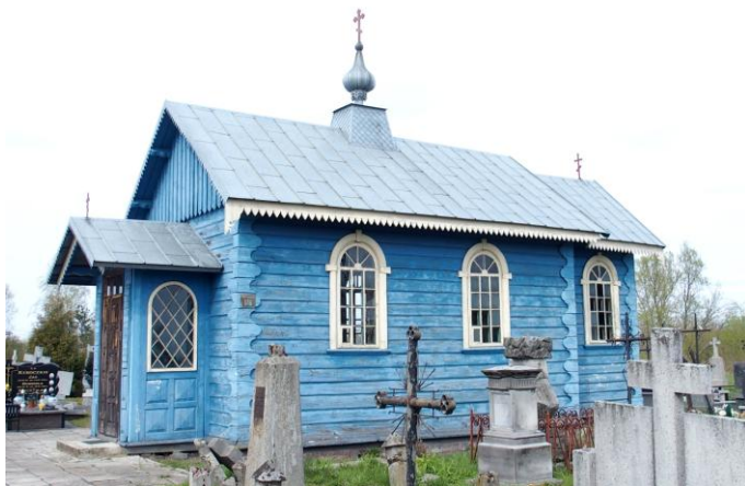
Zdjęcie nr 7. Kaplica cmentarna pw. Zmartwychwstania Pańskiego, ul. Wojska Polskiego