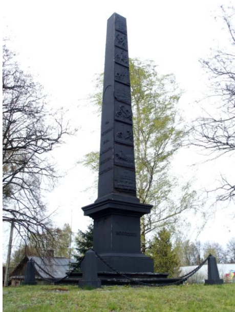
Zdjęcie nr 5. Pomnik upamiętniający zakończenie budowy Traktu Brzeskiego, ul. Wojska Polskiego

Pomnik usytuowany jest w centrum miasta, na skrzyżowaniu z drogą do Kodnia i Sławatycz. Jest to żelazny obelisk, wzniesiony na pamiątkę ukończenia pierwszej w Królestwie Polskim drogi bitej Warszawa - Siedlce - Terespol - Brześć, tzw. traktu warszawsko - brzeskiego (budowanego w 1820 - 1823, z inicjatywy Stanisława Staszica i Dyrekcji Generalnej Dróg i Mostów Królestwa Polskiego; zwanego też po prostu „traktem brzeskim”.