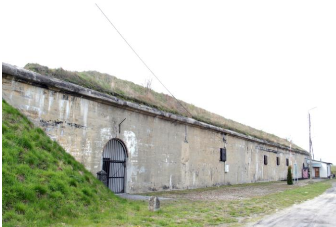
Zdjęcie nr 6. Prochownia Terespol w zespole fortów Twierdzy Brzeskiej, ul. Topolowa 6g

Prochownia została zbudowana na pocz. XX w. i pełniła rolę magazynu amunicyjnego dającego zaopatrzenie obiektom rozlokowanym na terenie Przedmościa Terespolskiego. Prochownia była głęboko cofnięta poza główną linię obrony. Umiejscowiona w bezpośrednim sąsiedztwie zabudowań miasteczka posiadała własną bocznicę kolejową łączącą ją z drogą kolejową Warszawa - Brześć.