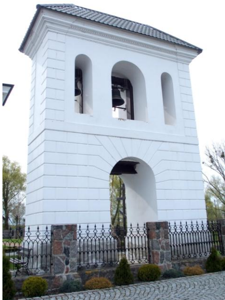
Zdjęcie nr 2. Dzwonnica w zespole cerkwi prawosławnej pw. św. Jana Teologa

Klasykistyczna dzwonnica usytuowana jest obok cerkwi, w płn. - wsch. narożniku dawnego cmentarza cerkiewnego. Jest typu bramowego z końca XVIII w. Murowana z cegły, otynkowana. W formie dwukondygnacyjnej bramy, z boniowanym przyziemiem i pilastrami opinającymi naroża drugiej kondygnacji, zwieńczona belkowaniem, z zamkniętymi półkoliście otworami: przelotu na osi przyziemia i trzema przezroczami, z których środkowe szersze. Dach czterospadowy, kryty dachówką.