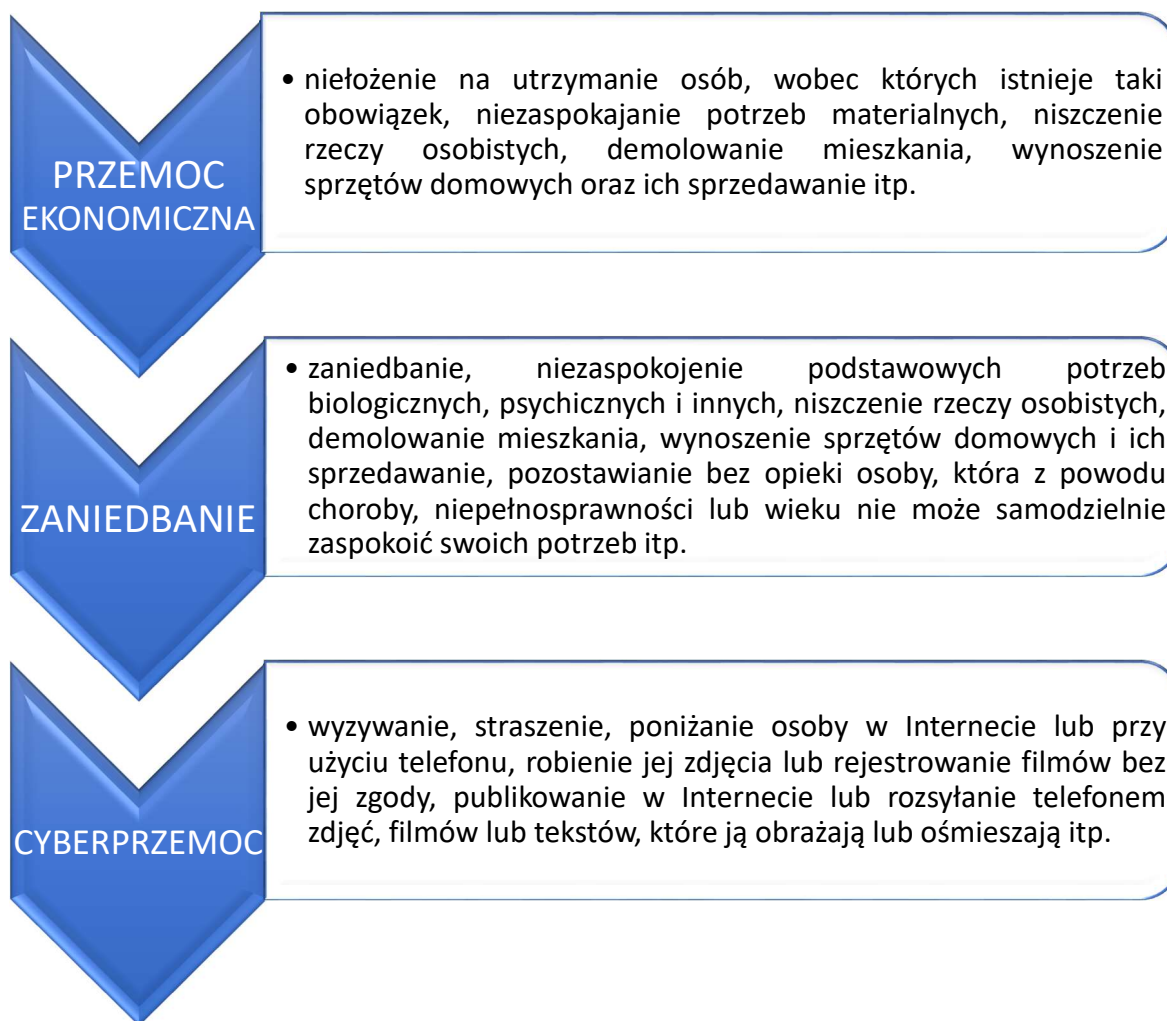
Rysunek 1. Rodzaje i formy przemocy