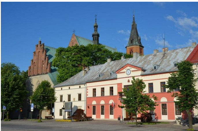
Zdjęcie nr 8. Rynek 1 w Olkuszu