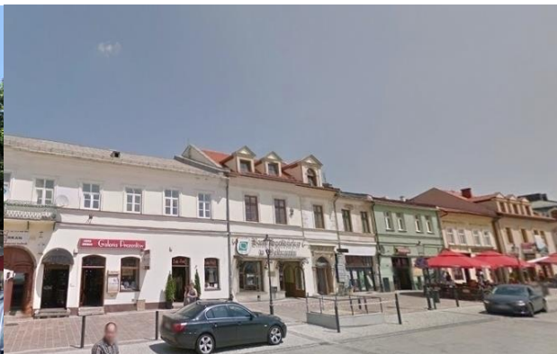
Zdjęcie nr 11. Ciąg kamienic Rynek w Olkuszu