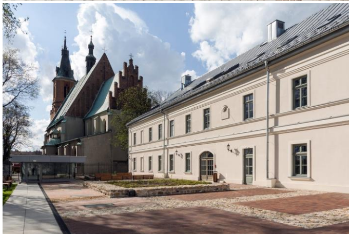
Zdjęcie nr 6, 7. Rynek 4 w Olkuszu

Budynek wzniesiony w 1828 r. z przeznaczeniem na urząd starostwa , które znajdowało się w Olkuszu od 1819 r. tj. do włączenia miasta do Królestwa Polskiego. Funkcje siedziby władz powiatowych obiekt pełnił do 1975 r. Budynek zbudowany w stylu klasycystycznym, usytuowany w pld.-zach. narożniku rynku na czterech działkach lokacyjnych. Na pierwszej od strony kościoła mieściła się w końcu XVI w. mennica królewska. Na trzeciej z kolei (na lewo od wejścia do dzisiejszego budynku „Starostwa”), znajdowała się siedziba władz górniczych. Odbywały się w niej posiedzenia sądu górniczego, mieściła archiwum i więzienie żupne, zapewne w częściowo jeszcze zachowanych piwnicach.