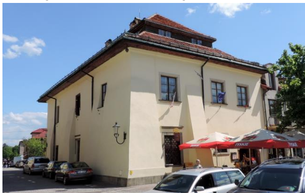
Zdjęcie nr 10. Rynek 20 w Olkuszu