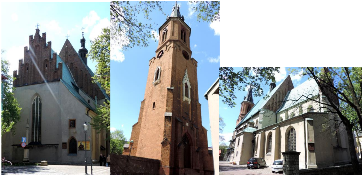
Zdjęcia nr 3, 4, 5. Bazylika mniejsza św. Andrzeja Apostoła, ul. Szpitalna 1 w Olkuszu

Pierwsza wzmianka o świątyni jest datowana na 1317 r. Jednak najstarsza część wybudowana w stylu późnoromańskim została wzniesiona jeszcze w XIII w i stanowi ona obecne prezbiterium. Kościół został rozbudowany w stylu gotyckim za panowania Kazimierza Wielkiego, w XV i XVII w. dobudowano renesansowe kaplice. W XV w. do płd. ściany kościoła dobudowano kaplicę św. Anny. W 1582 r. rozpoczęto przebudowę kościoła, która została przerwana podczas wielkiego pożaru miasta, do jakiego doszło dwa lata później. Dlatego przez następne lata świątynia była remontowana, a przy okazji rozbudowywana. W 1620 r. powstała renesansowa kaplica Loretańska zwana też Amendzińską, od nazwiska fundatora, czyli Stanisława Amendy. Jest ona wzorowana na słynnej kaplicy Zygmuntońskiej na Wawelu. Wtedy dobudowano dużą i małą kruchtę, czyli przedsionki kościoła. Pod koniec XVIII w. obok kościoła wybudowano kaplicę św. Jana Kantego, a w 1913 r. wzniesiono wysoką (63 m), neogotycką dzwonnice. W 2002 r. olkuski kościół został ustanowiony Bazyliką Mniejszą.