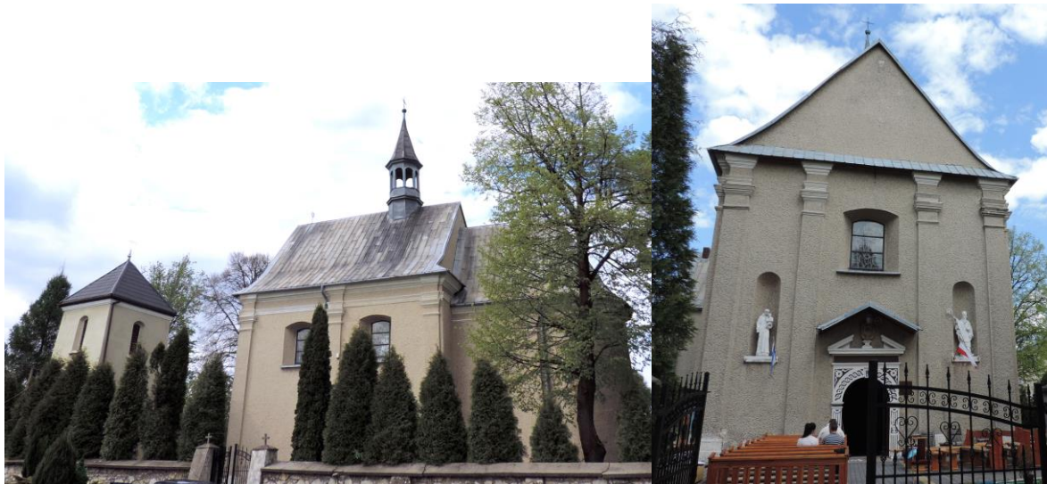
Zdjęcia nr 1, 2. Kościół parafialny pw. św. Mikołaja w Gorenicach

Budowa kościoła rozpoczęła się w 1645 r. i zainicjował ją burgrabia zamku krakowskiego, Aleksander Szembek. Kościół wzniesiono na miejscu dawnej, drewnianej świątyni z poł. XV w. Budowa nowego kościoła trwała dość długo. Zakończono ją dopiero w 1673 r. Jednak źle zbudowany kościół, zaczął szybko niszczeć. Dlatego rozebrano część ścian i postawiono nowe. Dokonał tego Michał Stanisław Tarnowski, kasztelan sieradzki. On także zlecił położenie nowych posadzek, ufundował ołtarze i naczynia liturgiczne. W 1731 r. kościół przebudowano w stylu barokowym.