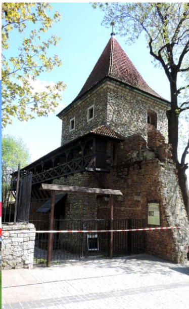
Zdjęcia nr 12, 13. Baszta i mury miejskie w Olkuszu

Baszta wzniesiona została prawdopodobnie w XIV w., przy zamianie drewniano-ziemnych umocnień na kamienno-ceglane mury obronne. Pierwotnie jako półbaszta zwieńczona krenelażem. W XV w. basztę rozbudowano, podwyższono i nakryto dachem. Skutkiem działań górniczych jako jedna z pierwszych popadła w ruinę i została rozebrana najprawdopodobniej przed poł. XVIII w.