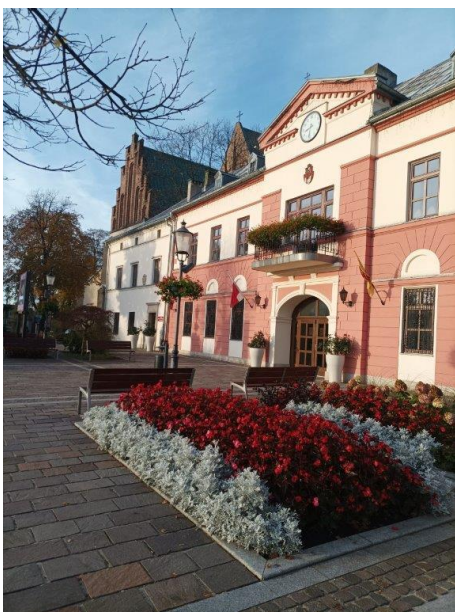
Zdjęcie nr 9. Rynek 1 w Olkuszu