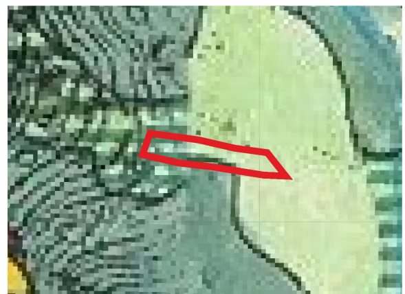
WYRYS ZE STUDIUM UWARUNKOWAŃ I KIERUNKÓW ZAGOSPODAROWANIA PRZESTRZENNEGO MIASTA SZCZAWNICA

□ STREFA OCHRONY UZDROWISKOWEJ "C" - cały obszar objęty zmianą planu