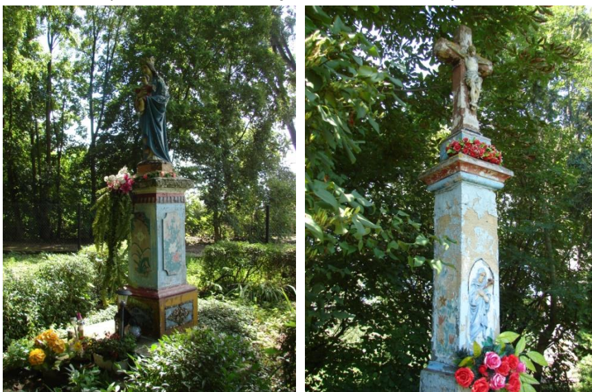
Kapliczki malowane w kwiaty „typu zalipiańskiego”