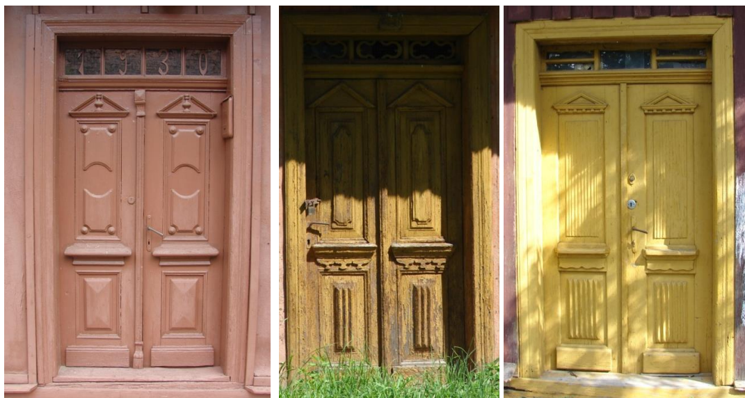
Przykłady drewnianych drzwi z Gręboszowa, Woli Żelichowskiej i Bieniaszowic

zakończenia belek stropowych pod okapem (tzw. „rysie”). Wyjątkowo cenne i stanowiące często o wartościach zabytkowych chałup są drewniane drzwi, płycinowe, zdobiono dodatkowo dekoracjami architektonicznymi.