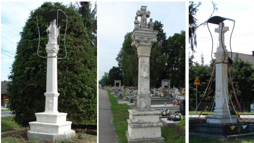
Barokowe kapliczki z Kozłowa, Gręboszowa i Borusowej