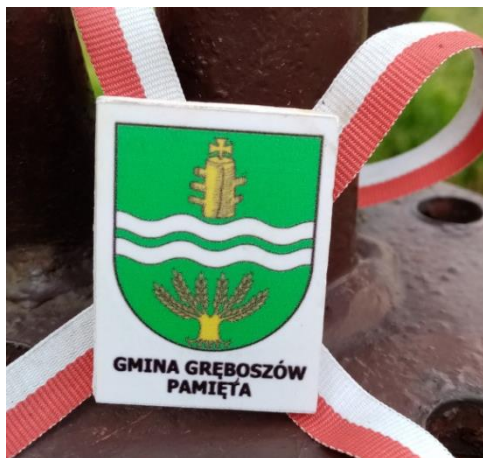
Pamiątkowa tabliczka na Pomniku Grunwaldzkim w Gręboszowie

Dla zachowania dziedzictwa kulturowego i pamięci historycznej istotne są także inne działania podejmowane przez Gminę, jak chociażby umieszczanie pamiątkowych zawieszek na pomnikach.