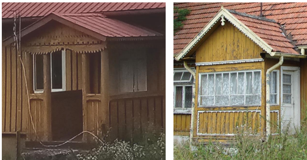
Przykłady ganków w Gręboszowie i Ujściu Jezuickim

Niektóre domy posiadają zabudowane mniej lub bardziej ganki oraz inne detale architektoniczne. Oprócz drewnianych domów na uwagę zasługują murowane domy wybudowane zapewne w okresie międzywojennym, które są również tradycyjnym elementem krajobrazu kulturowego i świadectwem przemian jakie zaczęły zachodzić na początku XX wieku.