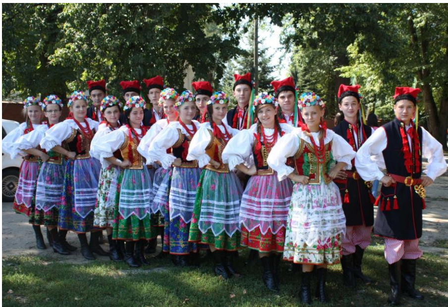
Zespół Pieśni i Tańca Ziemi Gręboszowskiej

Na terenie gminy działa Gminne Centrum Kultury i Czytelnictwa im. Jakuba Bojki, które swoje zadania publiczne wykonuje poprzez „rozpoznawanie, rozbudzanie zainteresowań i potrzeb kulturalnych środowiska, tworzenie warunków rozwoju amatorskiego ruchu artystycznego, kształtowanie wzorów aktywnego uczestnictwa w kulturze, gromadzenie, dokumentowanie, ochronę i udostępnianie dóbr kultury, edukację kulturalną oraz popularyzację wiedzy, sztuki i książki, upowszechnianie czytelnictwa, promocję Gminy Gręboszów, kultywowanie lokalnych tradycji, organizowanie imprez rekreacyjno-sportowych i rozrywkowych” itp. W ramach GCK działa Zespół Pieśni i Tańca Ziemi Gręboszowskiej, Zespół Impresjon, Kafejka Internetowa. Przez cały rok organizowane są pokazy, konkursy i koncerty, festyny, turnieje a nawet wakacyjne kino plenerowe. Co roku organizowany jest konkurs na najładniejszą palmę Wielkanocą. Gmina bierze również udział w zewnętrznych konkursach.