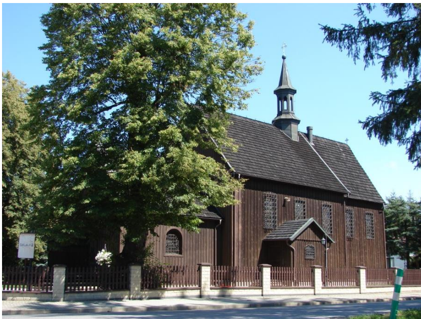
Kościół parafialny w Żelichowie

Charakterystyczne dla krajobrazu gminy Gręboszów są różnorodne kapliczki, figury i krzyże przydrożne. Najstarsze są datowane na 1 połowę XVIII wieku, a pozostałe na wiek XIX i XX. Można wyróżnić kilka zasadniczych typów tych obiektów zabytkowych. Najstarsze i najbardziej cenne są barokowe, kamienne krzyże lub figury świętych na kolumnach (słupach), wykonane najczęściej z jasnego piaskowca, z bogatą symboliką katolicką, postaciami świętych i inskrypcjami (Borusowa, Kozłów, Gręboszów). Do kolejnej grupy zaliczyć można kamienne figury Matki Bożej na cokole, datowane na drugą połowę XIX wieku oraz pierwszą połowę XX wieku. Około połowy wieku XX wieku pojawiają się na cokole również postacie Chrystusa lub św. Józefa. Tego typu kapliczki są opracowane kolorystycznie, zarówno w obrębie cokołu, jak i przedstawianej postaci. W dwóch przypadkach na kapliczkach w Borusowej zauważono malowane kwiaty. Jest to dość nowa tradycja ludowa rozprzestrzeniająca się z niedalekiego Zalipia. Kolejnym typem kapliczek przydrożnych są metalowe lub drewniane krzyże (Karsy, Zawierzbie, Gręboszów), chociaż tych jest znacznie mniej. Zaobserwowano na terenie gminy, że tradycja stawiania kapliczek nie należy bynajmniej do przeszłości, ponieważ pojawiają się nowe, o dużych walorach artystycznych. Kolejnym typem przydrożnych kapliczek są tzw. kapliczki domkowe znajdujące się w Woli Żelichowskiej, Biskupicach, Ujściu Jezuickim (murowane) oraz w Kozłowie (drewniana).