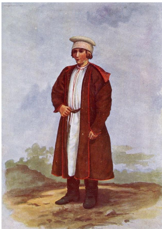
Ubiór chłopski spod Dąbrowy Tarnowskiej

W ujęciu etnograficznym gmina Gręboszów należy do regionu Krakowiaków Wschodnich. Męski strój ludowy Krakowiaków Wschodnich to biała lniana koszula, proste spodnie z płótna lnianego w pionowe, najczęściej biało-czerwone paski, pas, buty, kaftan bez rękawów lub z rękawami, sukmana i rogatywka. Ubiór kobiety charakteryzował się wielością odmian i wariantów. Inaczej ubierano się w okolicach Pińczowa, Skalmierza, Miechowa, Brzeska czy Dąbrowy Tarnowskiej. Ubiór składał się następujących elementów: chusta czepcowa (dla mężatki) lub chustka, koszula oraz często stanowiąca jej uzupełnienie oddzielna kryzka, spódnice wierzchnia i spodnia (fartuchy), zapaska, gorset, kaftan (katana), obuwie i korale.