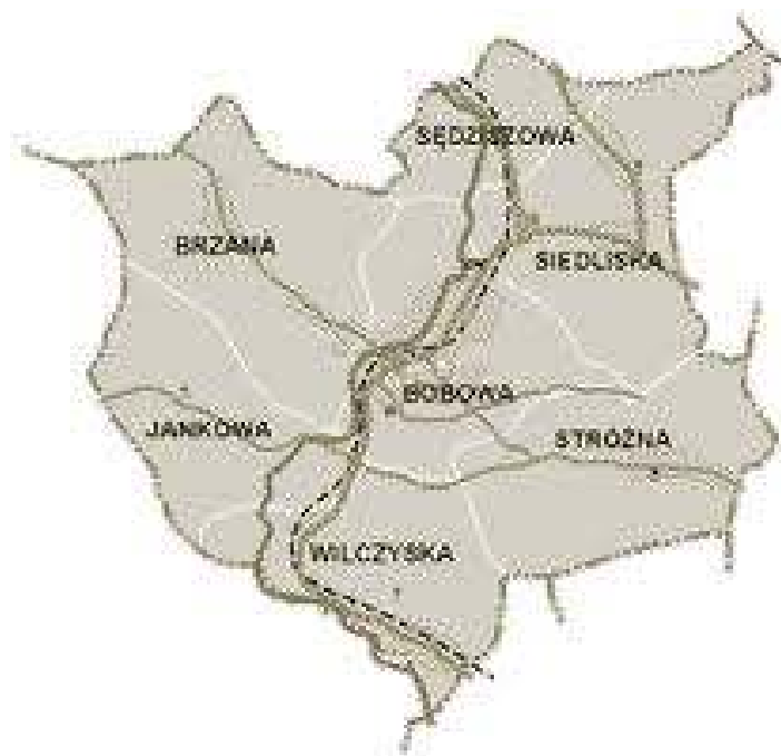
Mapa Gminy Bobowa