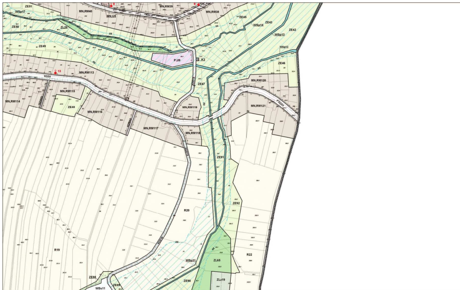
MIEJSCOWY PLAN ZAGOSPODAROWANIA PRZESTRZENNEGO GMINY POLANKA WIELKA