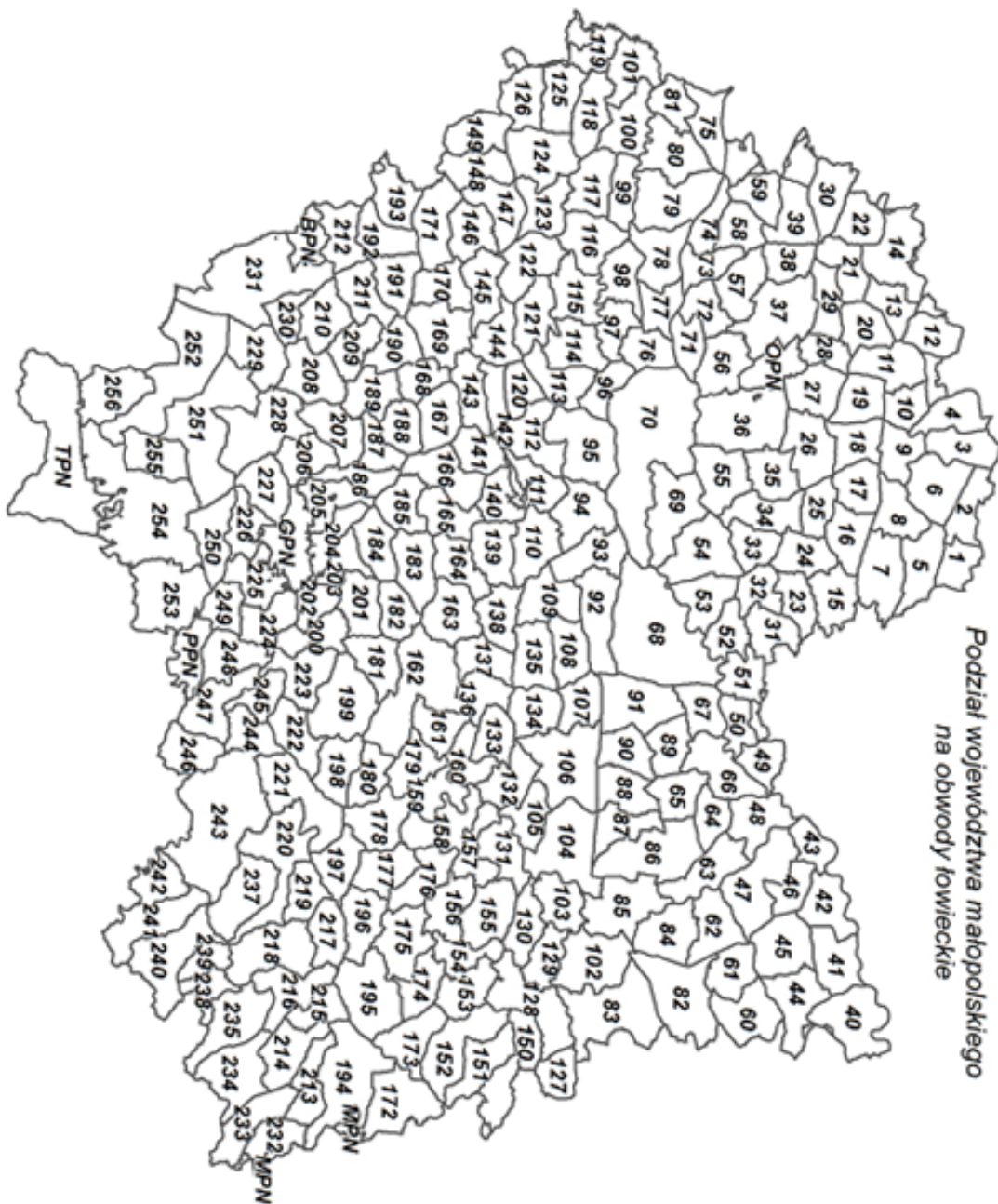
Podział województwa małopolskiego na obwody powiatowe